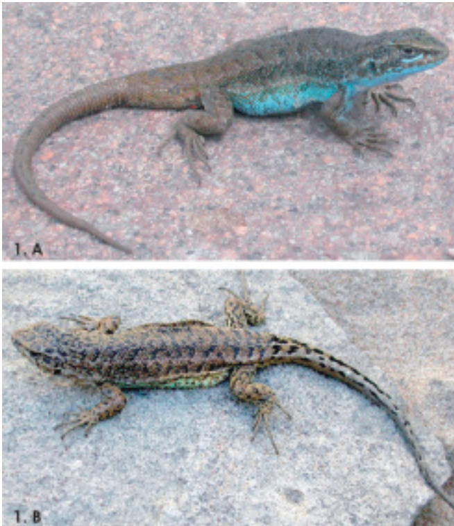
Figura 1. Ejemplares vivos de Liolaemus coeruleus macho (1.A) y Liolaemus neuquensis macho (1.B). Fotos: J.A. Scolaro, febrero 2006 Figure 1. Alive individuals of Liolaemus coeruleus male (1.A) and Liolaemus neuquensis male (1.B). Photos: J.A. Scolaro, february 2006

El patrón de coloración de los machos difiere entre ambas especies, ya que L. coeruleus muestra una peculiar tonalidad celeste en flancos y vientre, con dorso castaño-azul oscuro, mientras que L. neuquensis exhibe flancos y vientre verde oliva claro y dorso verde oscuro-castaño, con series de manchas negras irregulares transversas paravertebrales y mancha oscura occipital (Figura 1). En las hem-