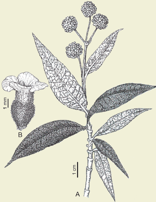
Figura 1. Buddleja araucana : a: rama, b: flor