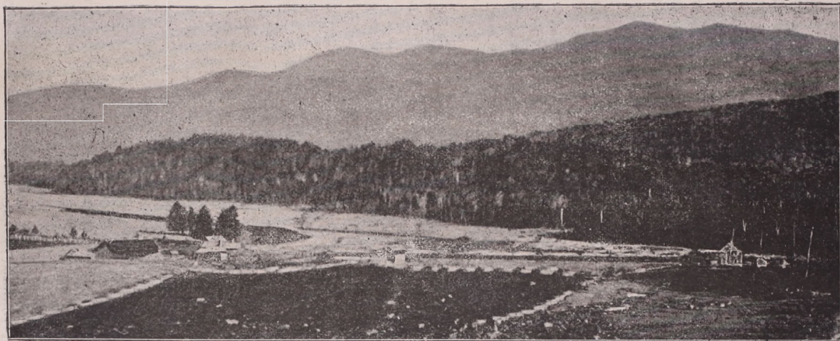
2. kép. Az Adirondack-Cottage-Sanitarium elhelyezése. (Szegényebb sorsúak számára épült tüdőbeteg-sanatorium New-York államban.)