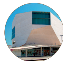
Casa da Música