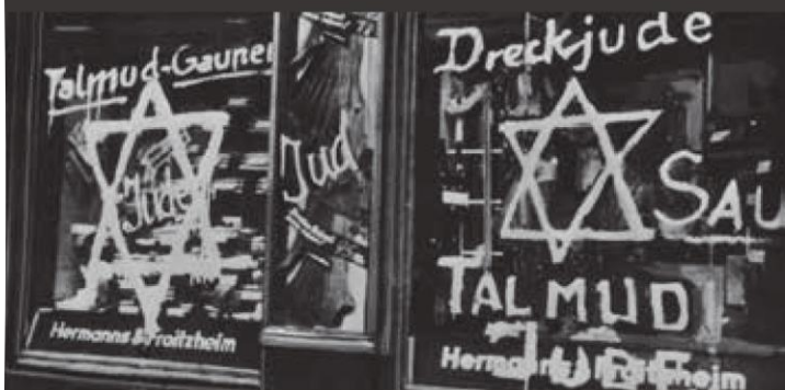
„Zsidócsillag” egy kirakatúvegen a zsidó üzletek, orvosok és ügyvédek ellen az SA és a Hitlerjugend részvételével végrehajtott bojkott napján. Frankfurt am Main, 1933. április 1.

A megszállt európai országok közül Dánia, a szövetségesek sorában pedig Olaszország és 1944 áprilisáig Magyarország nem vezette be zsidó állampolgárainak külső megbélyegzését. 1941–1942 folyamán Szlovákiában, Horvátországban, Szerbiában, Romániában, Bulgáriában is felkerült a jelzés a zsidók ruházatára.