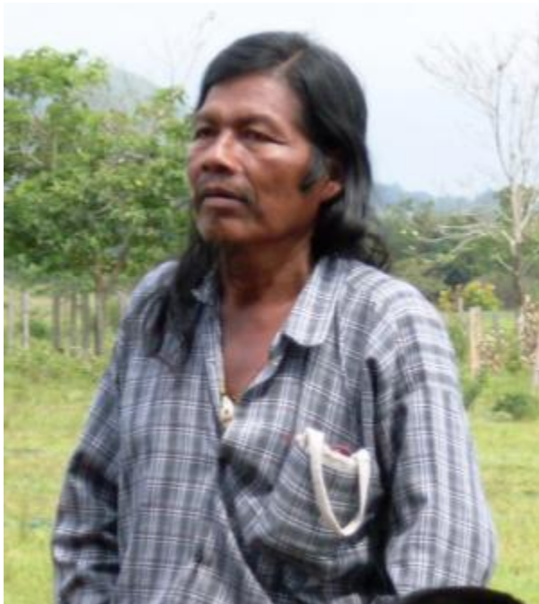
Archivo fotográfico Dirección de Poblaciones Ministerio de Cultura 2009

lo son la administración de justicia y la administración financiera en las organizaciones representativas del pueblo.