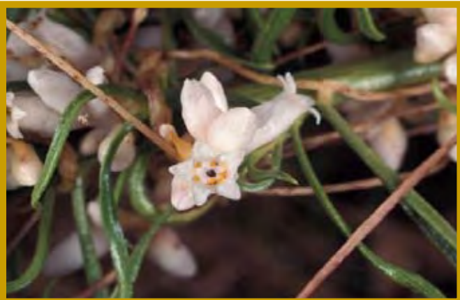
Primer plano de una flor de cabello de ángel con estambres amarillos brillantes. Precordillera del valle central, Chile (foto de Joel McNeal).

http://www.parasiticplants.siu.edu/Cuscutaceae/index.html