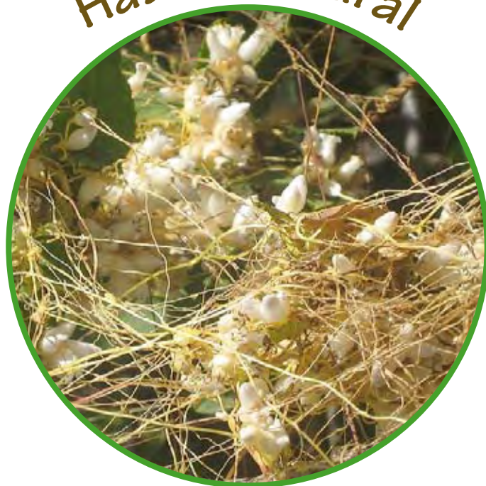
Pirque, Región Metropolitana, Chile (original de Penarc).

http://www.parasiticplants.siu.edu/Cuscutaceae/index.html