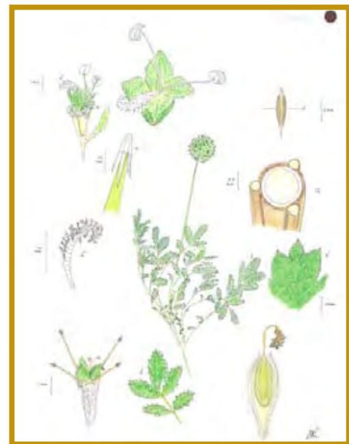
Acaena viridior (Dr. C.D. Laros) 1 .

a. Parte aérea con fruto, b. Cupela (original P.Nieto).