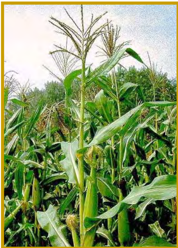
Arriba las flores masculinas y abajo las espigas o flores femeninas.

www.unincca.edu.co/tesis/FTWeb/Gramineae.html /