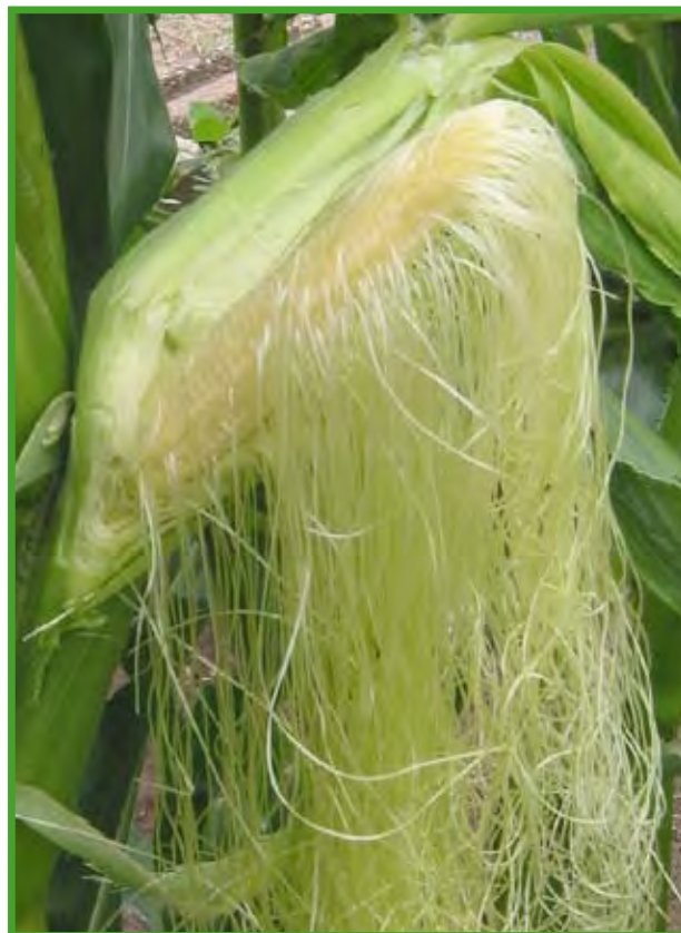
Espiga convertida en mazorca, abierta con sus estilos (pelos o barba) colgando.

www.unincca.edu.co/tesis/FTWeb/Gramineae.html /