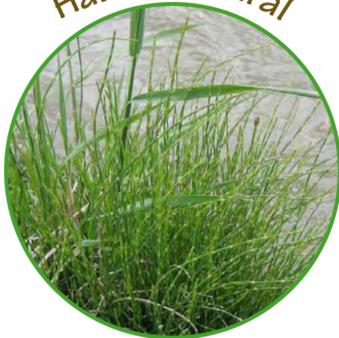
Pirque, Prov. Cordillera (original de RC Peña). http://commons.wikimedia.org/wiki/File:Equisetum_bogotense_Kunth.jpg