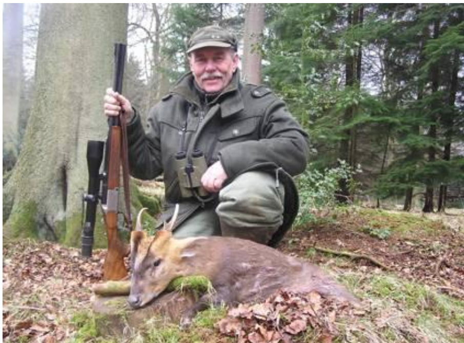
Két ezüstérmes muntjászarvas

A szállás a vadászterületen található privátpanziók egyikében van. Az ízlésesen és színvonalasan berendezett panziókban kb. 90,- Pfd a szállásdíj naponta, ami helyben fizetendő, ugyanúgy, ahogy az italok és az étkezés is.