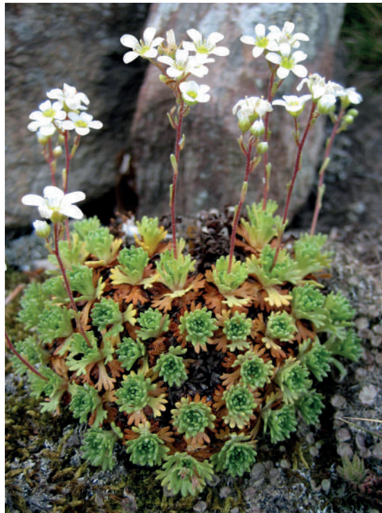
Herba de Sant Segimon

Especie rupícola o subrupícola, endémica de las montañas catalanídicas septentrionales (macizos del Montseny y Guilleries), donde se conocen numerosas poblaciones locales sin graves amenazas.