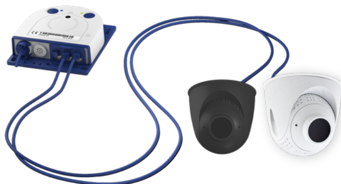
S15 mit zwei PTMount-Thermal