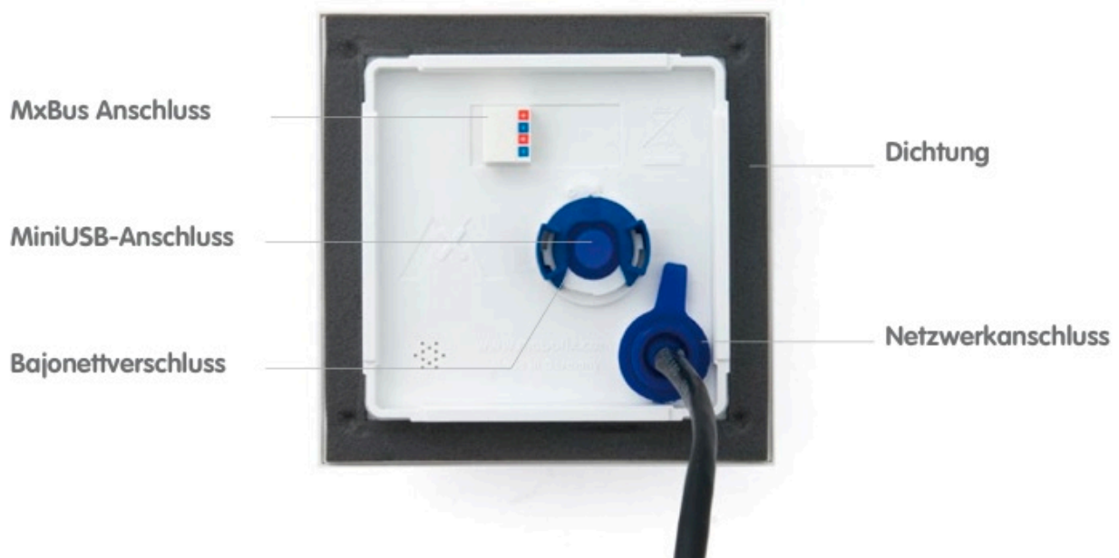
(T25 – Kameragehäuse und Anschlüsse, Auszug aus der technischen Dokumentation)