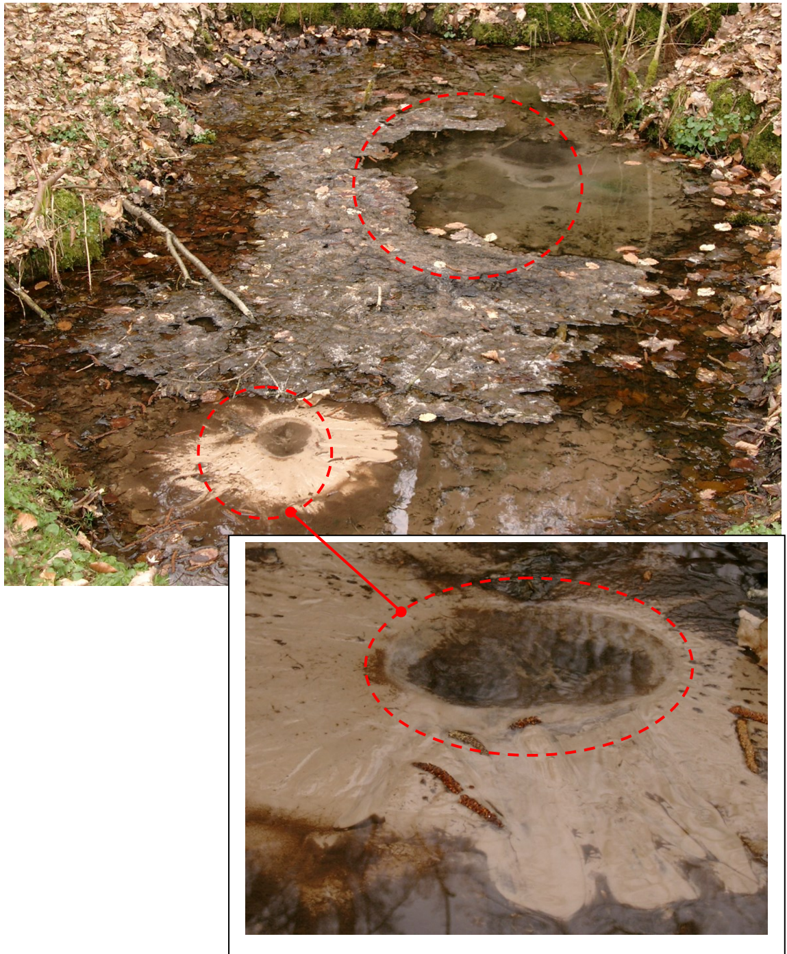
Abbildung 3-2: Markante GwAufstiegszonen an der Quelle D, mittl. Teil (03.04.2013)