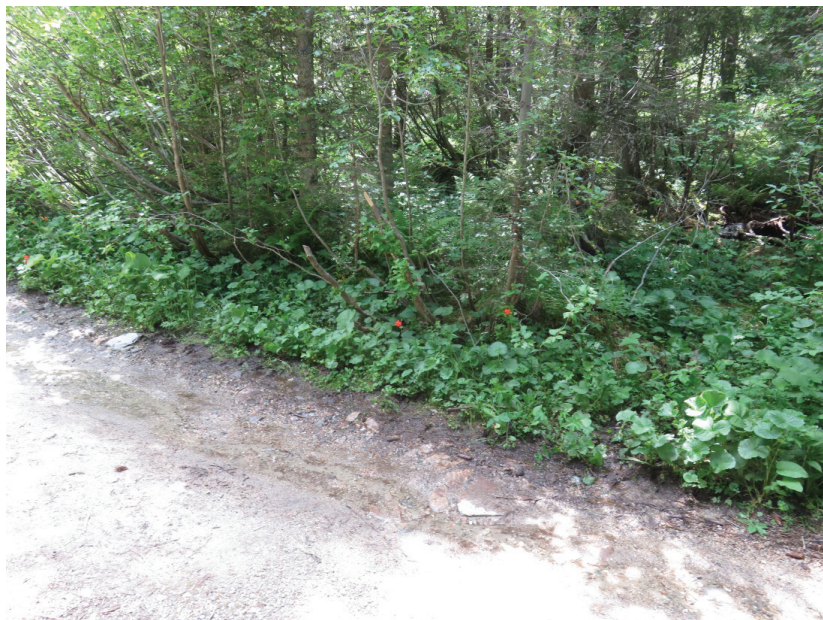
Местообитание на Tozzia alpina subsp. carpathica в долината на р. Скакавица над местн. „Зелени преслап“, Рила, юли 2021 г.