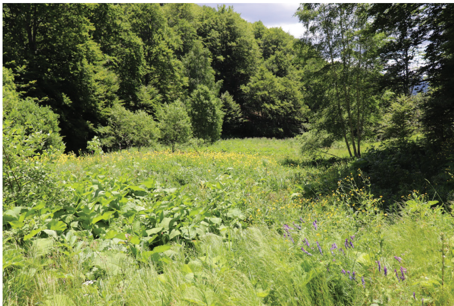
Местообитание на Tozzia alpina subsp. carpathica в находището ЮЗ от вр. Ком, Западна Стара планина, юли 2021 г.