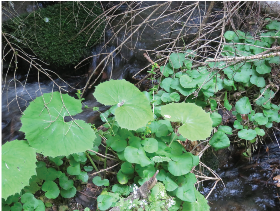
Tozzia alpina subsp. carpathica в поток над местн. Кирилова поляна над Рилския манастир, Рила, юли 2021 г.