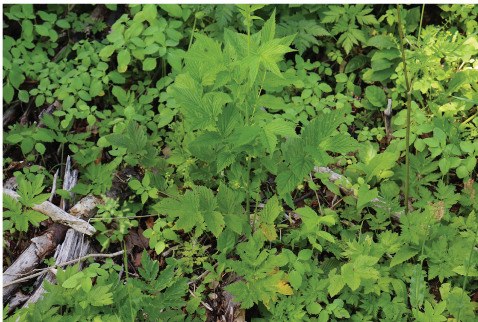
Tozzia alpina subsp. carpathica в находището ЮЗ от вр. Ком, Западна Стара планина, юли 2021 г.