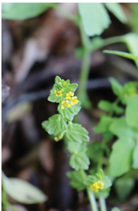
Tozzia alpina subsp. carpathica в находището ЮЗ от вр. Ком, Западна Стара планина, юли 2021 г.