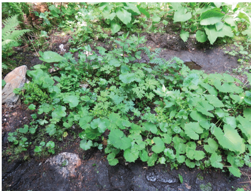
Местообитание на Tozzia alpina subsp. carpathica в долината на р. Скакавица над местн. „Зелени преслап“, Рила, юли 2021 г.