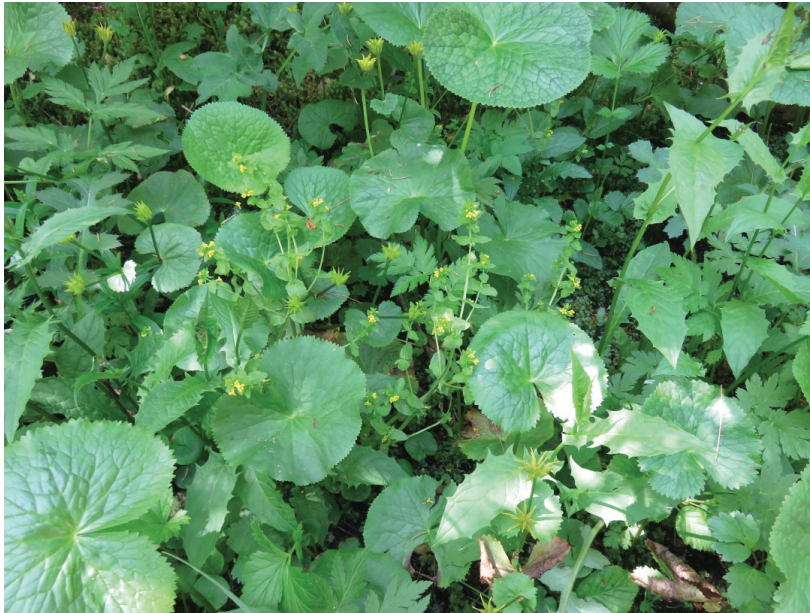
Tozzia alpina subsp. carpathica в находището в долината на р. Скакавица над местност „Зелени преслап“, Рила, юли 2021 г.