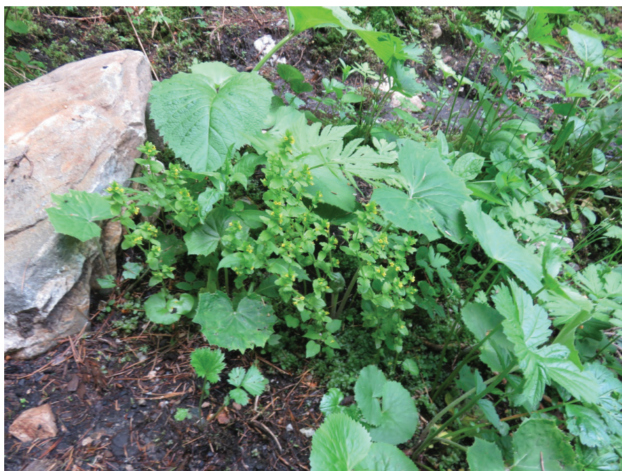
Tozzia alpina subsp. carpathica в находището в долината на р. Скакавица над местност „Зелени преслап“, Рила, юли 2021 г.