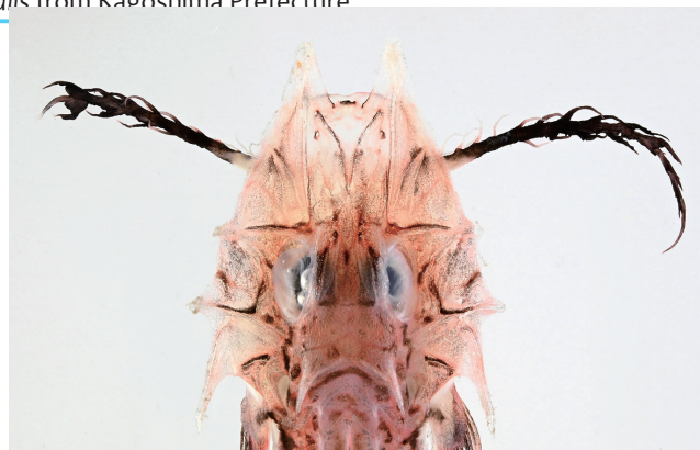
Fig. 2. Head of fresh specimens of Scalicus orientalis (KAUM-I. 161473, 77.6 mm SL; dorsal view).

色彩 生鮮時の色彩 (Fig. 1) — 頭部と体側は桃色で、背面は赤みが強く、腹面は白色がかかる。頭部には不規則な黒褐色線がはいり、体側には不定形の黒褐色斑が散在する。吻突起は白色半透明。下唇と下顎の鬚は最外の唇鬚を除き白色。最外の唇鬚は基底部周辺が白色で、大部分は赤みが