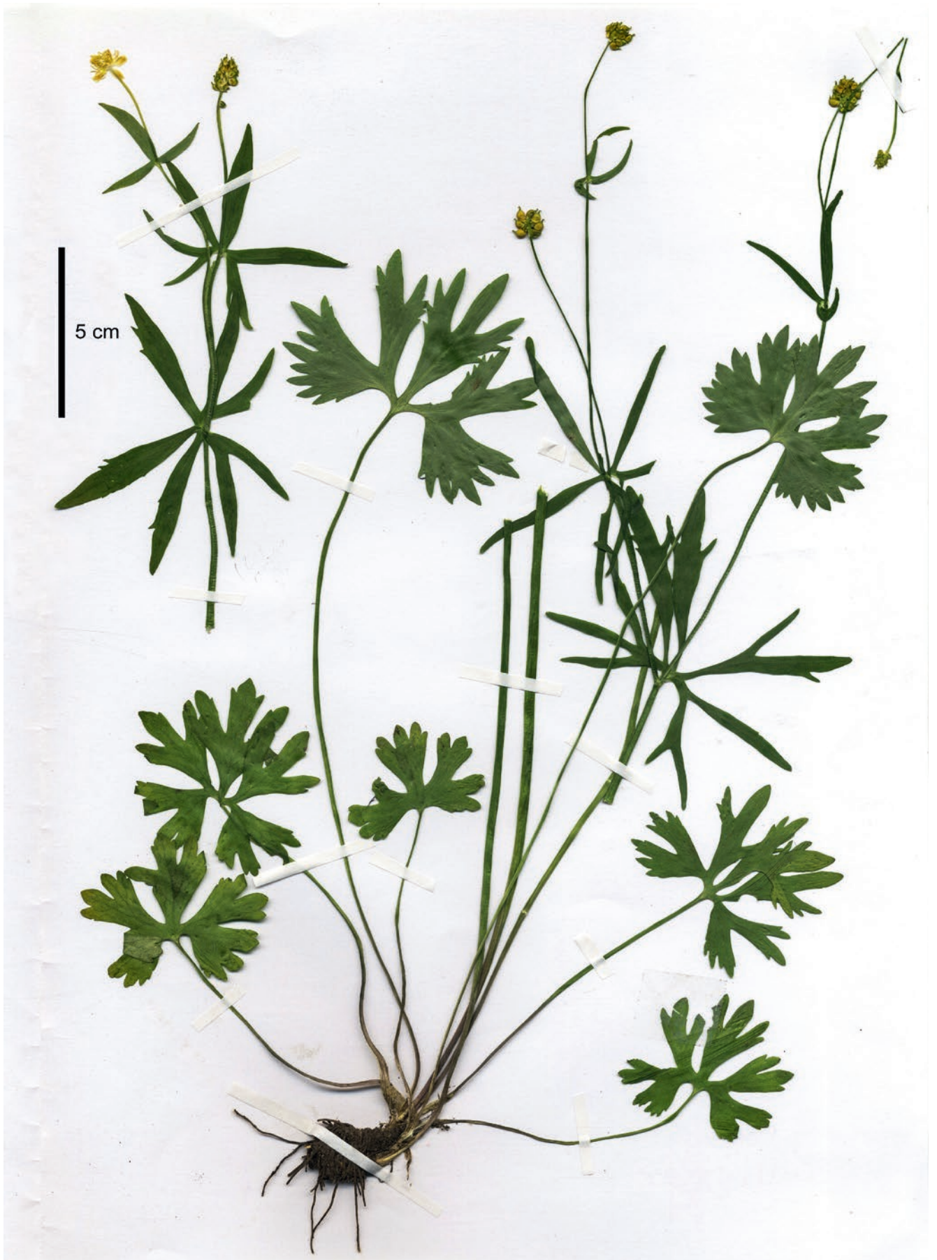
Abb. 1: Holotyp von Ranunculus dallatorrei . - Holotype of R. dallatorrei .