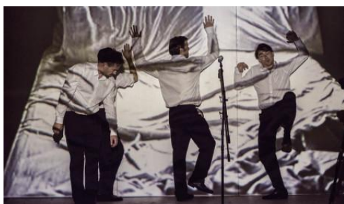
Stereotypní Mersaultův život aneb Cizinec v Divadle Na zábradlí