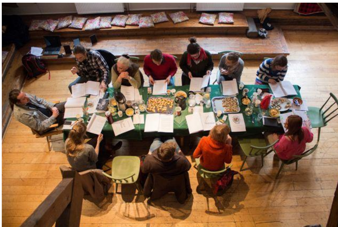
První čtená zkouška „Velvet Havel“ 24. března 2014