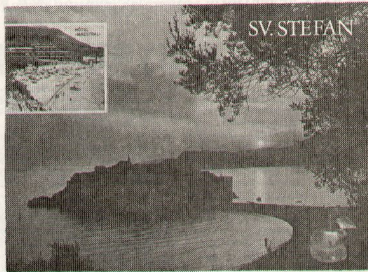
У НАШЕМ НАЈЕКСКЛУЗИВНИЈЕМ ЛЈЕТОВАЛИШТУ