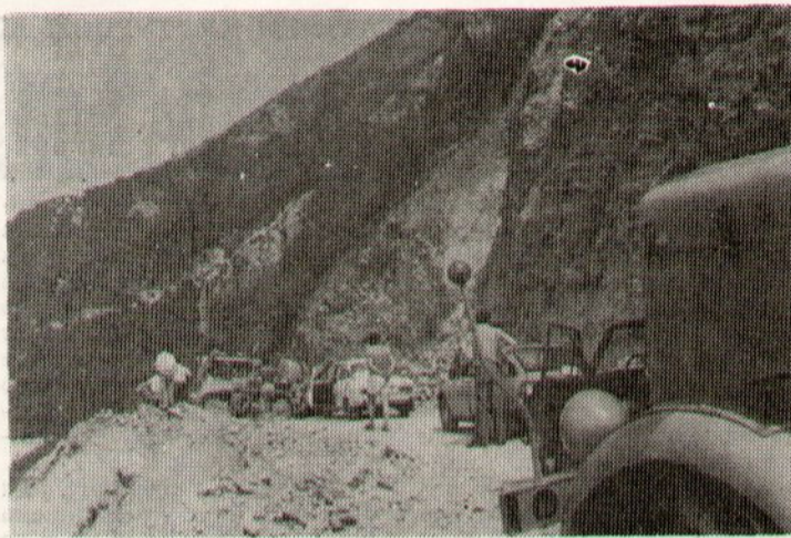
На путу Цетиње — Будва

— Нека, нека! — каже он — важно је да се гради пут, јер путеви доносе прогрес. А мој кућерак биће обезбијеђен потпорним ѕидом. То су ми обећали другови из ОГП и надам се да ће обећање испунити.