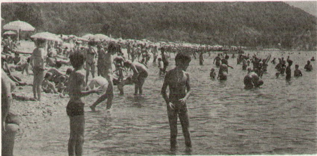
Плаже пуне „као око“