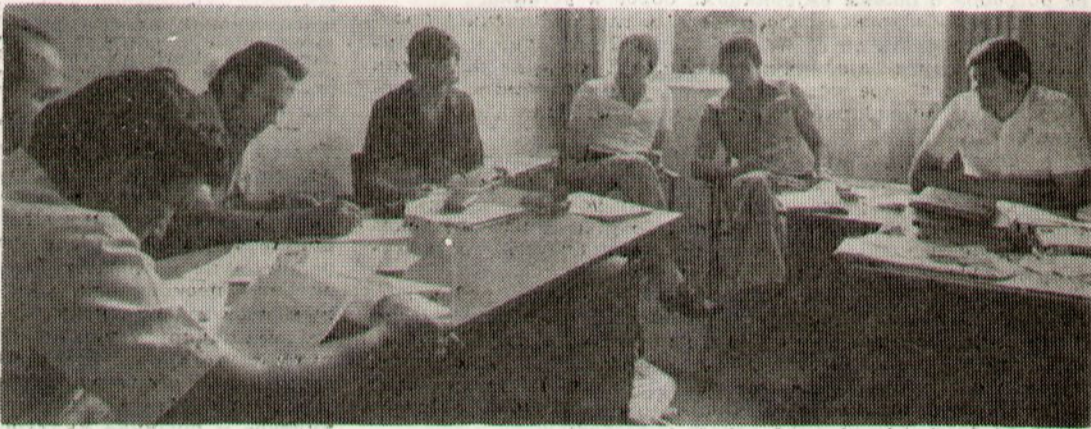
Са сједнице Издавачког савјета