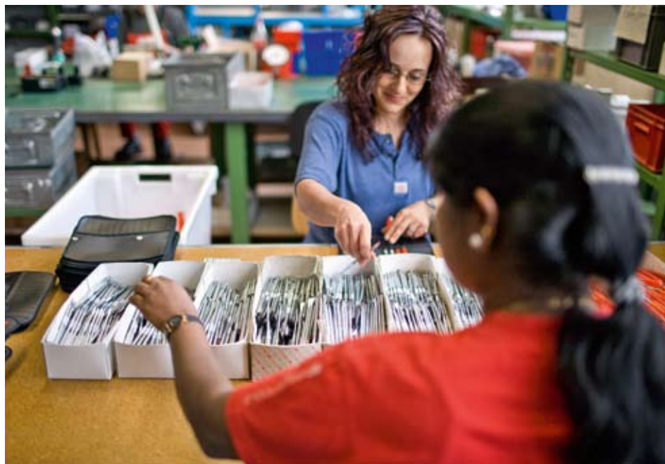
Die Untersuchung legt nahe, dass die Importkonkurrenz nicht die treibende Kraft hinter der generellen Schlechterstellung von Arbeitskräften mit ungenügender fachlicher und sprachlicher Qualifikation auf dem heutigen Schweizer Arbeitsmarkt sein dürfte.