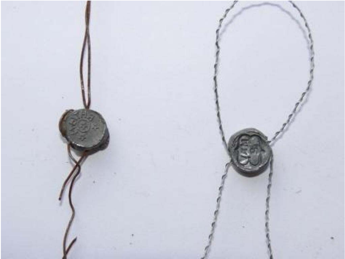
3. ábra: Ólomzárak

A MUNKAFÜZET CÍME: A FÁJL ADATLAPJA ALAPJÁN AUTOMATIKUSAN KITÖLTŐDIK. A MEGFELELŐ MŰKÖDÉS ÉRDEKÉBEN KÉRJÜK FELTÉTLENÜL TÖLTSE KI AZ ADATLAPOT!