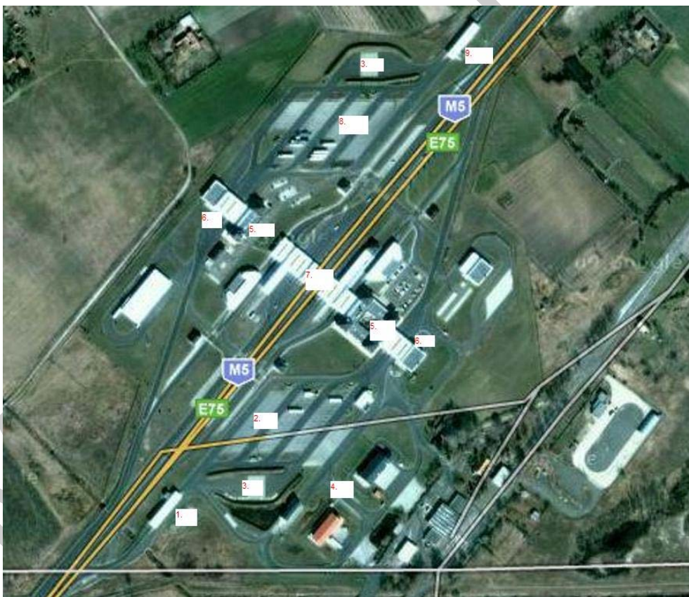
1. ábra: A röszei határátkelőhely műholdképe 1

A következő kép a röszei határátkelőhely műholdképét mutatja. Figyelje meg a kép számmal jelzett részeit! Milyen tevékenységek kerülnek lefolytatásra az egyes helyeken?