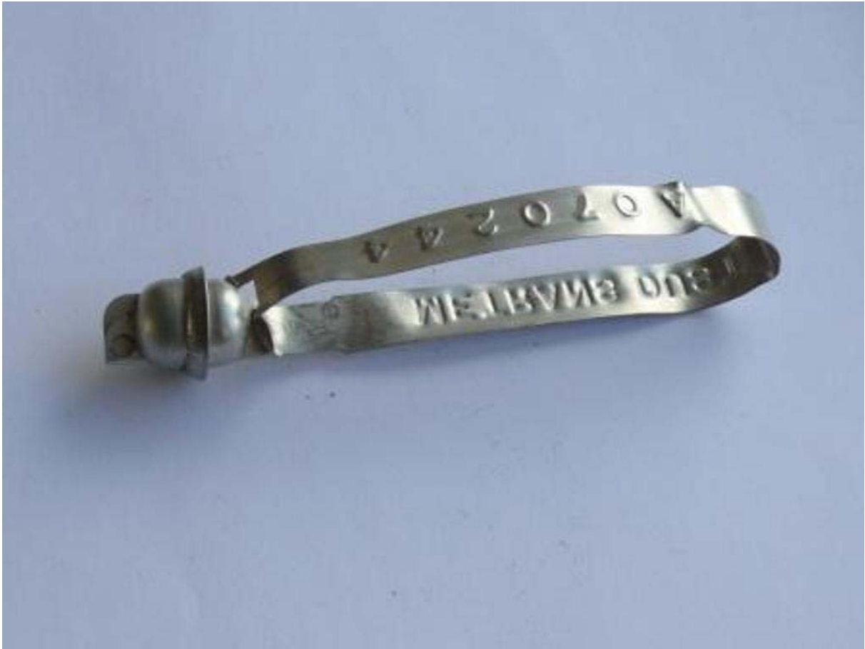
2. ábra: Szalagzár

A MUNKAFÜZET CÍME: A FÁJL ADATLAPJA ALAPJÁN AUTOMATIKUSAN KITÖLTŐDIK. A MEGFELELŐ MŰKÖDÉS ÉRDEKÉBEN KÉRJÜK FELTÉTLENÜL TÖLTSE KI AZ ADATLAPOT!