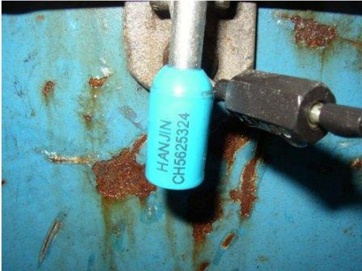
4. ábra: Konténerzár

A MUNKAFÜZET CÍME: A FÁJL ADATLAPJA ALAPJÁN AUTOMATIKUSAN KITÖLTŐDIK. A MEGFELELŐ MŰKÖDÉS ÉRDEKÉBEN KÉRJÜK FELTÉTLENÜL TÖLTSE KI AZ ADATLAPOT!