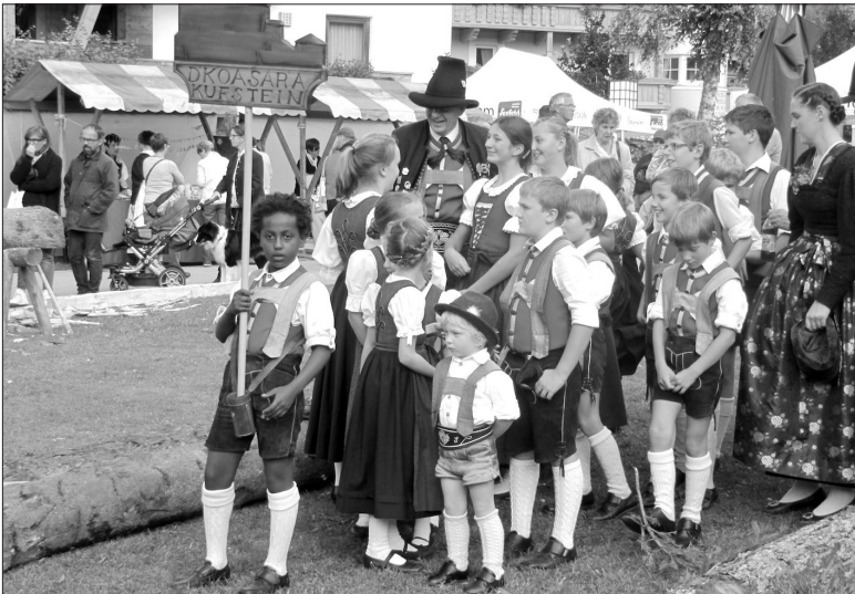
Abb. 3: Handwerksfest Seefeld, 14. September 2014

Noch deutlicher, weil zugleich performativ eingebettet und situativ erlebbar, erscheint dieser Effekt im Kontext einer Aufnahme, die in einer feldforschenden Beobachtungssituation bei einem Umzug auf einem Handwerksfest in Seefeld, einer Tiroler Gemeinde in der Nähe von Innsbruck entstand. Auf dieser dokumentarischen Fotografie ist zu sehen, wie die Trachtengruppe »D’Koasara Kufstein« von einem dunkelhäutigen Buben als Schildträger angeführt wird: