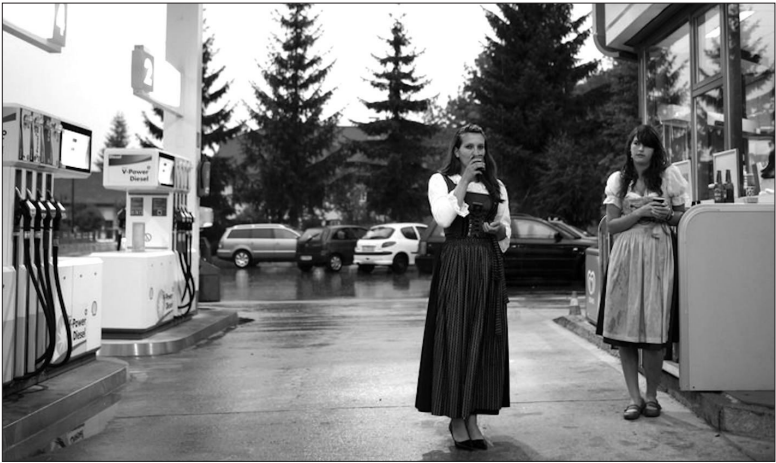
Abb. 1: »[Tiroler] Rennen nur in Trachten rum Das stimmt nicht, obwohl es manchmal praktisch wäre. So ein Dirndl ist auch im Sommer luftig leicht (außer die traditionellen Trachten, welche meist aus schweren Stoffen genäht sind) und steht jeder Frau, ob rund, dünn, alt oder jung. Und die waschresistenten Lederhosen sind sowieso der Hit. Auf Zeltfesten und Prozessionen aber ist das Tiroler Gewand für jeden traditionsbewussten Einheimischen ein Muss. Vielerorts im Gastgewerbe unter den Kellnerinnen und Kellnern auch. Hier nicht immer ganz freiwillig.«

Bemerkenswert ambivalent sind die aktuellen Botschaften der Tiroler Tourismuswerbung in ihrem Blog. Während teilweise unverhohlen »Noch heute ist Tracht und Tirol untrennbar verbunden« 13 proklamiert wird, wird an anderer Stelle die Vorstellung, alle Tiroler »rennen nur in Trachten rum« als zwar populäres aber unzutreffendes Vorurteil zurückgewiesen, allerdings auf der Bildebene in Form einer pseudodokumentarischen Werbefotografie zugleich wieder aufgerufen: 14