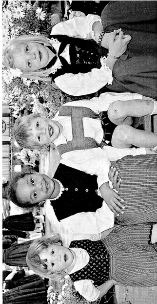
Gelebte Integration: Der Tiroler Trachtenverband will Kinder und Jugendliche in das soziale Leben der jeweiligen Gemeinden eingliedern und Kontakte über regionale Grenzen hinaus knüpfen.

„Wir distanzieren uns ganz klar von nationalsozialistischem Gedankengut“, stellt Gredler im Gespräch mit der Tiroler Tageszeitung unmissverständlich fest. „unsere Aufgaben sind die Pflege, Erhaltung und Weitergabe von Volkskultur und Brauchtum. Wir sind nicht die Träger eines nationalistisch geprägten Wertesystems. Gegen diese durch nichts zu rechtfertigende Verdächtigung verwehren wir uns mit aller Deutlichkeit.“