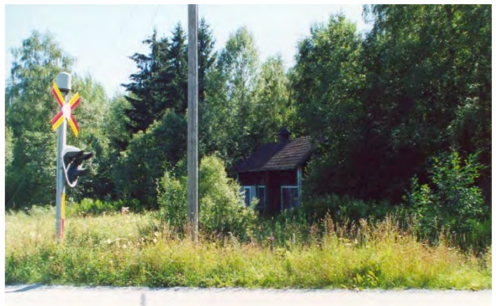
Källarhalsens ladugård som idag ägs av NJOV.