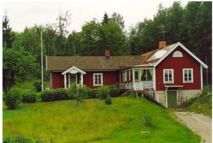
Källarhalsens banvaktstuga, där den ursprungliga banvaktstugan var centrerad kring den vänstra skorstenen.

Den äldre träplattformen i trä byttes ut mot en i sten 1960. 1966 slutade hållplatsen att fungera och 1969 försågs vägkorsningen med ljud- och ljussignaler.