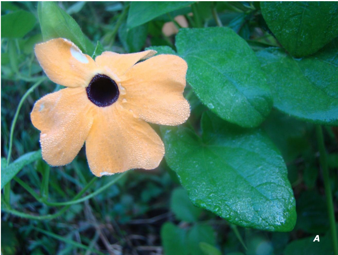
Thunbergia alata Bojer ex Sims A hojas y flor/ leaves and flower .