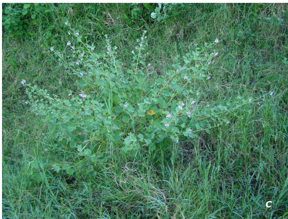
Urena lobata L.

A flor/flower; B hojas/leaves; C planta/plant.