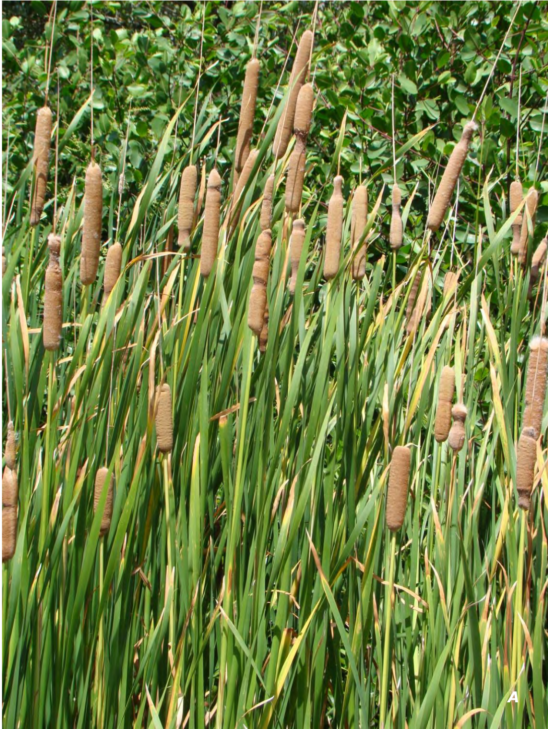
Typha domingensis Pers.