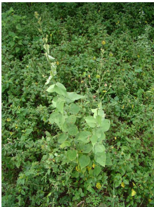
Wissadula hernandioides (L' Hér.) Garcke A flor/flower; B fruto/fruit; C planta/plant.