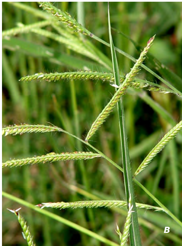
Urochloa mosambicensis (Hack.) Dandy A hojas/ leaves ; B inflorescencias/ inflorescences .