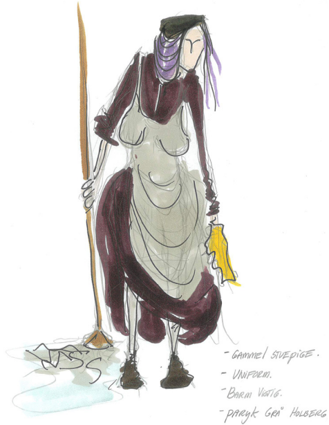
MAGDALONE - DAGTØJ/UNIFORM - MELJENE NELSEN I