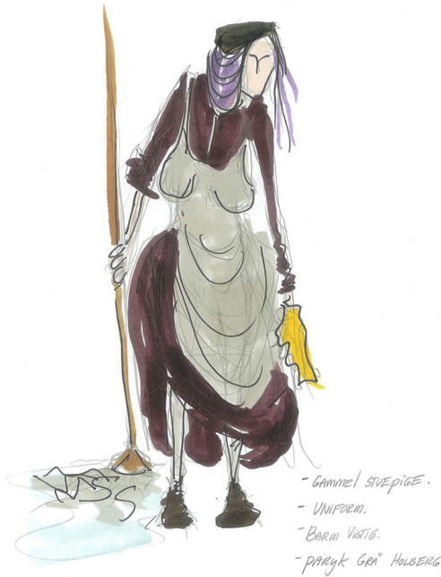
MAGDALONE - DAGTØJ/UNIFORM - MELENE MELSEN I