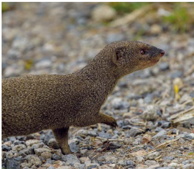
Petite mangouste indienne

Pour accompagner ce réseau d'acteurs, un centre de ressources spécifique a été mis en place par l'OFB et l'Union internationale pour la conservation de la nature (UICN): http://especes-exotiques-envahissantes.fr