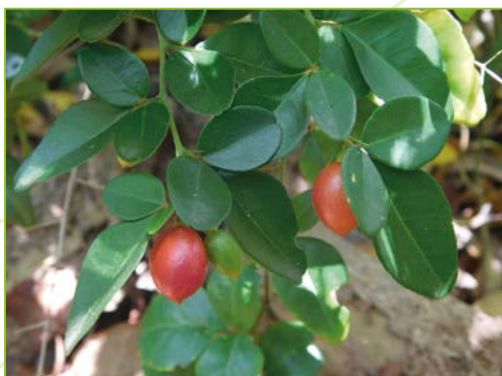
Spathodea campanulata – Tulipier du Gabon