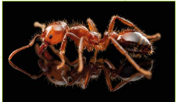
Solenopsis invicta – Fourmi de feu