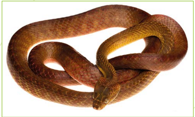
Pythonidae; Boiga irregularis