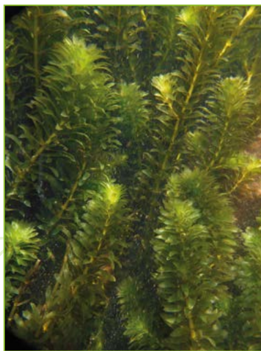
Hydrocharitaceae ; Hydrilla verticillata – Hydrille verticillée