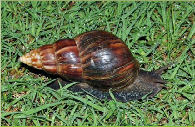
Lissachatina fulica – Achatine