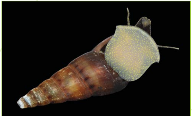
Melanoidea tuberculata – Mélanie tropicale