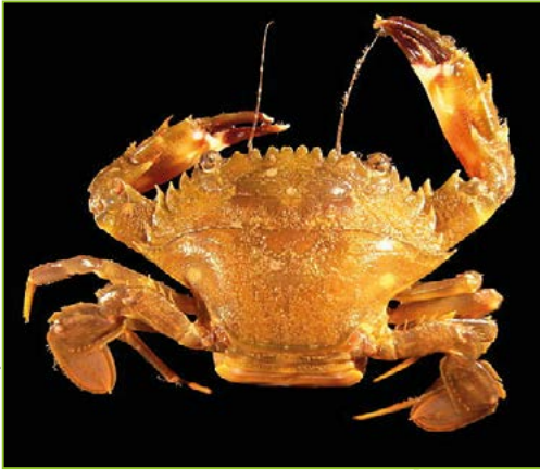
Charybdis hellerii – Crabe nageur à pinces épineuses