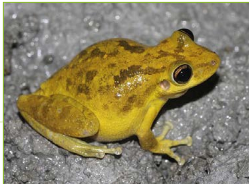
Hylidae ; Scinax ruber – Rainette des maisons (mâle et femelle)