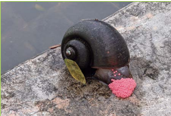
Pomacea canaliculata – Escargot pomme