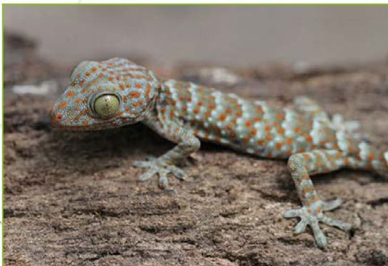
Gekkonidae; Gekko gecko – Gekko tokay