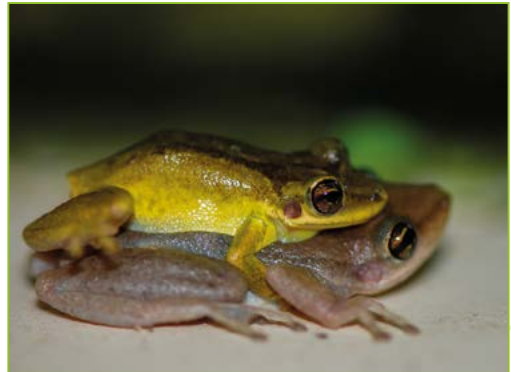
Eleutherodactylus johnstonei – Hylode de Johnstone