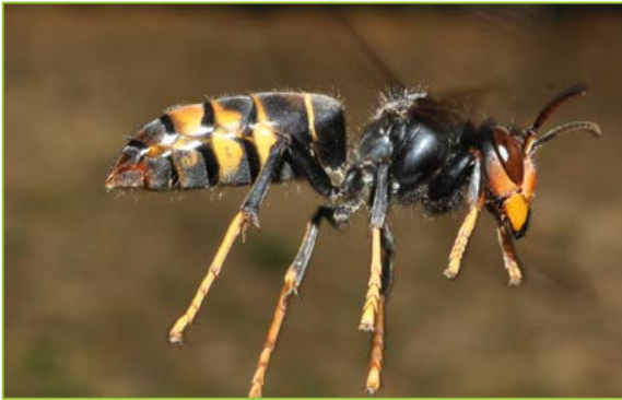
Vespa velutina nigrithorax – Frelon asiatique