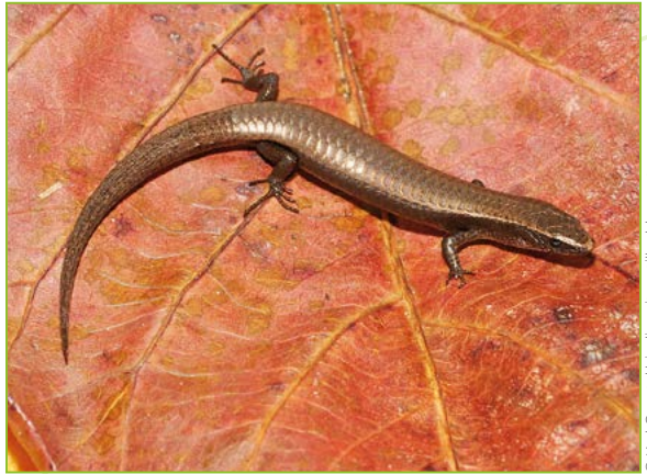
Gymnophthalmus underwoodi – Gymnophthalme d'Underwood