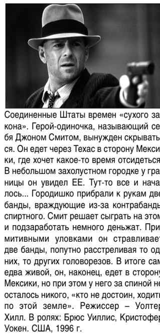
НТВ 01.15 «ГЕРОЙ-ОДИНОЧКА» Соединенные Штаты времен «сухого закона». Герой-одиночка, знающий секрет, но при этом у него за спиной не осталось никого, кто не достоин ходить по этой земле... Режиссер - Уолтер Хилл. В ролях: Брюс Уиллис, Кристофер Уокен. США, 1996 г.