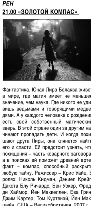
Фантастика. Юная Лира Белаква живет в мире, где магия имеет не меньшее значение, чем наука. Где никого не удивишь ведьмами и говорящими медведями. А у каждого человека с рождения есть свой собственный магический зверь. В этой стране один за другим начинают пропадать дети. И когда находят друга Лира, она пытается найти его и спасти. Ей предстоит узнать, что похищения - часть коварного заговора, а в поисках ей поможет древний артефакт - компас, способный раскрыть любую тайну. Режиссер - Крис Уайц. В ролях: Николь Кидман, Даниел Крейг, Дакота Блу Ричардс, Бен Уокер, Фредди Хаймор, Иэн Маккеллен, Эва Грин, Джим Картер, Том Куртнев, Иэн Макшвейн. США - Великобритания, 2007 г.