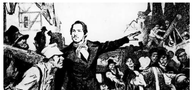
Ο Φ. Ένγκελς υποδεικνύει την κατασκευή οδοφράγματος στην εξέγερση του Μάη το 1849 στην Πρωσία

7. Στο Μανιφέστο αποτυπώνεται, με τη μορφή δέκα συγκεκριμένων αιτημάτων, το πρώτο μεταβατικό πρόγραμμα , υπηρετώντας την ανάγκη να γεφυρωθεί η διαφορά ανάμεσα στην ωρίμανση των αντικειμενικών παραγόντων για τη νίκη της σοσιαλιστικής επανάστασης και της ανωριμότητας της συνείδησης της εργατικής τάξης και της ηγεσίας της. Παρότι στην εισαγωγή της έκδοσης του 1872, οι Μαρξ και Ένγκελς γράφουν πως τα αιτήματα είναι απαρχαιωμένα, καθώς αναφέρονταν σε επαναστατική εποχή, ήταν μια ισχυρή γροθιά στη λογική της σοσιαλδημοκρατίας περί «μίνιμουμ» προγραμμάτων, που ποτέ δεν ξεπερνούσαν τα