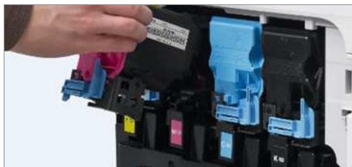
Einfacher Austausch der Verbrauchsmaterialien