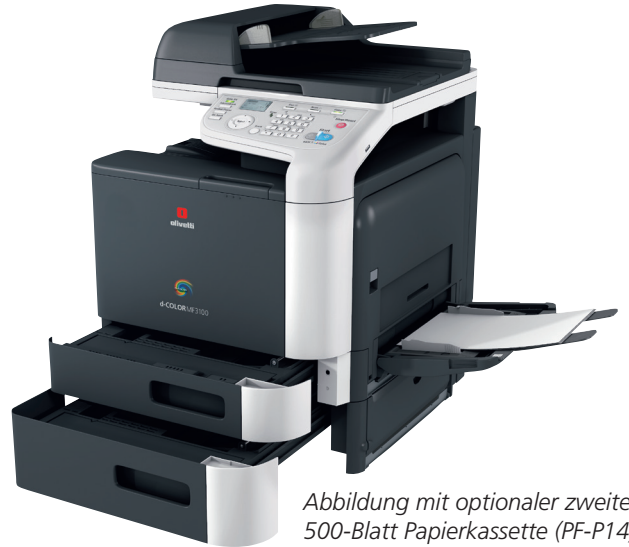
Abbildung mit optionaler zweiter 500-Blatt Papierkassette (PF-P14)

Die Standard Papierkapazität von 350 Blatt (250 Blatt Kassette und 100 Blatt Universalzufuhr) kann durch eine zusätzliche Kassette auf 850 Blatt erhöht werden.