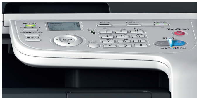
Bedienerpanel mit 4-zeiligem LCD-Display