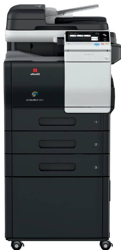
Konfiguration mit 2 optionalen Papierkassetten und Unterschrank