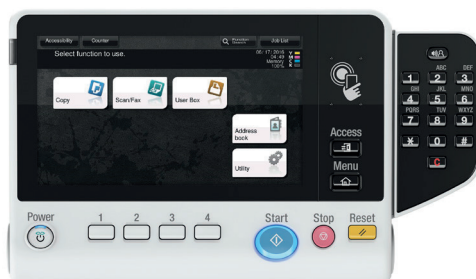
Innovatives 7" Multi-Touch Bedienfeld mit NFC-Area und optionaler Zehnertastatur (KP-101)