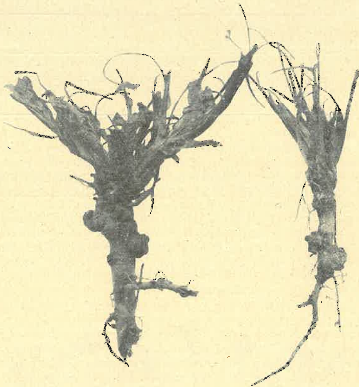
Abb. 1. Sclerotien an den Wurzeln abgestorbener Kleepflanzen.

Die ersten Anzeichen der als Klee Krebs bezeichneten Krankheit treten oft schon in den Herbstmonaten des Aussaatjahres hervor. Auf den Blättern einzelner Kleepflanzen zeigen sich missfarbige, bräunliche Flecken, die an Umfang zunehmen und allmählich