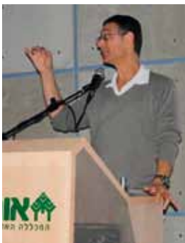
פרופ' עדו יצחקי

בחלק הראשון של הכנס הכרנו את המערכת המשרתת את האדם, את מה צריך לשמור בחורש ואת מורכבות המערכת כמקום חיות למגוון רחב של מינים. בחלק השני נכיר חלק מהאיומים הרובצים לפתחה של מערכת זו. האתגר הגדול של הכנס היה בחלק השלישי שבו בחנו מה עושים הגופים השונים