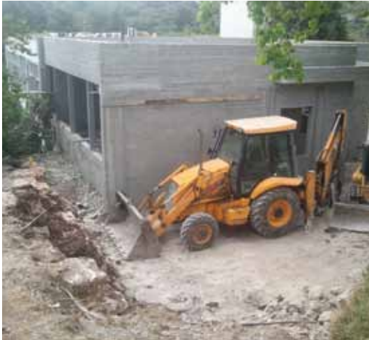
הרחבת בניין המנהלה - לאחר סיום הבניה יתווספו לבניין המנהלה עוד כ- 170 מ"ר בשתי קומות ופיתוח שטח גדול מסביב וכן קומת החינוך והמח"ר תהינה נגישות לנכים

לקראת הגיליון האחרון של תשע"ב נקראתם להיענות לאתגר מיוחד, הפרויקט - "אורנים בעוד 10 שנים". אם בשנה שעברה הוקדש גיליון סיום השנה לשנת השישים לאורנים והיה נוסטלגי משהו במלל ובתמונה, הרי שבזכות תרומתכם גיליון זה הוא עתידי בעליל.