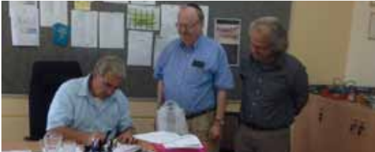
מעמד חתימת הסכם שיתוף הפעולה עם מכללת רוד איילנד בארה"ב