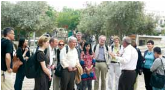
משתתפי סמינר השפות בביקור בכפר הירוק

הכנס התקיים בארגון משותף של מכללת לוינסקי ושל אורנים לארח 'קבוצת-עניין' בינלאומית העוסקת בחקר הוראת הספרות. קבוצה זו היא חלק מארגון בינלאומי שמטרתו קידום ומחקר של הוראת שפת אם (International Association for the Improvement of Mother Tongue Education = IAIMTE).