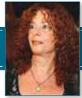
פרופ' רינה בן-שחר