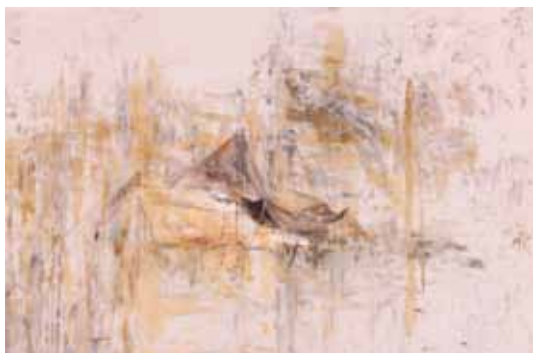
יצחקי חופית, ללא כותרת, 2012, טכניקה מעורבת על בד 80/1.10 ס"מ בקירוב

בשנה זו התחלנו ביישומה של תכנית לימודים מחודשת בלימודי היצירה, תכנית השמה דגש על התמקצעות בתחומי בחירה, תוך התמקדות, בשנים המתקדמות, בתחום יצירה מרכזי. לימודי המדיניות התרחבו לשיעורים הפורשים מבט ביקורתי ועדכני על התחום, מה שמחזק מהלך של יצירה השזור עיון וביקורת. הדבר ניכר בתערוכה, המציעה עבודות בעלות עומק, עניין, תעוזה, רעננות, מסתורין וכוח."