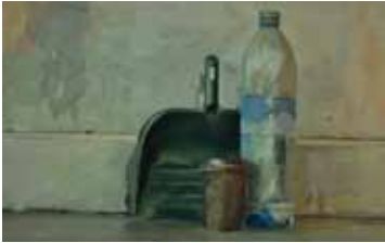
מגדה חלבי מתוך מרתון יצירה

מאת: שני בנגד