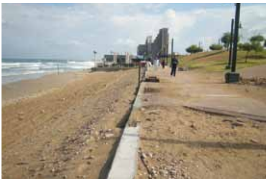
חוף הכרמל טיילת אחרי סערה 2012

המתחדשים והייחודיים, בחופי הכרמל ביניהם חופי דור הקדומים וחופי חיפה המודרניים. הסטודנטים שלנו מכינים מחקרי זוטא הנוגעים למצב החופים המהווים מערכת ערכית ודו כיוונית: אדם וחוף או חוף ואדם. כרגע הם טרודים בהכנת רפרטים בנושאים כמו מצב החולות, עליית מפלס ים עתידית וסכנותיה, שימושי קרקע של החופים, מצב ההטלות של הצבות, טיילות בחופי חיפה (טיילת דדו, טיילת בת גלים, טיילת הכט החדשה) ועוד. הסטודנטים מבצעים עבודות סקר וחקר במסגרת מחויבותם לעבודות סמינריוניות, הכוללים מחקרים איכותניים ו/או כמותיים בקנה-מידה זעיר ומסתייעים באיסוף נתונים וביצוע ראיונות עם המבלים, הספורטאים, הגולשים, המתכננים המדענים והאחרים בחוף.