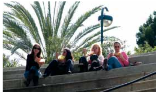
הפסקת צהריים של בנות המסדרון באמפי

כתבות: כנס חורש 7 מועדונים מדעיים 8 כנס החוג ללשון 10 אוטובוס המצטיינים 13 שיח עמיתים 14 כנס החוג לתקשורת 16 סמינר שפות 19 הצגה 'פרעוש הלמה' 20 המדיה והסכסוך הישראלי פלסטיני 21 כנס חינוך מיוחד 22 הוראה מעמיתים 23 מפגש עם המשורר חיים גורי 24 ברכה לבוגרי המח"ר 25 חינוך עם דגש על הגיל הרך 26 פורום אורנים למאבק בגזענות: אירוע חשיפה 27 כנס מרכז שי 28 יש לי חלום 29 נעים להכיר... 30 כנס החוג לחינוך מתמטי טבע וסביבה 35 מרתון יצירה ספרות ואמנות 37 תערוכת בוגרים 43