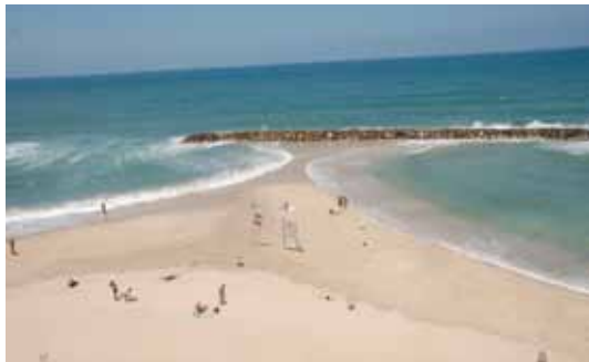
שובר גלים מנותק ויצירת טומבולו

בחופים אלו מתקיים גם תהליך של גירעון חולי מתמשך בגלל מחסומים יצירי כפיו של האדם, הלוא הם נמלים, מזחים, שוברי גלים, תחנות כוח, מרינות, תחבורה, טיילות, מלונות.