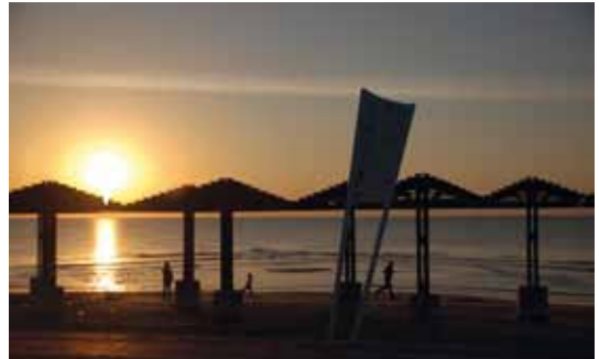
יופי בחופי חיפה

עם כניסתם של הקיץ והפגרה סביר להניח כי נבלה בחופים בשמש של הבוקר, ניהנה מן הבריזה הימית מאוחר יותר ונרחץ ונשחה בים. בנוסף, קיימת אופציה של בילוי לעת ערבית בטיילת או בבתי הקפה והמסעדות שלרשותנו. בינינו לבין עצמנו, יש בחופים יופי מרנין ורומנטי.