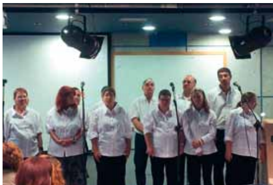
מקהלת פינה בכפר מכפר תקווה

בסיום דבריו הדגיש ד"ר גרנות שהחוג לחינוך מיוחד במכללת אורנים עושה מאמץ לתרום לנושא הטיפול בילדים בעלי ASD באמצעות פיתוח תכנית חדשה להכשרת אנשי חינוך מיוחד ואחרים על פי הגישות העדכניות להתערבות פסיכו-חינוכית.