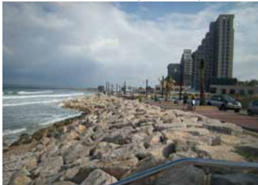
חוף הכרמל מלון מגננה וטיילת | צילום: סנה 2012

לכל אלה נוספה סופה חופית עזה וחריגה לפני שנה וחצי (דצמבר 2010) וכן, סערות נוספות (חורף ואביב 2011, 2012), שהוסיפו שמן למדורה. הסופה החריגה בעוצמתה ובהיקפה נחשבת לסופה הקשה ביותר שפקדה את האזור מזה 40 שנה. רוחות