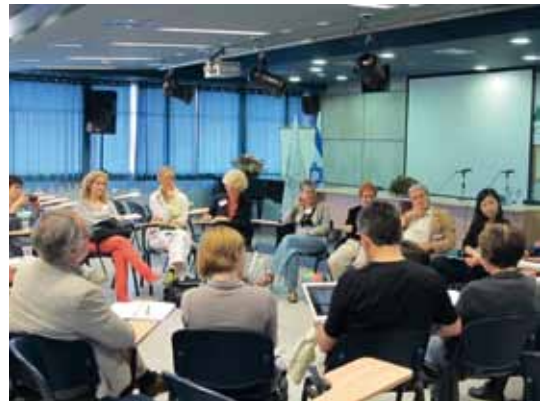
סמינר שפות פנל סיום

הפעם הגיעו לסמינר (קראנו לכך סמינר משום שזו הייתה קבוצה קטנה שחתרה לשיחה וליבון של מחקרים שונים ובעיות בהוראת ספרות) חוקרים מנורווגיה, רומניה, הונג-קונג, אנגליה, יוון, בולגריה, צרפת, גרמניה והולנד. בין המשתתפים היו גם שני דוקטורנטים עם המנחים שלהם. כל השאר היו חברי סגל של מוסדות אקדמיים שונים.