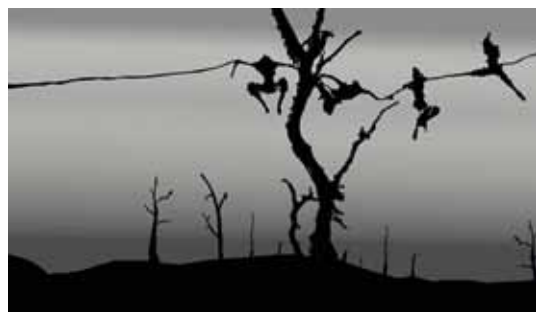
רחב עדי, ללא כותרת, 2012, פריים מתוך אנימציה, תוכנת פלאש

זהו רגע חשוב, שברירי ואפילו פגיע, אך גם חגיגי. יחד עם כל המכון לאמנות וקהילת אורנים אנחנו חוגגים עם הבוגרות והבוגרים של המכון לאמנות בתשע"ב, שולחים להם ולהן את ברכתנו ומקווים שנמשיך גם בעתיד בשותפות שנרקמה כאן בינינו לקראת האתגרים שמציבות לפנינו החברה והתרבות בישראל."