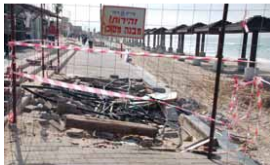
הרס חופי חיפה צילום: סנה 2011

לכל אלה נוספה סופה חופית עזה וחריגה לפני שנה וחצי (דצמבר 2010) וכן, סערות נוספות (חורף ואביב 2011, 2012), שהוסיפו שמן למדורה. הסופה החריגה בעוצמתה ובהיקפה נחשבת לסופה הקשה ביותר שפקדה את האזור מזה 40 שנה. רוחות