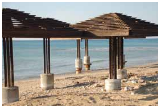
מצב החול אחרי הסערה

נשבו במהירות של 100 קשר וגלים התרוממו לגובה של כ-10 מטרים והתנפצו אל החוף. ואכן, חופי הרחצה והטיילות של חיפה "חוו" חורבן נזקים נוראים לתשתיות, ביניהם: שטחים נרחבים של אבנים משתלבות שהתפרקו כמו לגו, חלק מטיילת דדו שקרסה, אדניות לפרחים העשויות מאדני רכבת נעקרו ממקומם ונסחפו למרחק רב. הגינון, הדשאים ומערכות ההשקיה לאורך כל