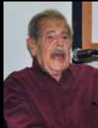
מפגש עם המשורר חיים גורי באורנים עמ' 24