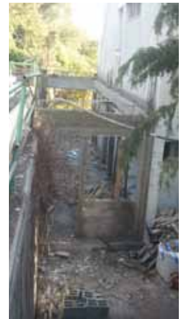
הרחבת בניין המנהלה בעיצומן של העבודות

נסיים בדבר משמח ברמה האישית: בראשית יולי אמורה ועדת האיתור לבחירת מחליפי/מחליפתי לסיים את עבודתה ולהודיע מי נבחר/ה לתפקיד. אם להיות אופטימי, ב-1/1/2013 אשב על המזח בוולטה, בירת מלטה, רגליי ישכשכו במי הים התיכון ועל קרס החכה יתנווד סרדיני-ים-תיכוני או בקבוק עם מכתב עידוד אליכם. ועד אז... עוד רבה העבודה.