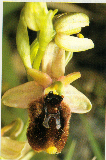
FIG. 4. — Ophrys × toussaintiana . I. Siracusa. 7.4.87.