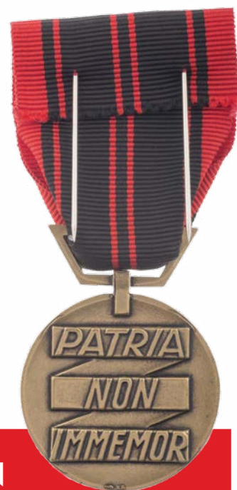
> Revers de la médaille.

Plus d'informations sur www.ordredelaliberation.fr