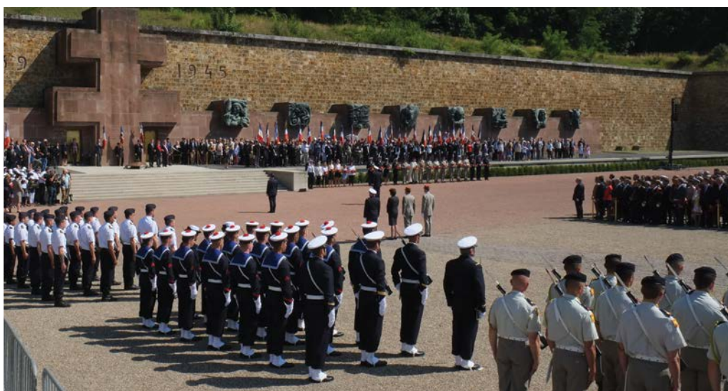
> Dispositif interarmées lors de la cérémonie commémorative de l'Appel du 18 juin 1940 du Mont-Valérien.