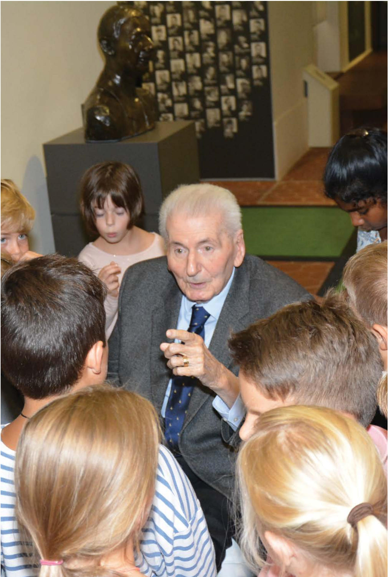
> Hubert Germain, Compagnon de la Libération, 2017.