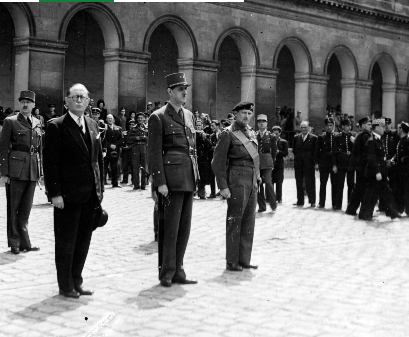
> Cour d'honneur des Invalides. De gauche à droite, le général Koenig, André Diethelm, le général de Gaulle et le maréchal Montgomery.