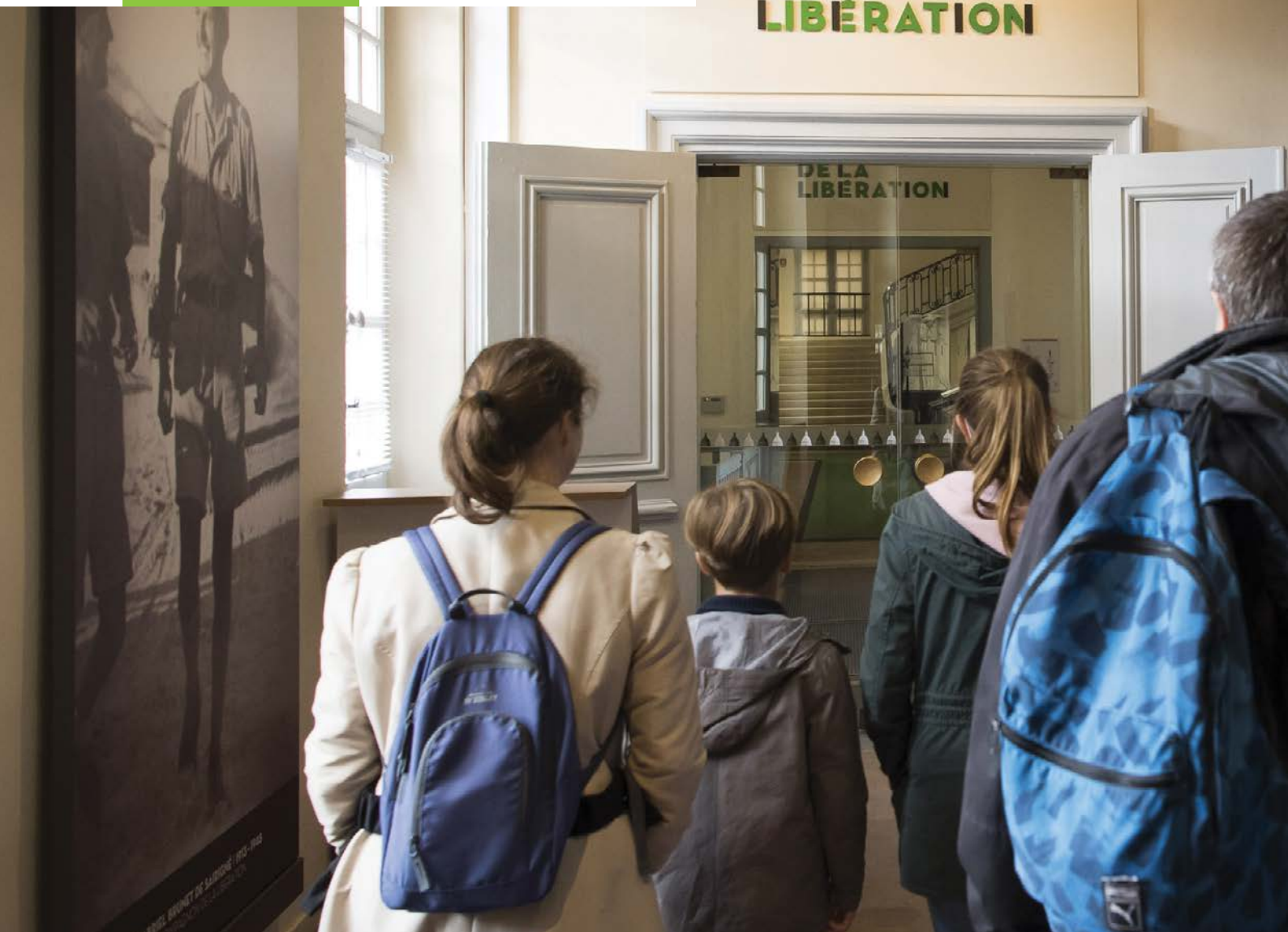
> Famille en visite au musée.

Le musée de l'Ordre de la Libération, récemment rénové, met en œuvre une politique culturelle dynamique (expositions temporaires, conférences, projections, etc.) avec l'appui d'un conseil scientifique international.