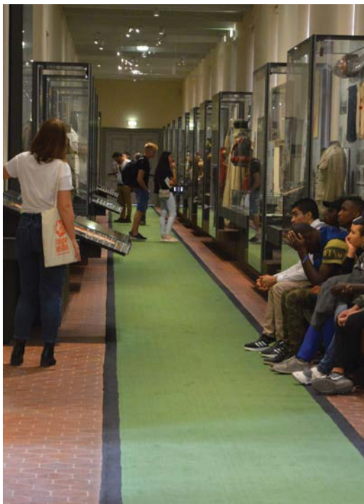
▲ LA FRANCE LIBRE

L'exposition permanente présente 2000 objets et documents sur 1200 m 2 qui illustrent le parcours des Compagnons à travers 3 espaces principaux.