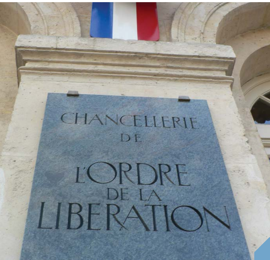
> Hôtel national des Invalides, Chancellerie de l'Ordre de la Libération.

Souhait des Compagnons, l'Ordre de la Libération doit perdurer en devenant une boussole de citoyenneté, notamment auprès des plus jeunes. L'exemplarité des parcours individuels de cette «chevalerie exceptionnelle» survivra à la disparition du dernier Compagnon par les différentes missions confiées à l'Ordre, en développant chez nos concitoyens le nécessaire esprit de Défense.