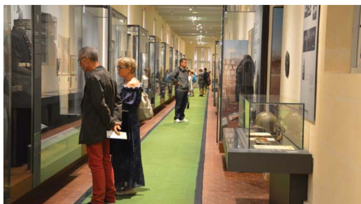
▲ LA RÉSISTANCE INTÉRIEURE