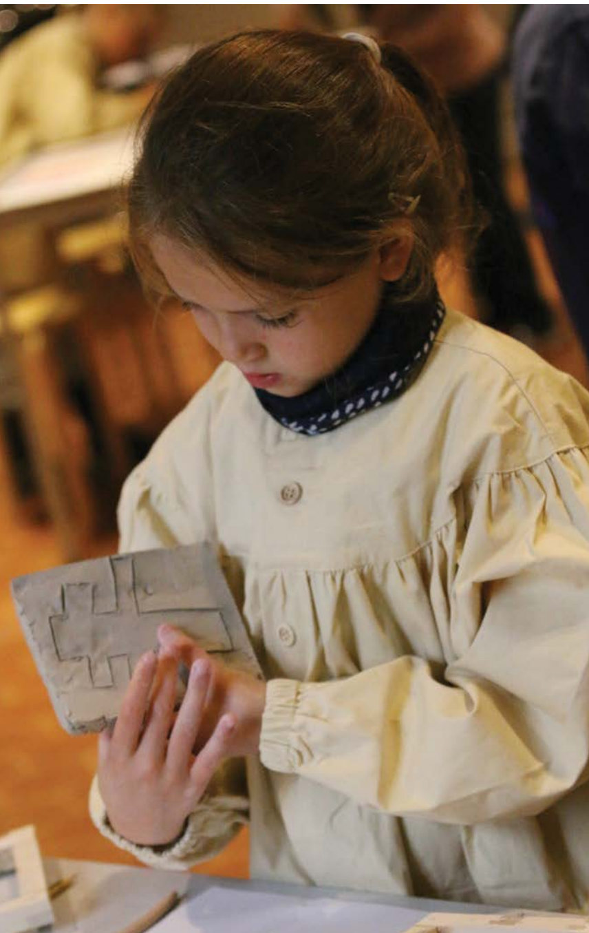
> Atelier médailles, insignes et drapeaux.