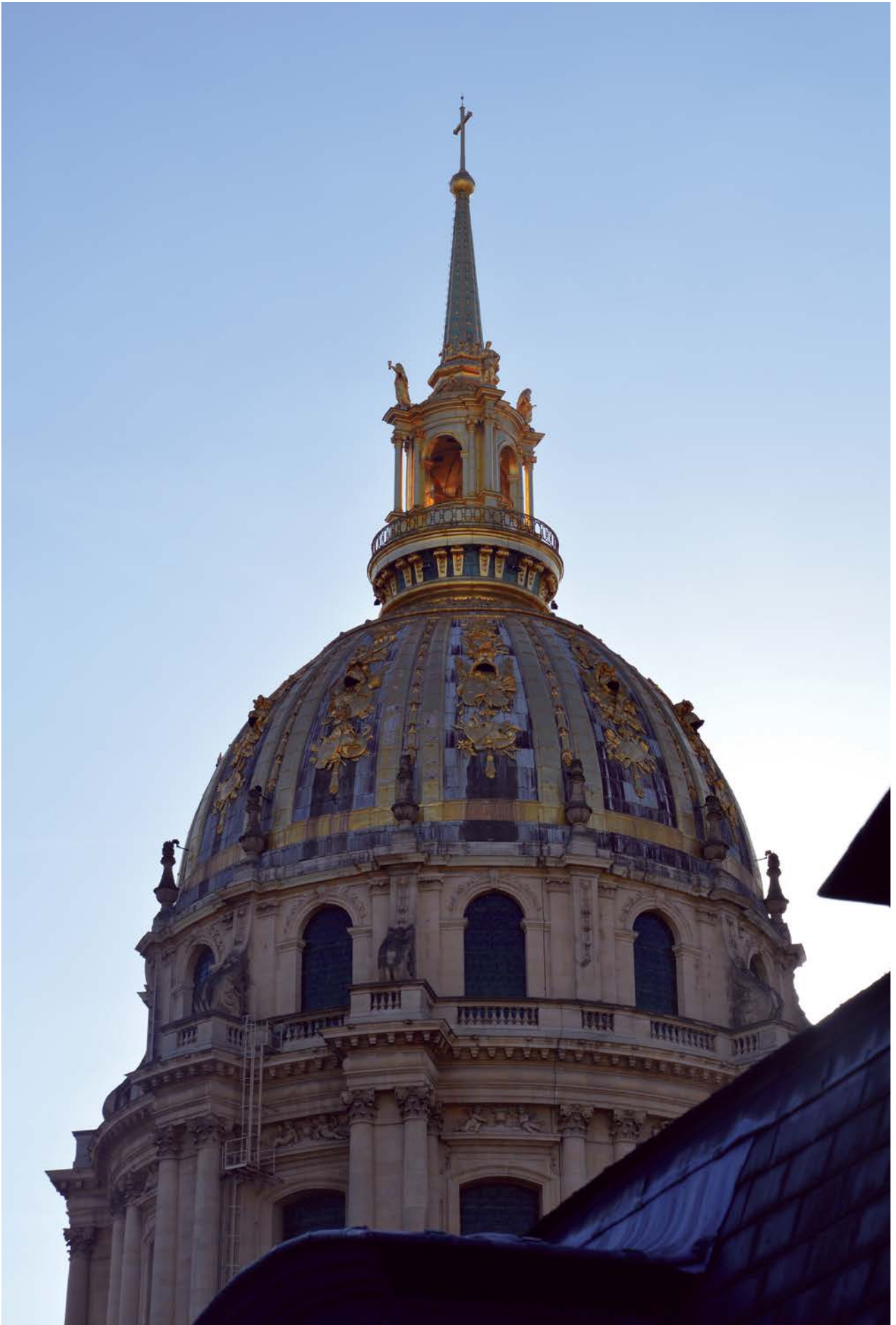
> Dôme des Invalides, 2018.