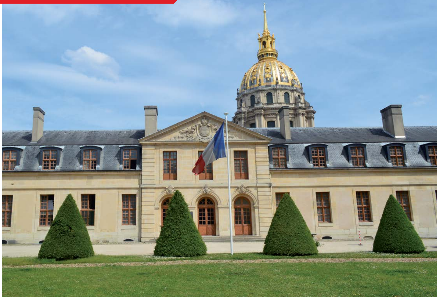
> Façade de l'Ordre de la Libération, 2017.

... Et y installer la chancellerie de l'Ordre de la Libération, institution par essence régaliennne, gardienne dans les murs de son musée de l'histoire de la France de l'honneur, et dont la vocation, désormais, est de nourrir la Nation de vies exemplaires, relevait bien d'une intuition gaullienne.