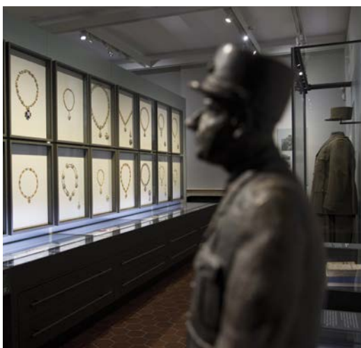
▲ UNE SALLE EST ÉGALEMENT DÉDIÉE AU GÉNÉRAL DE GAULLE, FONDATEUR ET GRAND MAÎTRE