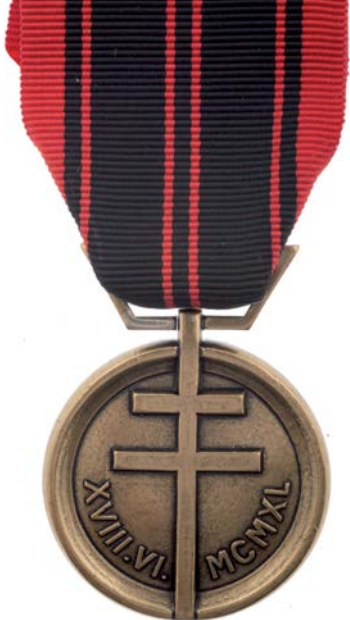
> Envers de la médaille de la Résistance française.