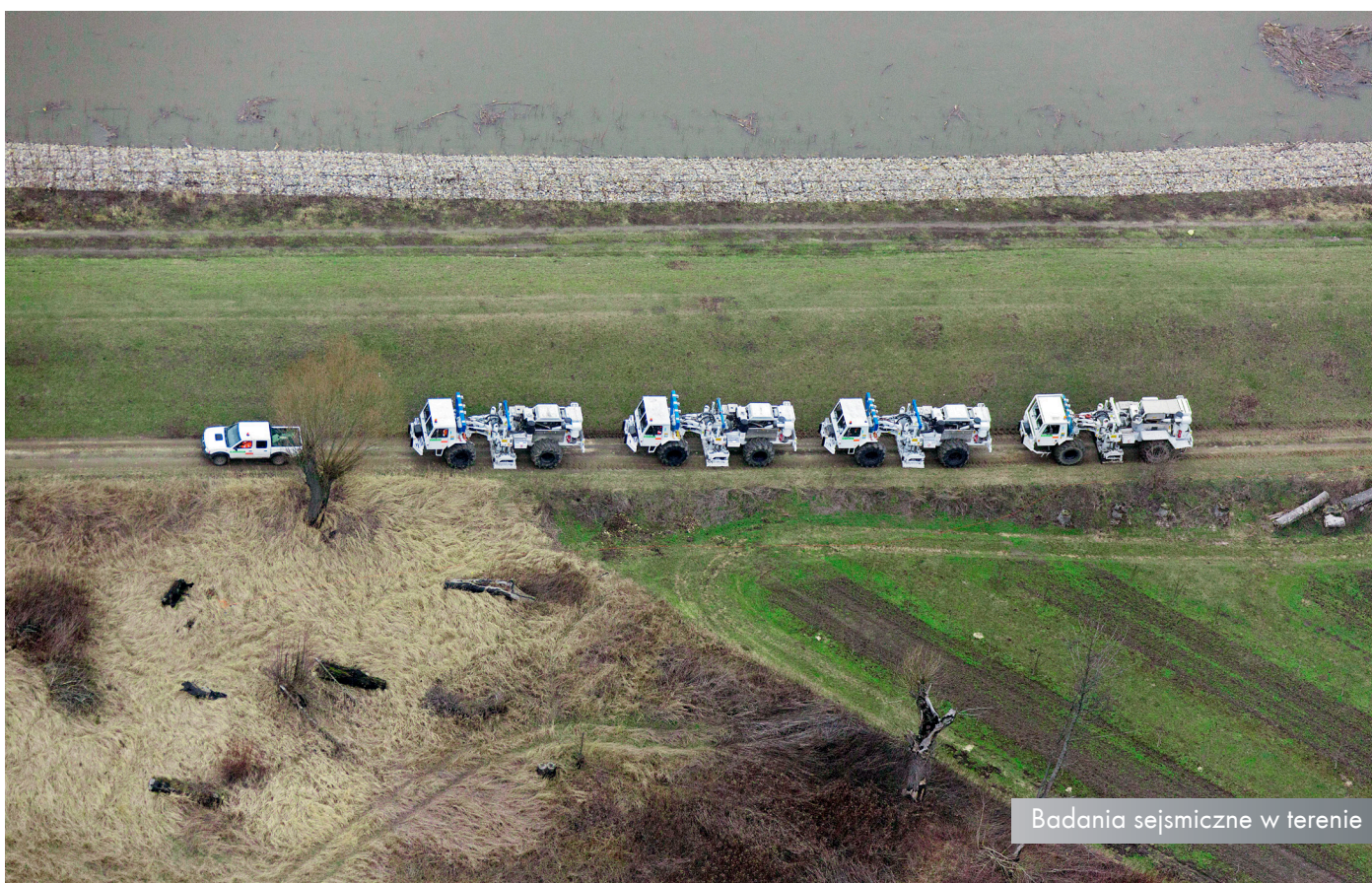
Badania sejsmiczne w terenie

sejsmiczne wykonują specjalistyczne firmy, których pracownicy dokładają wszelkich starań, aby badania nie powodowały utrudnień w życiu i pracy mieszkańców. Każdorazowo są poprzedzane uzgodnieniami z właścicielami gruntów, na których będą prowadzone. Prace nie wpływają na jakość wód podziemnych i gleby, zaś wytwarzane fale nie stanowią zagrożenia dla otoczenia.