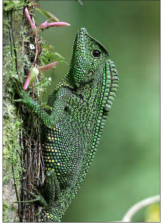
Abb. 4: Adultes Gonocephalus cf. abbotti -Weibchen vom Gunung Talamau, 1050 m ü.d.M., West-Sumatra, Indonesien. Fig. 4: Adult female of Gonocephalus cf. abbotti from Gunung Talamau 1050 m asl, West Sumatra, Indonesia.

finden sich oberhalb davon noch nahezu unberührte Wälder mit vereinzelt Stellen, an denen der Unterbewuchs entfernt wurde. Die Vegetation der mittleren Höhenlagen kann als primärer Bergwald (upper hill dipterocarp forest) oder submontaner Wald (Fago-Myrtaceous forest) charakterisiert werden, in dem zahlreiche dickstämmige und hohe kronendachbildende Bäume vorhanden sind. Die submontane Region um 1100 m ü.d.M. wird von Pflanzen der Familien Fagaceae, Myrtaceae und Moraceae dominiert; zudem sind einige Clusiaceae und Euphorbiaceae sehr häufig (LAUMONIER 1997).