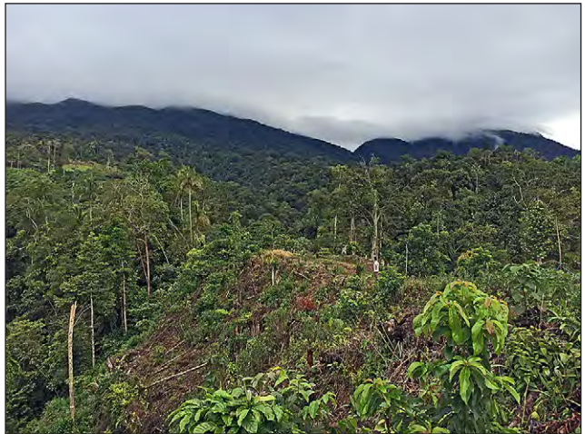
Abb. 1 (oben): Die Westseite vom Gunung Talamau, von Lubuak Landua aus gesehen. Fig. 1 (top): The western side of Gunung Talamau, viewed from Lubuak Landua.