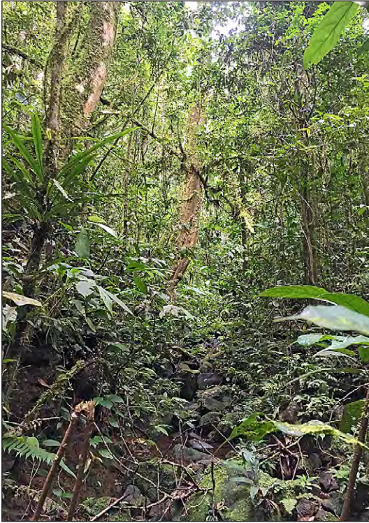
Abb. 3: Habitat an der Fundstelle des Sumatra- Gonocephalus cf. abbotti mit Waldstruktur und einem kleinen Bach. Fig. 3: Habitat at the site where the Sumatran Gonocephalus cf. abbotti was discovered, showing forest structure and a small stream.