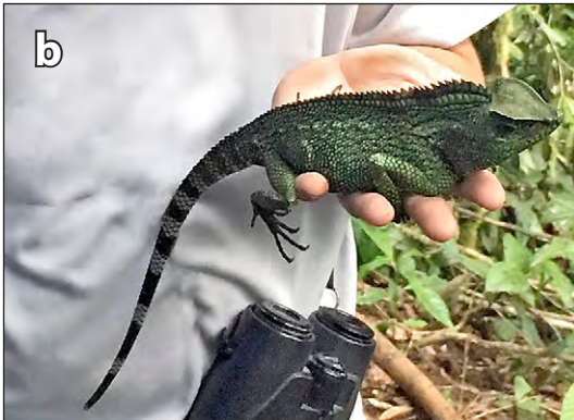
Abb. 8 a + b: Die Ermittlung der Kopf-Rumpf- und Schwanzlänge erfolgte entsprechend dieser Aufnahmen des Weibchens von Gonocephalus cf. abbotti vom Gunung Talamau. Fig. 8 a + b: The determination of the snout vent and tail length was carried out according to these images of the female of Gonocephalus cf. abbotti from the Gunung Talamau.

Weitere Aufnahmen des Weibchens sind im Internet verfügbar unter [Further photographs of the female are available at https://www.inaturalist.org/observations/10543930 + ... /10570790 ].