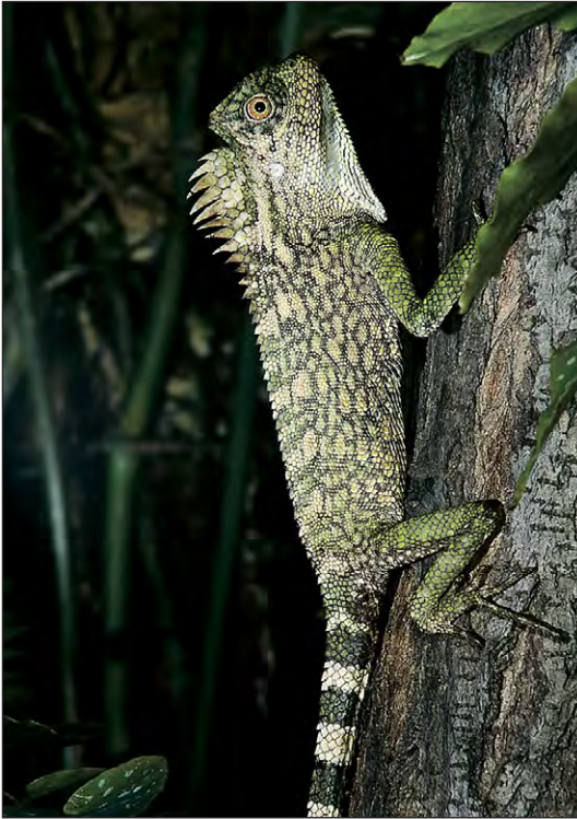
Abb. 5: Adultes Gonocephalus chamaeleontinus -Weibchen von Sumatra im Vergleich zu G. cf. abbotti . Fig. 5: Adult female of Gonocephalus chamaeleontinus from Sumatra compared to G. cf. abbotti .

Nacken- und Rückenamm geschlechtsspezifisch ist. MANTHEY & DENZER (1993) schlussfolgerten dementsprechend, dass es sich um Unterarten handelt, einzig basierend auf ihrer allopatrischen Verbreitung und Größe (KRL ♂/♀ von doriae max. 132/125 mm, von abbotti 158/140 mm). Da der Name doriae zuerst vergeben wurde, steht ihm nomenklatorische Priorität zu, sodass die Autoren Exemplare von Borneo der Nominatform zurechneten und Exemplare der malaiischen Halbinsel als G. doriae abbotti bezeichneten.