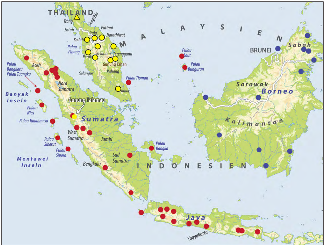
Abb. [Fig.] 7: Verbreitung von [Distribution of] G. abbotti (gelb [yellow]), G. doriae (blau [blue]) und G. chamaeleontinus (rot [red]), modifiziert nach [modified after] MANTHEY (2010).

kamm sind Merkmale, die nur von G. doriae und G. abbotti bekannt sind. Weiterhin besitzen beide Exemplare Kopf-Rumpf-Längen (5741a: 160 \pm 5 mm KRL, 5741b: 140 \pm 5 mm KRL), die größer als bekannte KRL von G. doriae sind. Wir identifizieren daher die Talamau-Exemplare (RMNH.RENA 5741a+b) als Gonocephalus cf. abbotti , bis weiteres Vergleichsmaterial zur Verfügung steht.