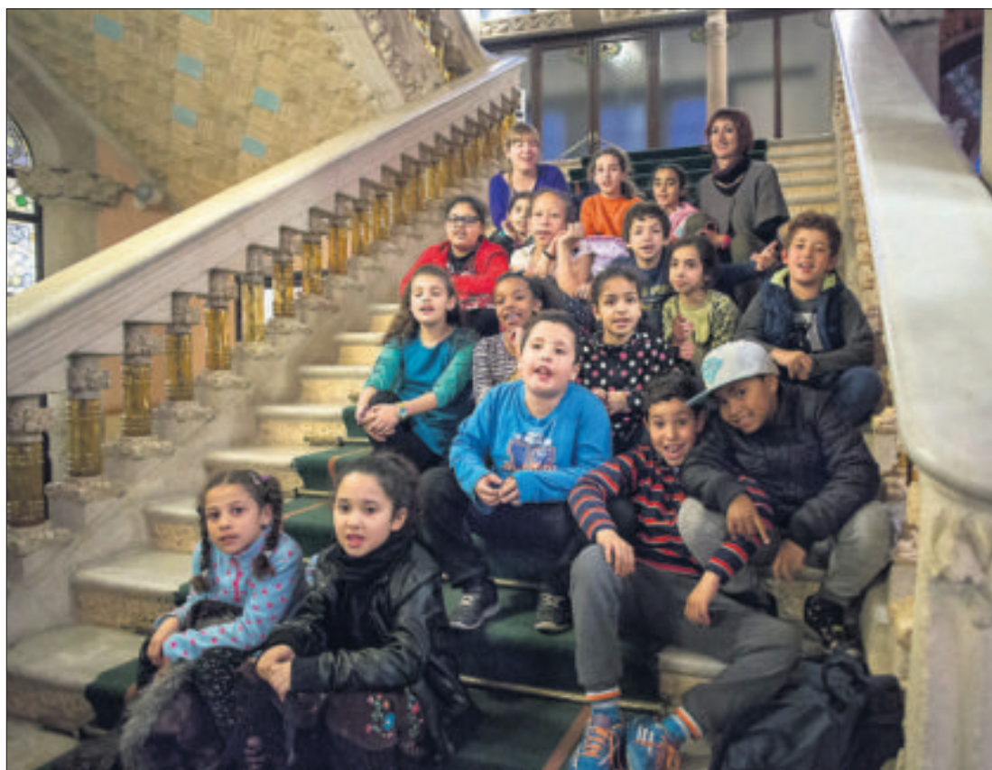
Niños y niñas de uno de los coros del programa Clavé XXI en el Palau de la Música.