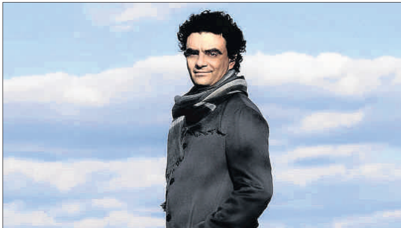
El tenor mexicà Rolando Villazón, un dels intèrprets principals de l'òpera de Mozart

El mexicà Rolando Villazón, un dels tenors lírics més reconeguts de l'actualitat, torna al Palau després de l'última actuació la temporada 2012-2013. Ha protagonitzat la versió filmica de La Bohème el 2008 juntament amb Anna Netrebko i Nicole Cabell, i ha