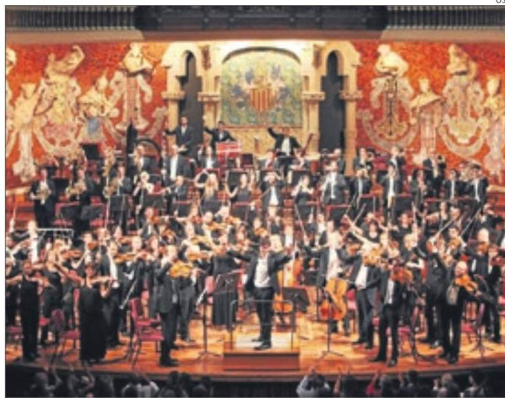
Imagen de archivo de la Orquesta Simfònica del Vallès.