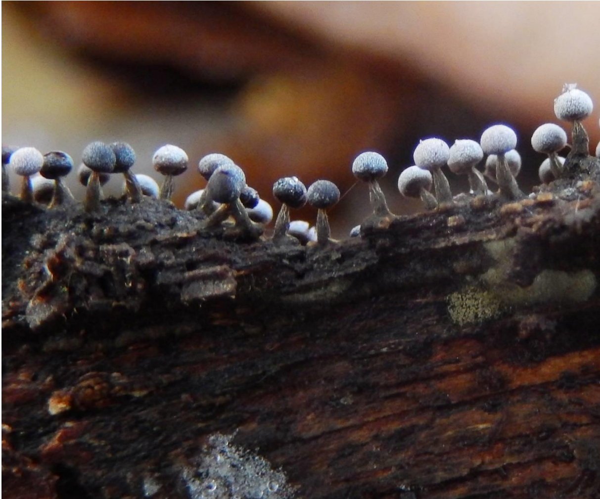
Klein vlekig kristalkopje ( Didymium minus ). Zelfde grootte en uitzicht als tapsteelkristalkopje. Steel verbreedt dikwijls in het midden en de steeltop is minder spits en niet wit zoals bij tapsteel. Hoofdje bol ipv niervormig. Stroopers