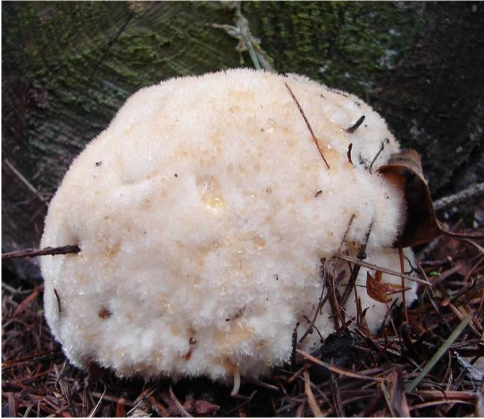
Wit kalkkussen ( Fuligo candida ). Vrijwel altijd op naaldhout.