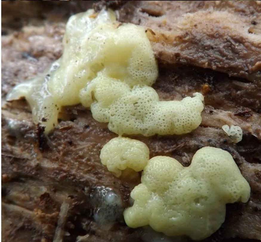
IJsvingertje ( Ceratomyxa fruticulosa . var. poroides ). Gele variant in drie ontwikkelingsfases