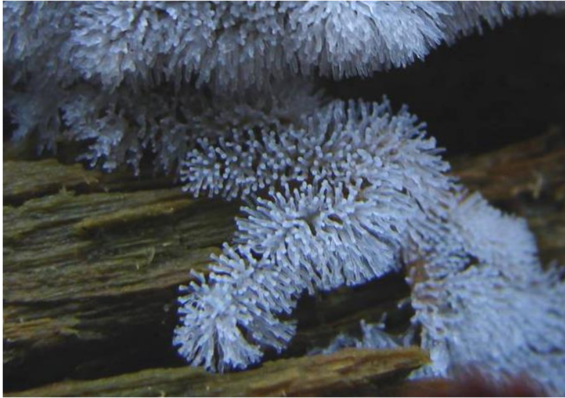
IJsvingertje ( Ceratomyxa fruticulosa ). Meestal op hout.