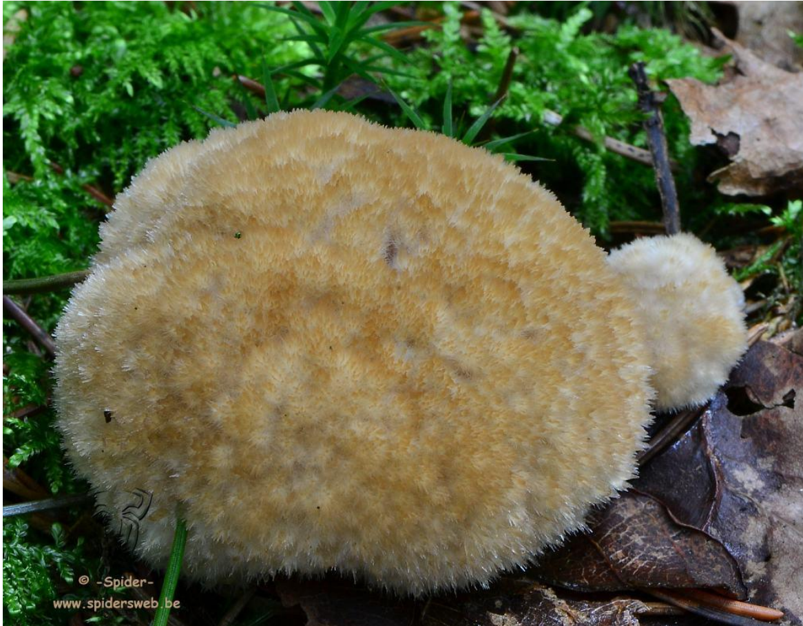
Roestbruin kalkkussen ( Fuligo rufa ).