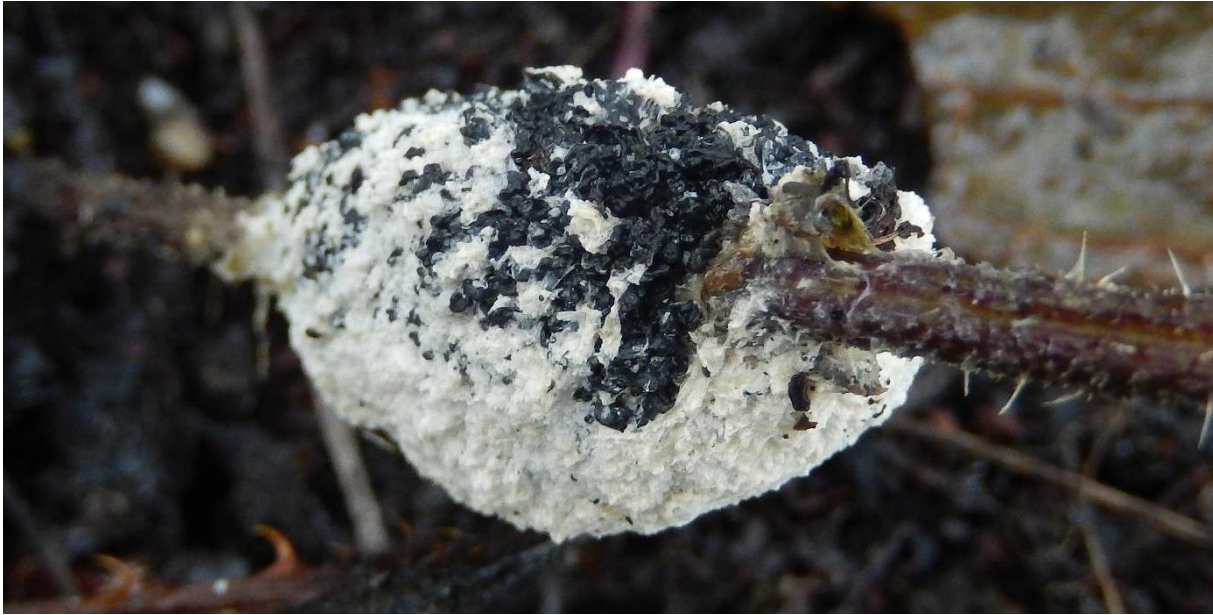
Kalkschuim ( Mucilago crustacea ) Zwarte sporen.