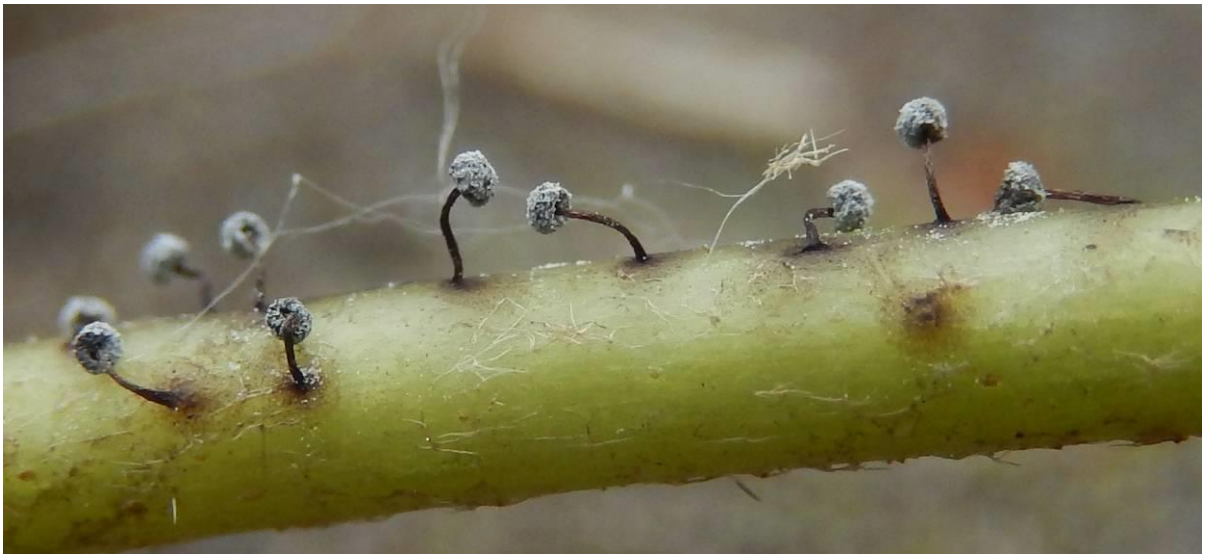
Zwartsteelkristalkopje ( Didydimium nigripes )