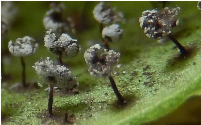
Zwartsteelkristalkopje ( Didymium nigripes ). Panneweel, Eksaarde, Stroopers Zwartsteelkristalkopje