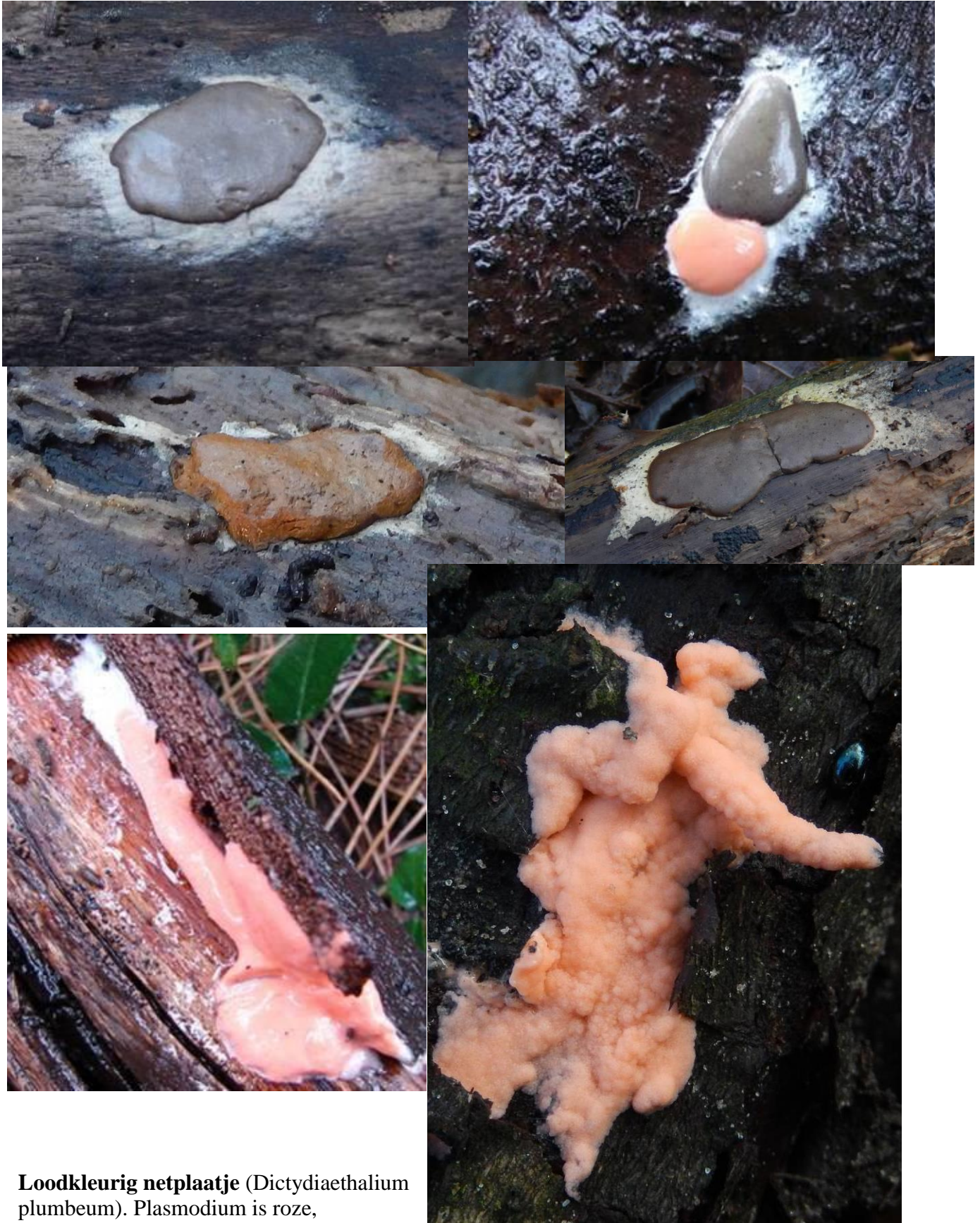
Loodkleurig netplaatje ( Dictydiaethalium plumbeum ). Plasmodium is roze, stationaire fase grijs. Er bestaat een roestkleurige variant, vroeger als aparte soorten beschouwd IJzerkleurig- en Kaneelkleurig netplaatj