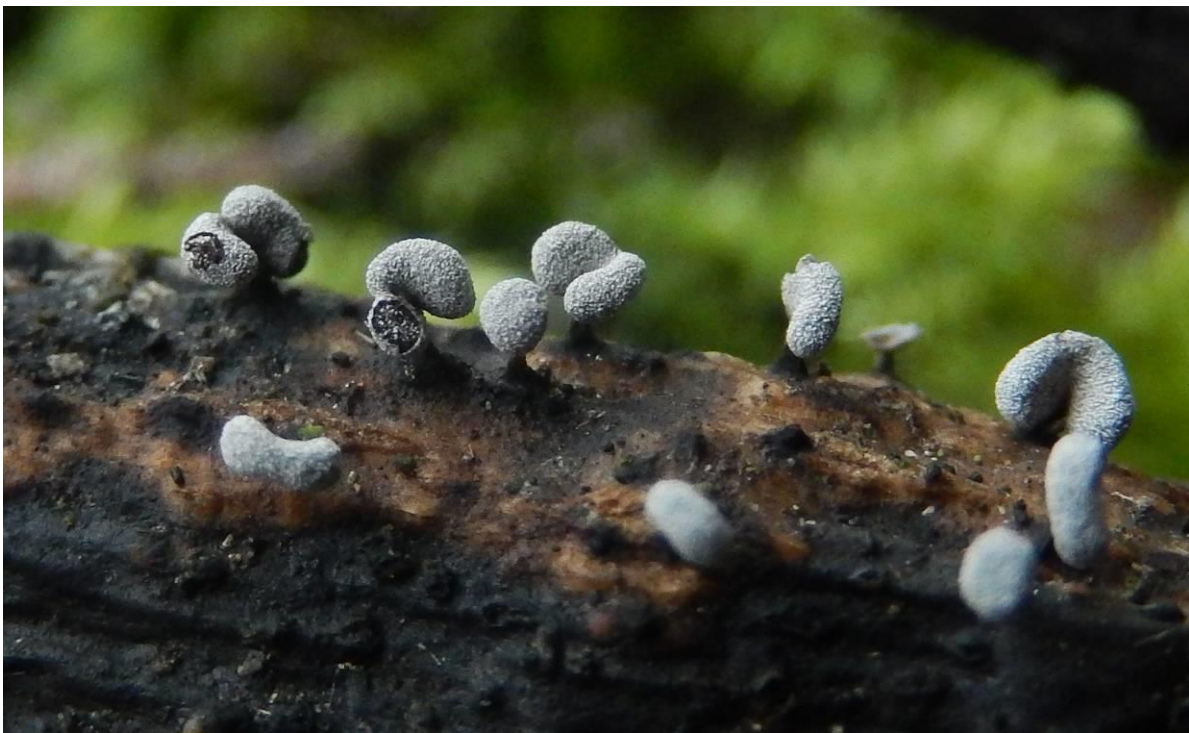
Wormvormig kalknetje ( Badhamia affinis var affinis ). Let op de kalkdraden tussen de sporen. Bolvormig tot onregelmatig kronkelend. Zittend of kort gesteeld. Eksaarde