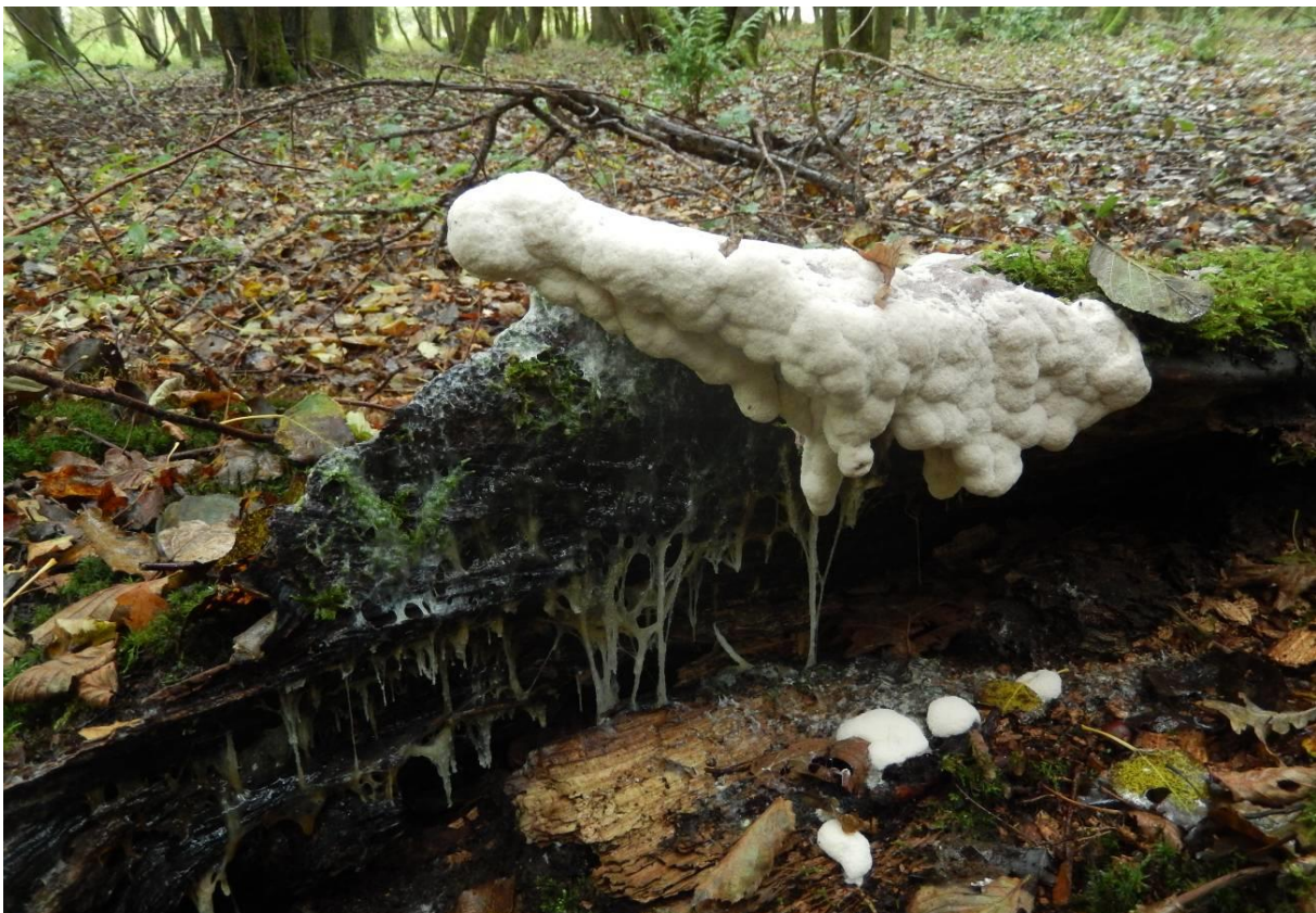
Kalkschuim ( Mucilago crustacea ). Reusachtig vorm op dood hout. Lengte ongeveer 20cm, normaal zelden groter dan 5cm. Let ook op achtergebleven slijm en kleiner fragmenten die de normale grootte weergeven. Heirnisse Sinaai.