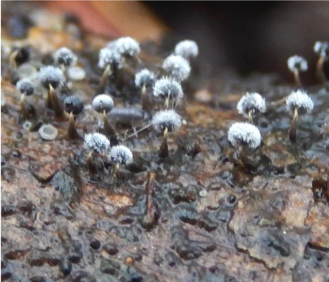
Tapsteelkristalkopje syn spitsstelig kristalkopje ( Didymium bahiense ). Boven met schimmelziekte.