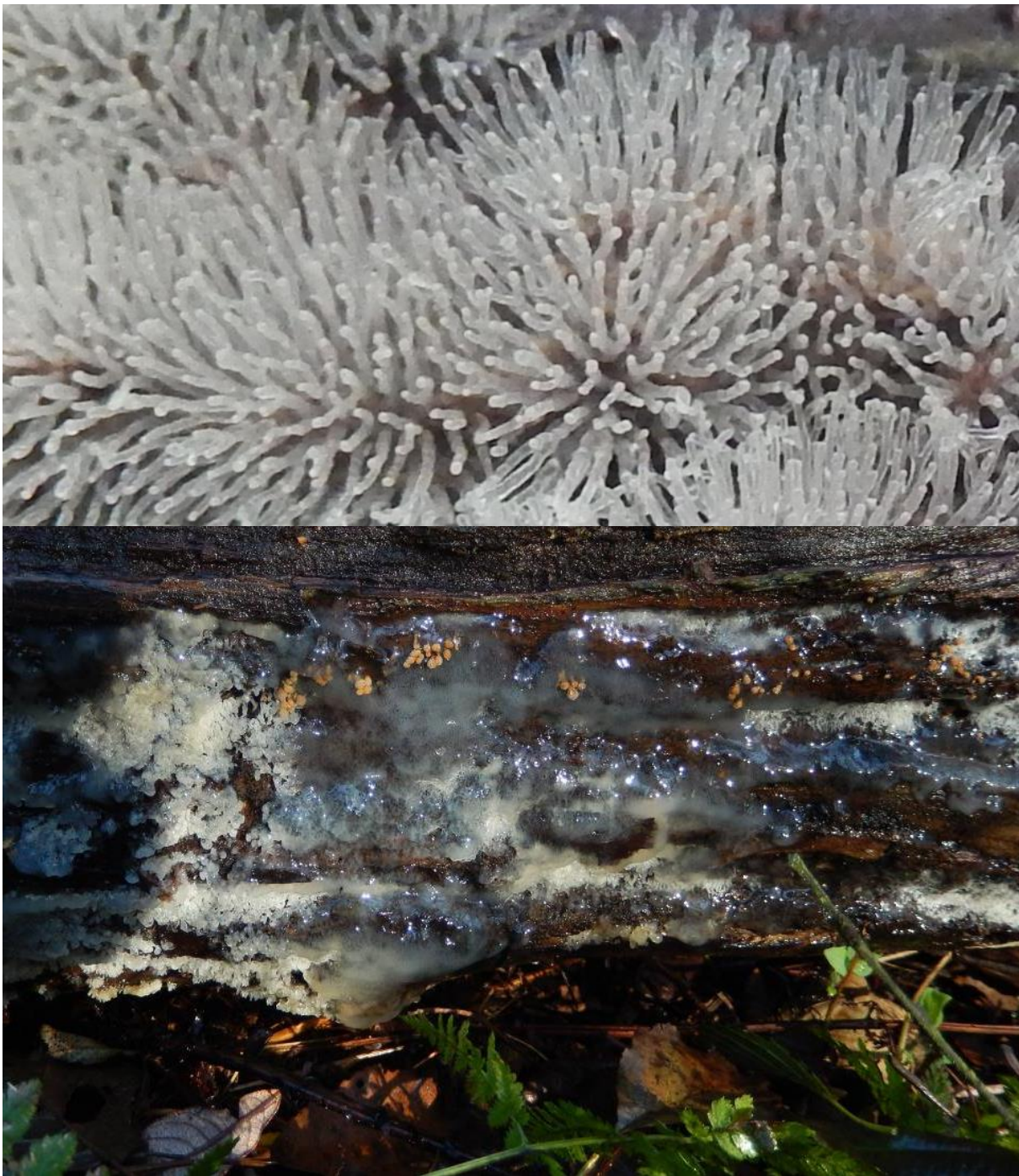
Grijs gevorkt ijsvingertje

Na sporezetting verslijmt het ijsvingertje en vormt op deze manier misschien een ideale biotoop voor de ontwikkeling van een nieuwe levenscyclus.