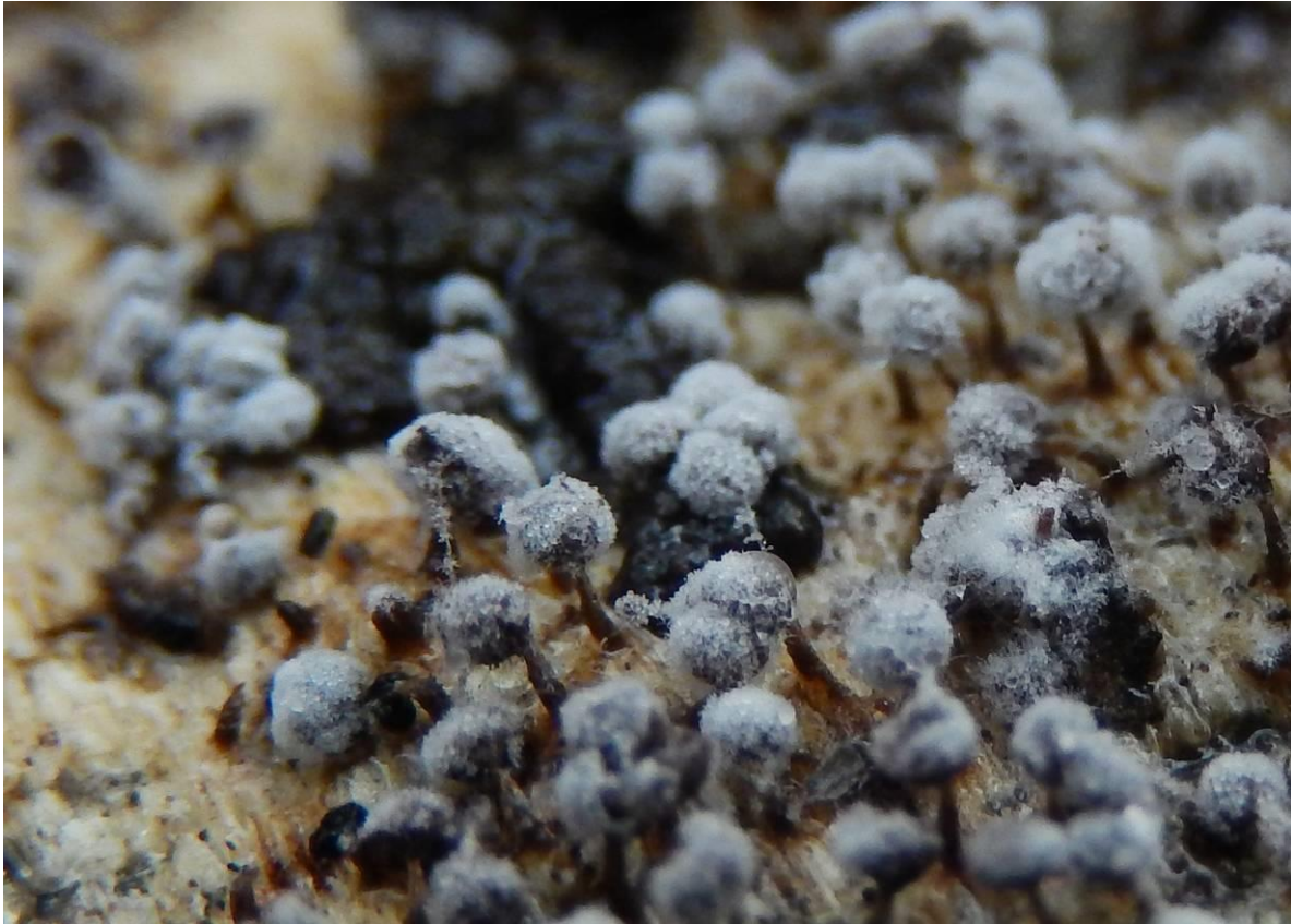
Vlekkig kristalkopje ( Didymium melanospermum ). Hoofdje tweemaal zo groot als kleinvlekkig- of tapsteelkristalkopje. De kristallen kunnen van het hoofdje schuiven en laten dan een bruin hoofdje achter in dezelfde kleur als de steel. Stroopers