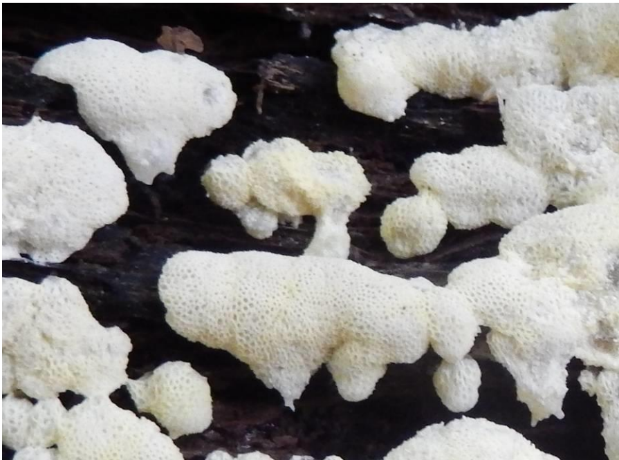
Ijsvingertje ( Ceratomyxa fruticulosa . var. poroides ) Witte variant Puyenbroek en heidebos