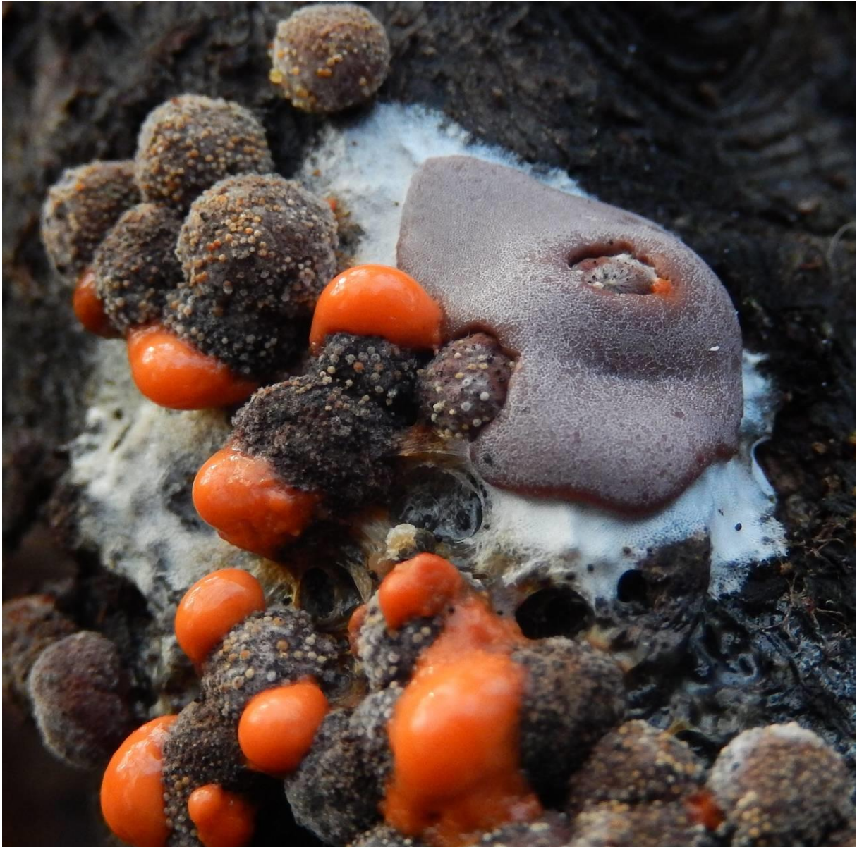
Loodkleurig netplaatje ( Dictydiaethalium plumbeum ). Eksaarde. Op oude roestbruine kogelzwam. Lichaam opgebouwd uit facetvormige buisjes die naast elkaar staan.