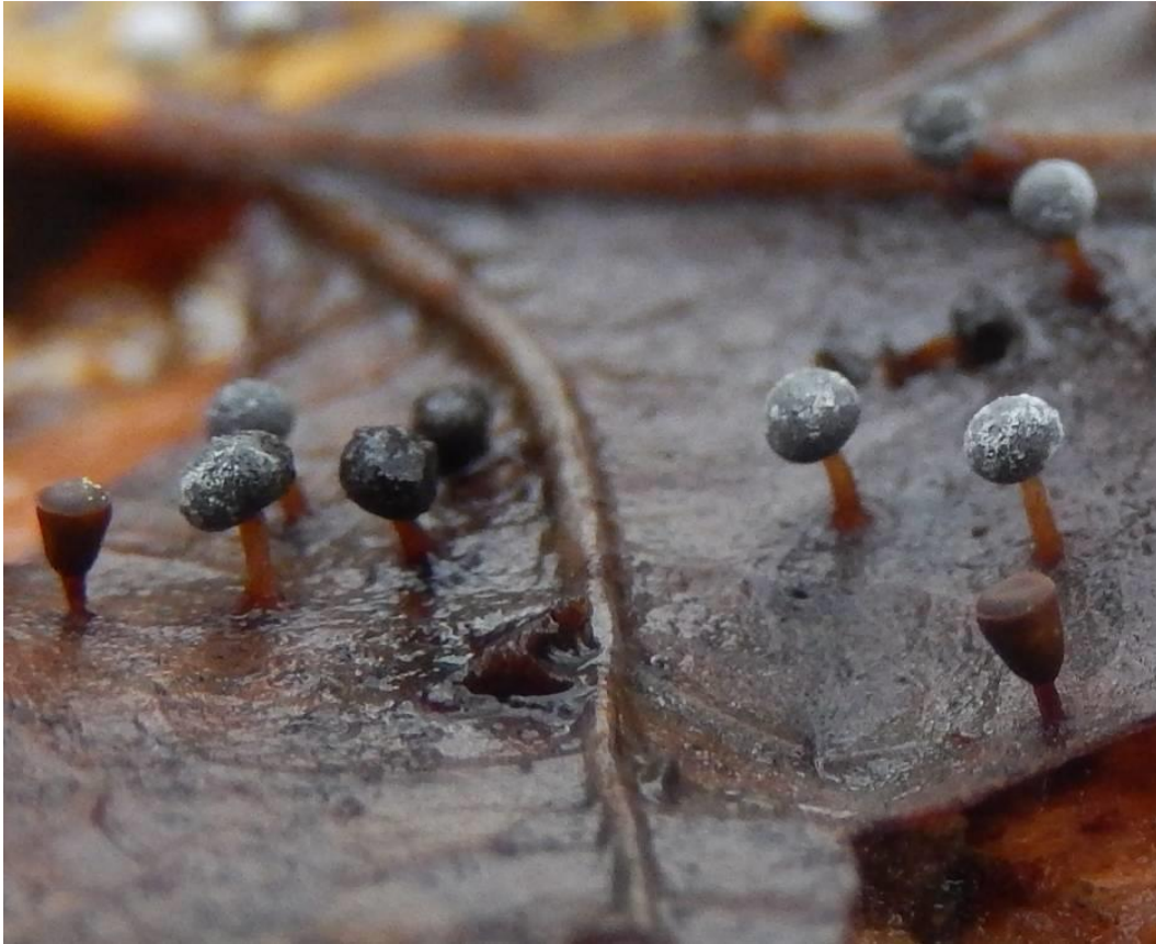
Oranjesteelkristalkopje ( Didymium megalosporum . Heidebos. Steel bruinoranje. Boven met gewoon kalkbekertje.