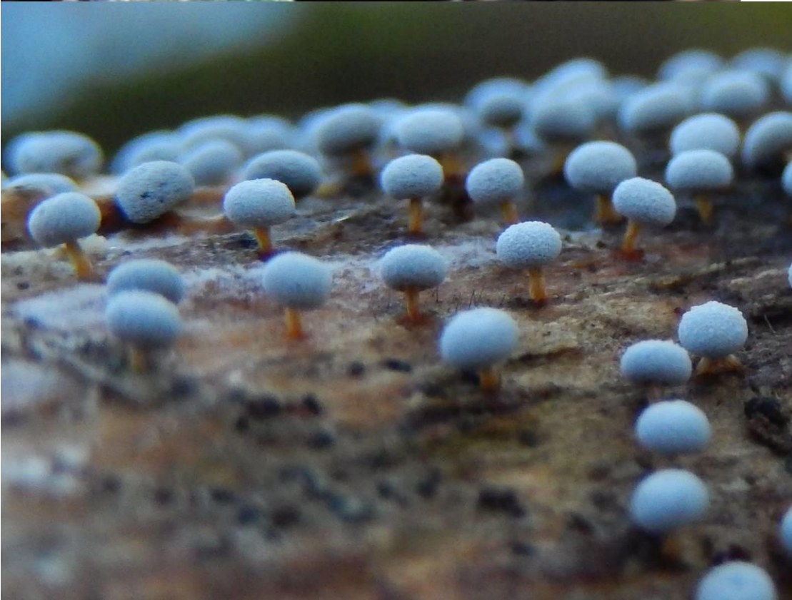
Oranjesteelkristalkopje ( Didymium megalosporum ) Panneweel