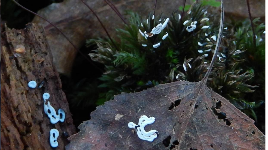
Plat kalkschaaltje ( Diderma applanatum ). Makkelijk te verwarren met actieve slijmzwam of enkele andere soorten (glad kristalkopje en Opensplijtend kalkkopje). De netvorm is echter vrij typisch. Verwarring kan optreden wanneer de vorm worstvormig is