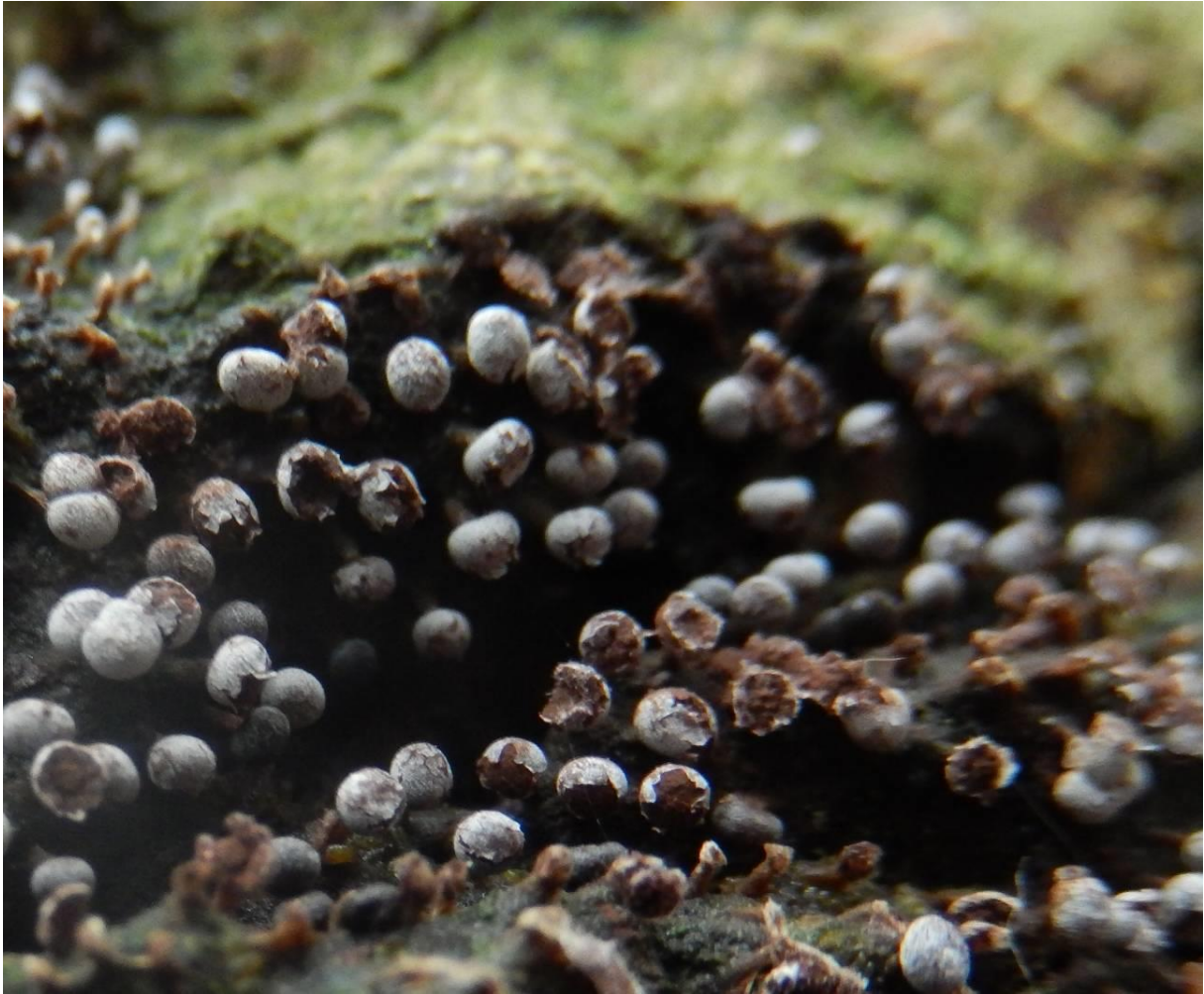
Fors kalkkopje ( Physarum robustum ). Sporenpoeder onrijp zwartviolet, rijp bruin. Zittend of met bruine korte steel. Stroopers Lange Vaag. TWIJFELACHTIG