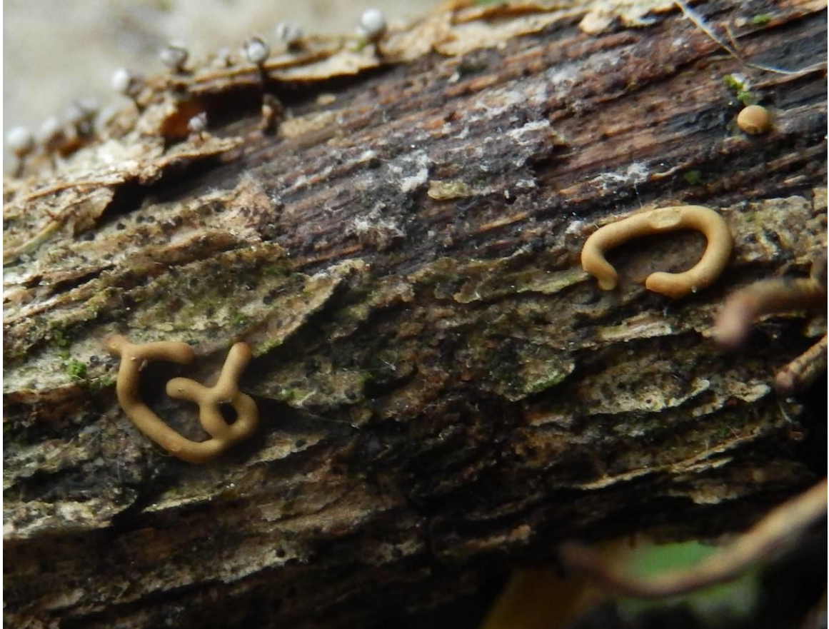
Wormvormig goudkussen ( Perichaena vermicularis ).