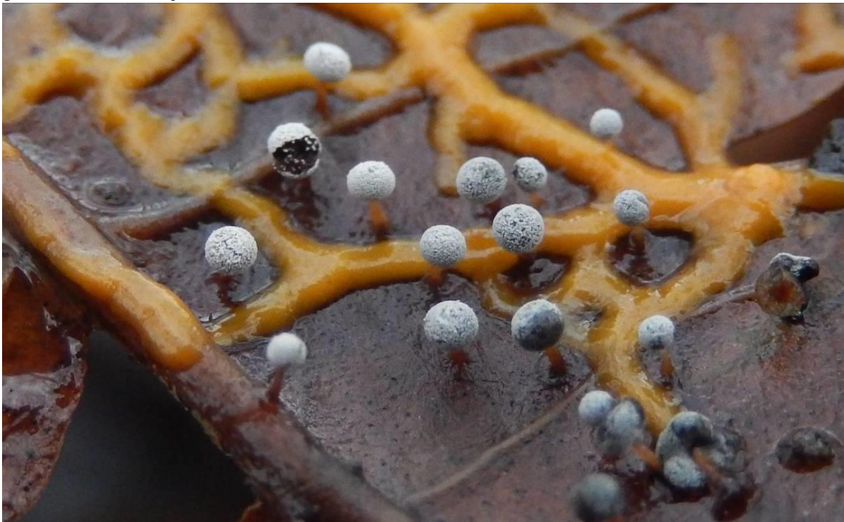
Oranjesteelkristalkopje ( Didymium megalosporum