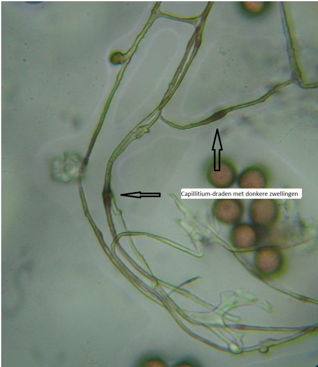
Tapsteelkristalkopje syn spitsstelig kristalkopje. Microscopie Dirk Baert.