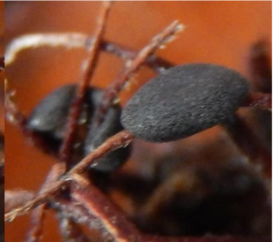
Spijkerkristalkopje ( Didymium clavus ). Stroopers, Eksaarde en Hingene. Altijd gesteeld als