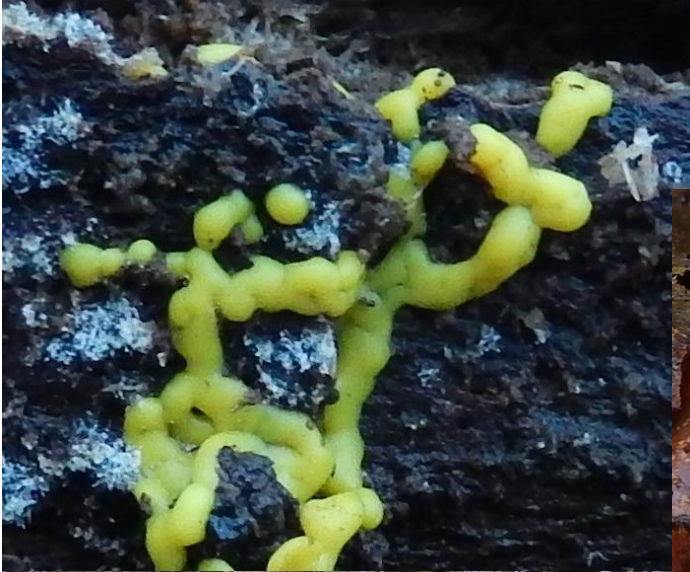
Wormvormig goudkussen ( Perichaena vermicularis ). 69B op dode liggende els. Onder op bladeren. 0,5 -1 cm