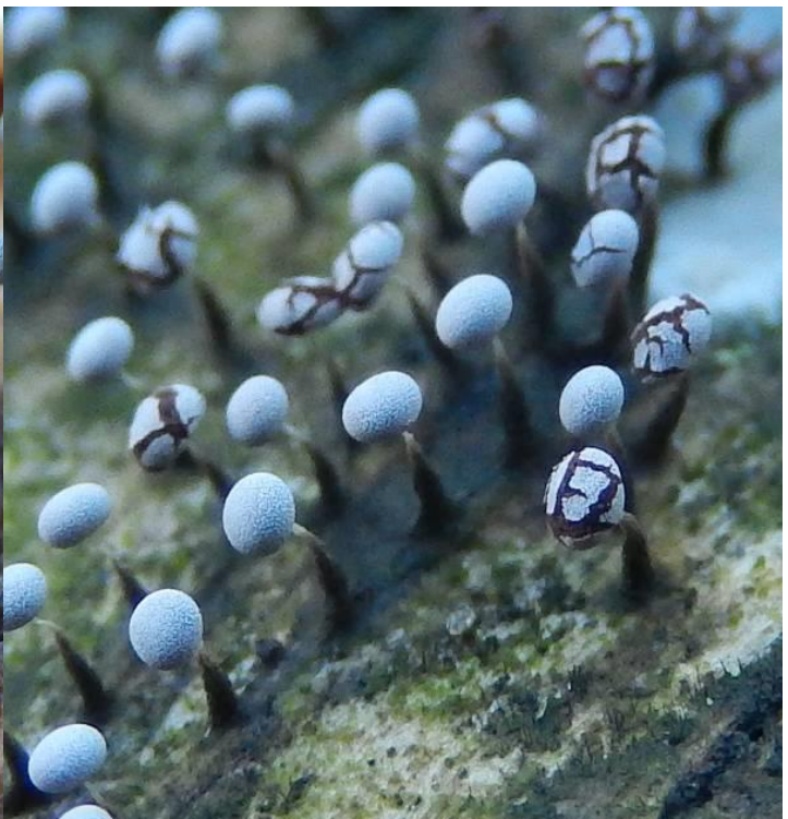
Tapsteelkristalkopje syn spitsstelig kristalkopje ( Didymium bahiense ); Met duidelijk versmallend bruin steeltje. Hoofdje soms geknikt. Kloosterbos, 69B. Puyvelde