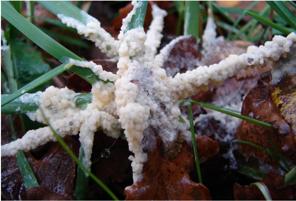
Kalkschuim (Mucilago crustacea)

Op grassen en kruiden, zacht en slijmerig. Eerst wit daarna oranjewit. Klompjes vormend bij rijpheid. Stroopers, steengelaag