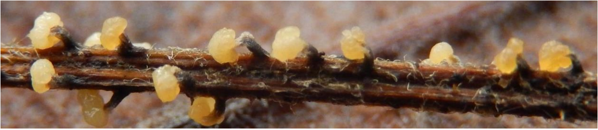
Vlekkig kristalkopje ( Didymium melanospermum var melanospermum ). Zittend of gesteeld met zwart of donkerbruin steeltje. Jagersdreef. Stroopers69a. Plasmodium bruinachtig. Wanneer zittend makkelijk te verwarren met variabel kristalkopje. Hoofdje breder dan hoog.