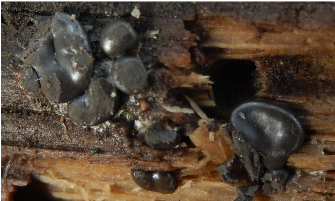
Olijfkleurige boomkussen ( Enteridium olivaceum ). Onopvallend en makkelijk te verwarren met trilzwam, 69a en Eksaarde kruiskapel. Bovenste foto's : kruipend en 5 dagen later. TWIJFELACHTIG