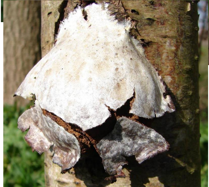
Zilveren boomkussen ( Enteridium lycoperdon ) Op rechte stammen van meestal loofbomen.