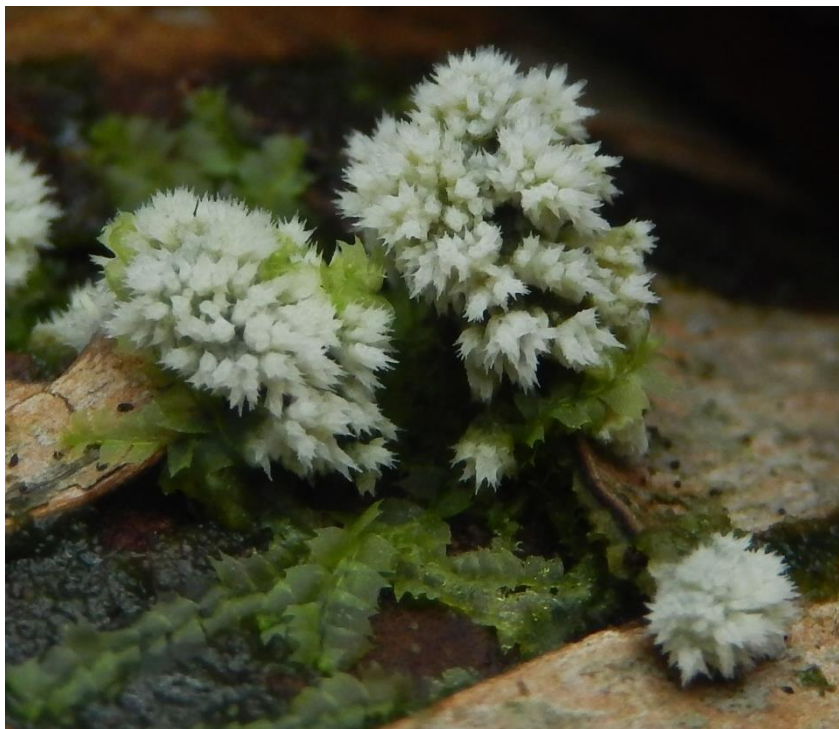
Franjetandjeszwam ( Hyphodontia barb-jovis ) Foto boven, kan verward worden met ijsvingertje.