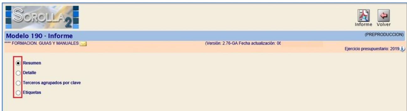
Ilustración 6 - Tipos de informes para Modelo 190