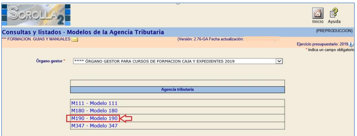
Ilustración 2 - Selección tipo de modelo 190