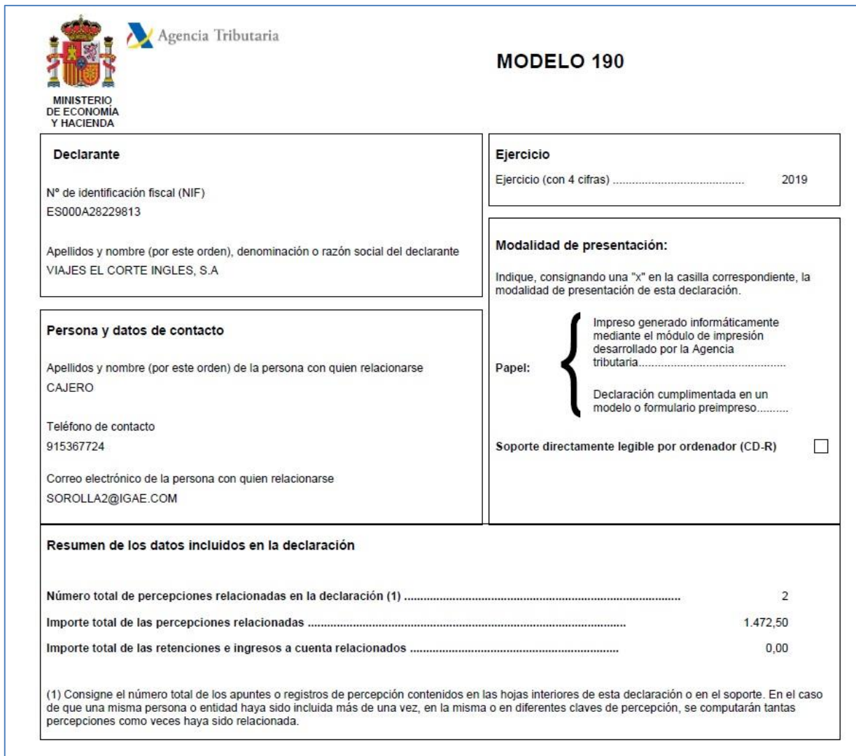
Ilustración 7 – Ejemplo de Modelo 190

Para generar el fichero pulsar el botón “Fichero”. En la pestaña “Ficheros ” se puede ver haciendo clic en el enlace.