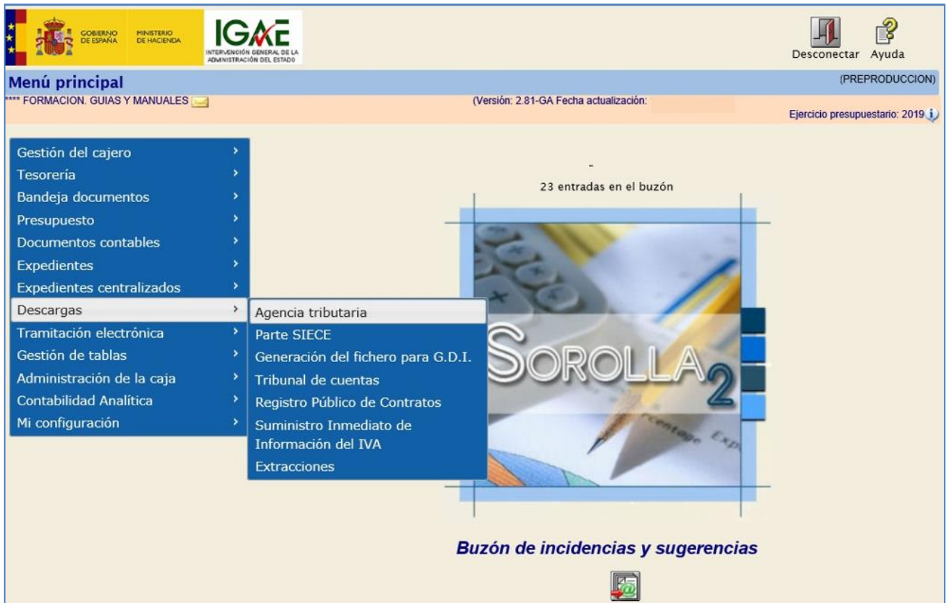
Ilustración 1 - Menú Descargas, Agencia Tributaria