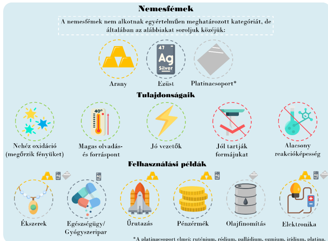
1. ábra: Nemesfémek