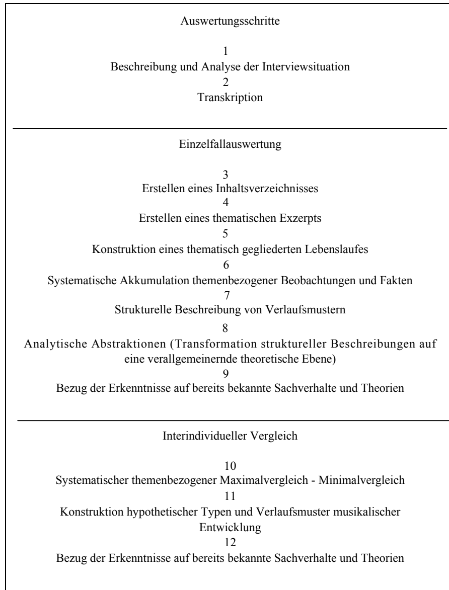
Abb. 1 Ablaufschema der Auswertung