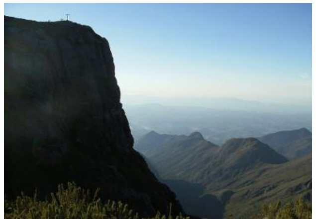
Desfiladeiro no Pico da Bandeira (ES) 1