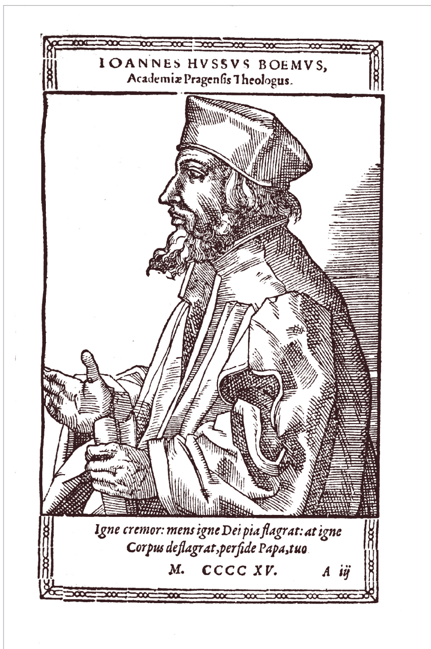
Christoph Murer, Jan Hus, v: Icones sive imagines virorum literis illustrium , 1587.