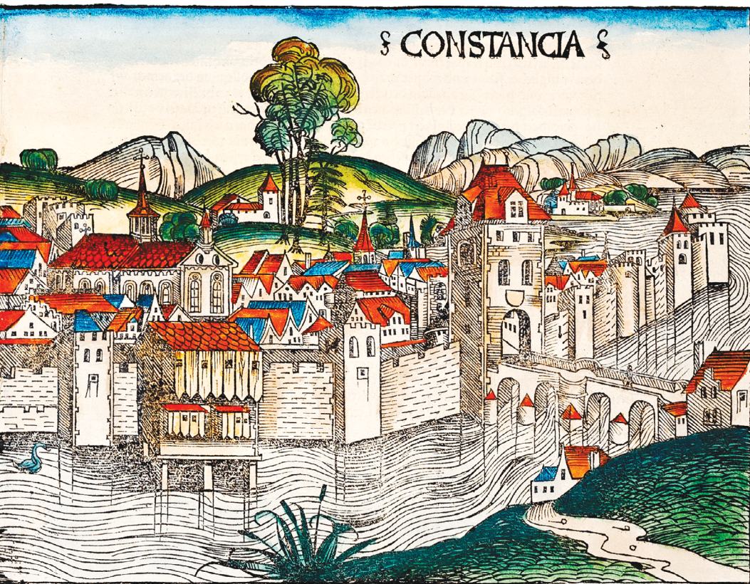
Hartmann Schedel, Konstanca, v: Liber chronicarum , 1493.