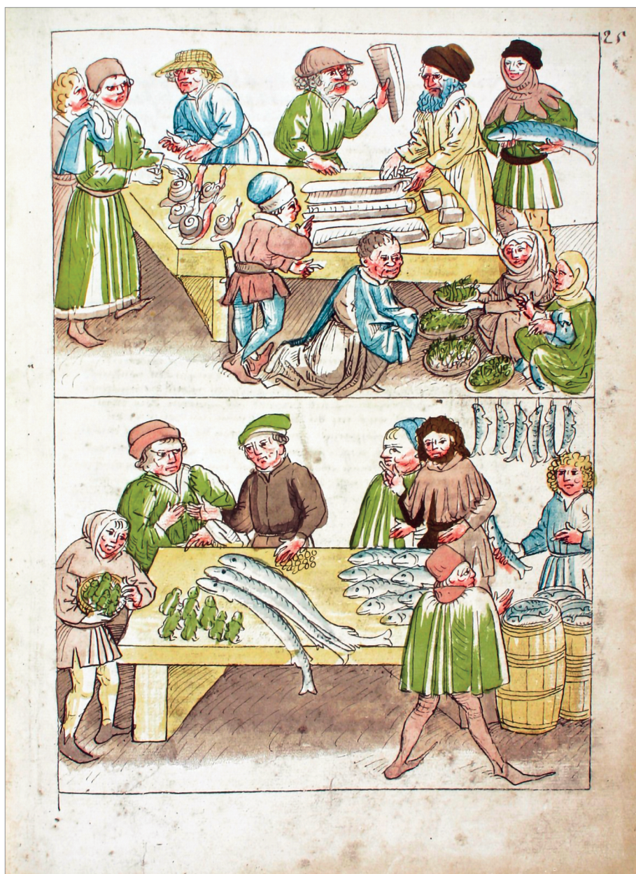
Ulrich Richental, prodaja rib, žab in polzev, v: Konzilschronik , 25r.