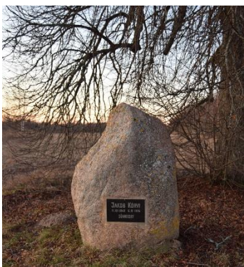
Foto 4. Jakob Kõrvi sünnikoht paigaldatud mälestuskivi.