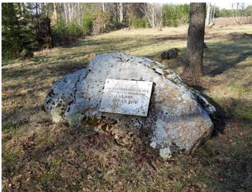
Foto 2. Juhan Liivi sünnikohale paigaldatud mälestuskivi.

ta eesti kirjandusse suuresti postuumselt, tema teoseid toimetanud Friedebert Tuglase toimetaja- ja kriitikutöö mõjul. Suurima panuse andis Juhan Liiv luuletajana.