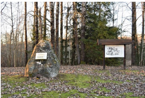
Foto 1. Anna Haava sünnikohale paigaldatud mälestuskivi.