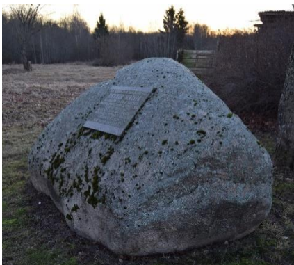
Foto 5. Osvald Halliku sünnikoht paigaldatud mälestuskivi.