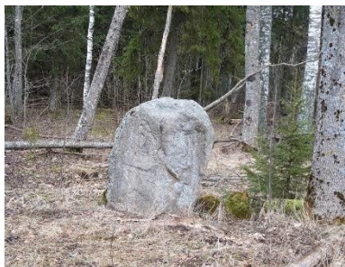
Foto 3. Eduard Markuse sünnikohta paigaldatud mälestuskivi (Autor: Peipsiääre Vallavalitsus, 2020).