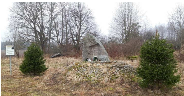
Foto 7. Valter Pedaki sünnikohta paigaldatud mälestuskivi (Autor: Peipsiääre Vallavalitsus, 2020).