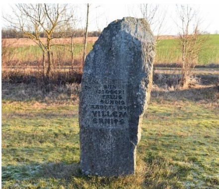
Foto 6. Villem Ernitsa sünnikohta paigaldatud mälestuskivi.