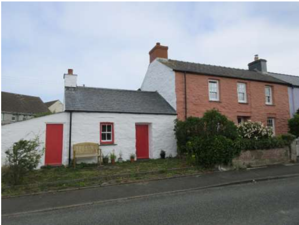
Ffigwr 16 - Rwbel gwyngalchog traddodiadol