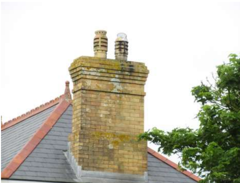
Ffigwr 30 Corn simdde o frics Sir y Fflint