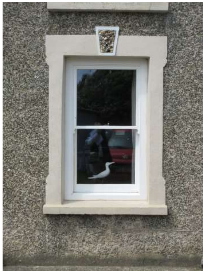
Ffigwr 21 - ffenestr codi gyda 2 chwarel