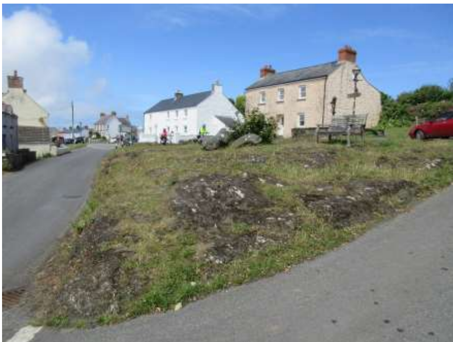
Ffigwr 8 - Carreg-y-Groes