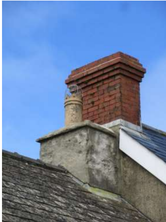
Ffigwr 29 -Y cyferbyniad rhwng corn simdde carreg a chorn simdde brics diweddarach