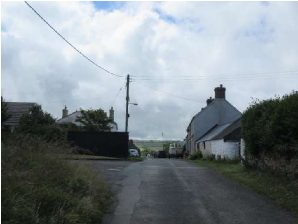
Ffigwr 15 - gwifrau, y Pen Gogleddol