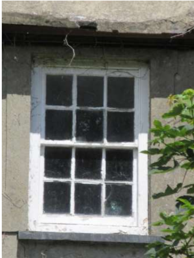
Ffigwr 18 - Ffenestr codi gyda 12 chwarel o'r 19eg ganrif gynnar