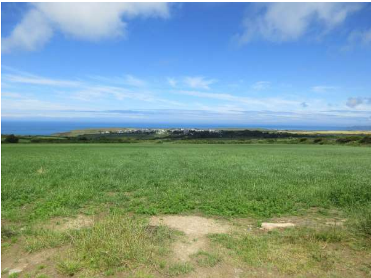
Ffigwr 36-Yr olygfa o Lan-non