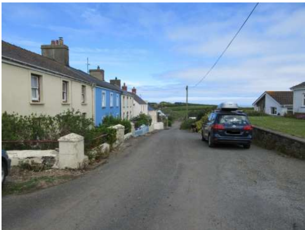
Ffigwr 13 - Pen Gogleddol - diffyg palmentydd ffurfiol