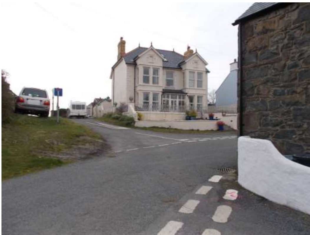
Ffigwr 2 - Adeilad Tirnod