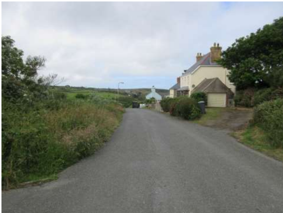
Ffigwr 6 - yr olygfa i'r gorllewin o Ffordd-y-felin