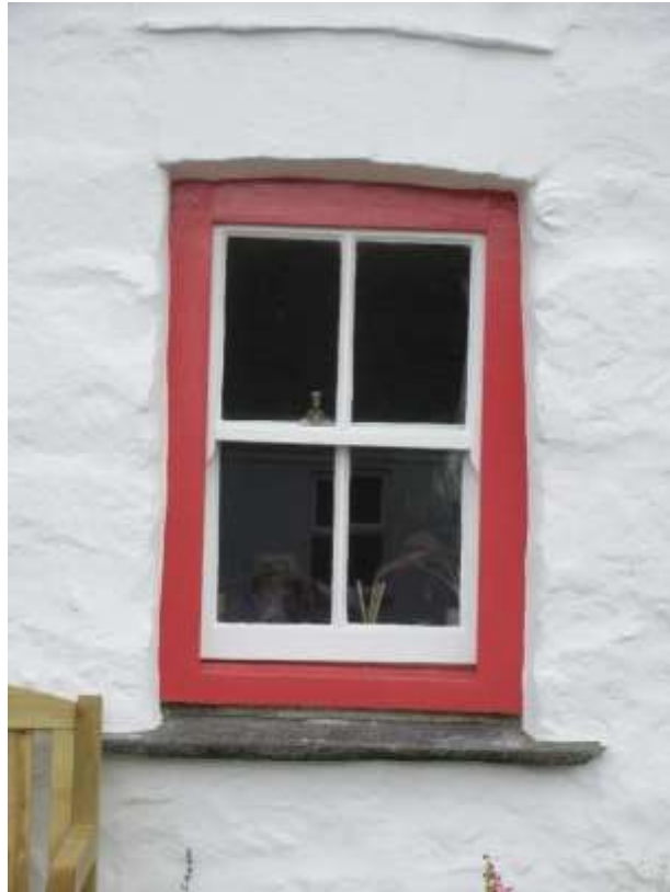
Ffigwr 20 - ffenestr codi gyda 4 chwarel