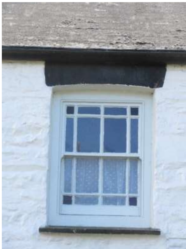
Ffigwr 19 - Ffenestr godi wedi'i gwydro ychydig