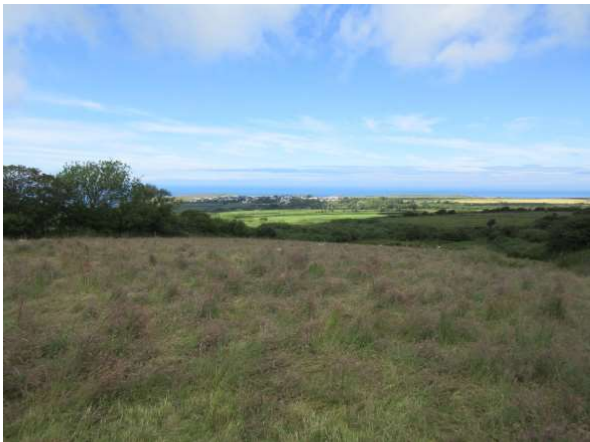
Ffigwr 10 -Yr olygfa dros Dre-fin o Lan-non