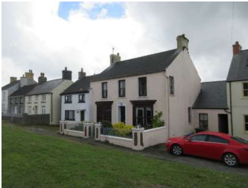
Ffigwr 7 – Ardaloedd Agored Hanfodol