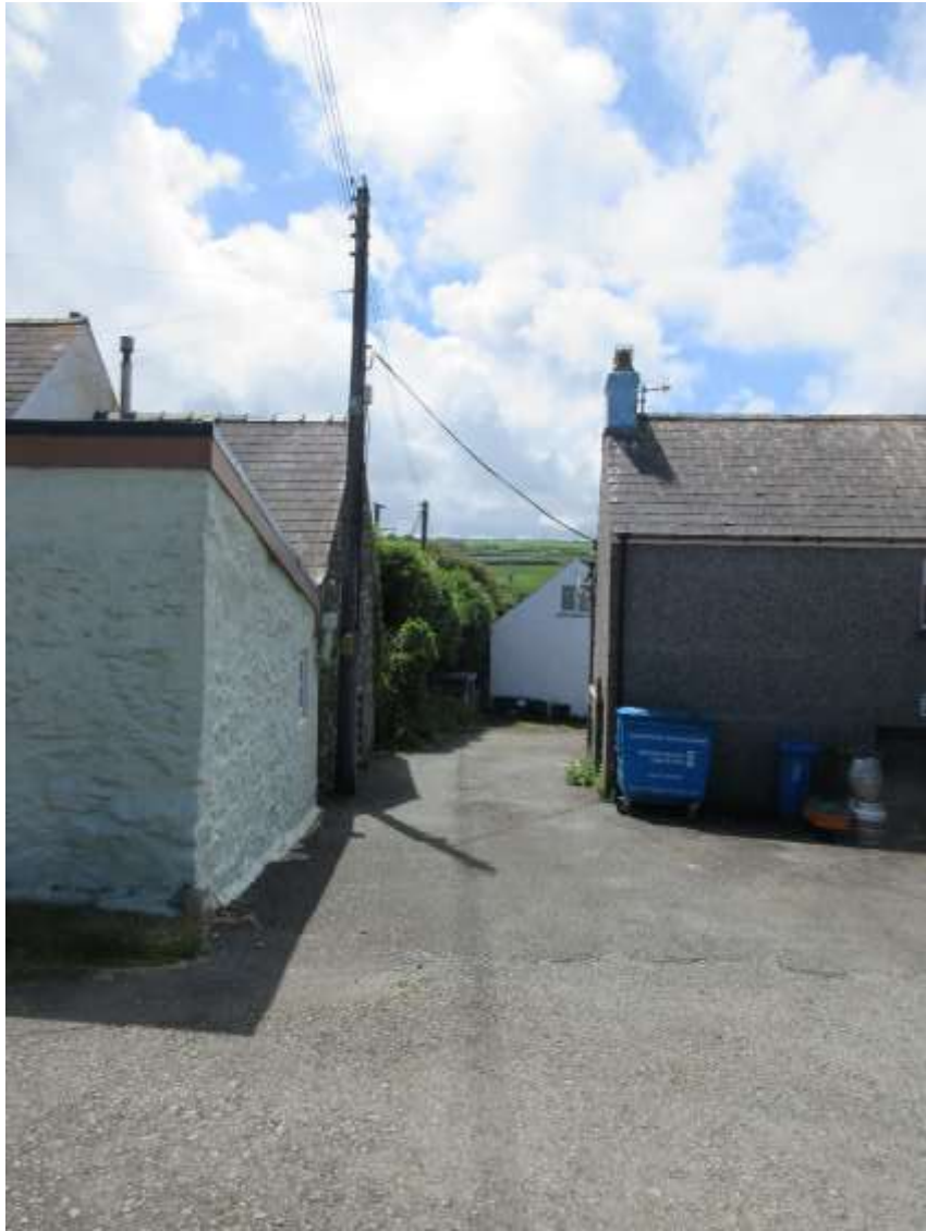
Ffigwr 38 -Cipolwg tua'r de rhwng tai, Ffordd-y-Felin