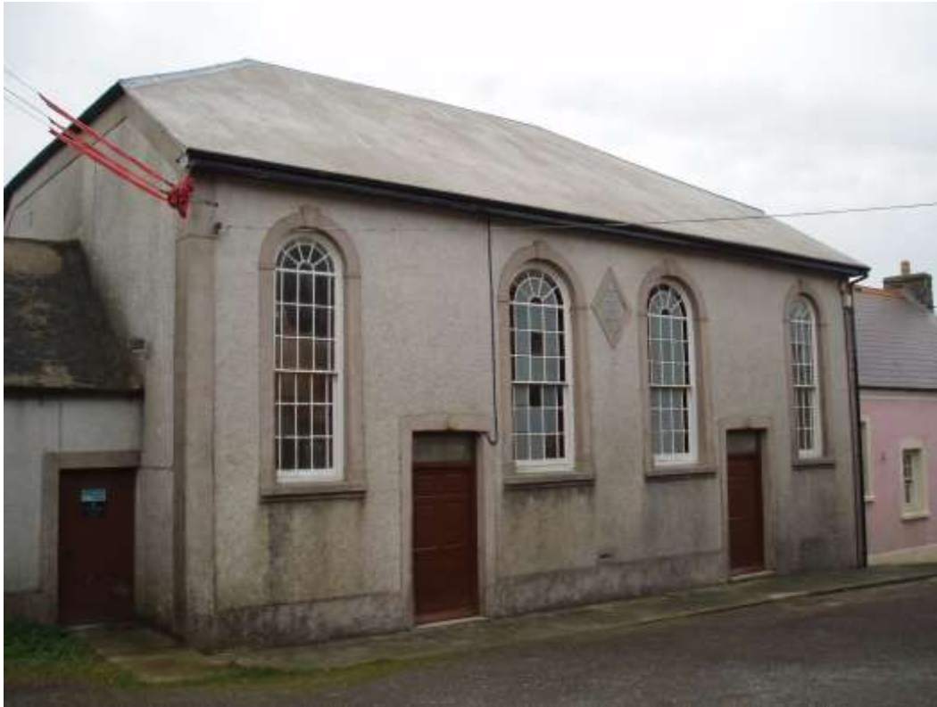
Ffigwr 1 - Capel Methodistiaidd Calfinaidd Tre-fin - Gradd II rhestredig