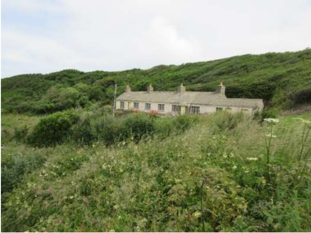
Ffigwr 35 - Y Cwm