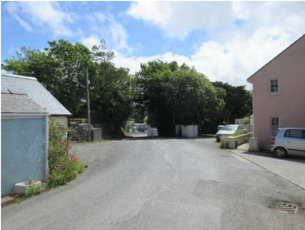
Ffigwr 11 - coed, Ffordd-yr-Afon