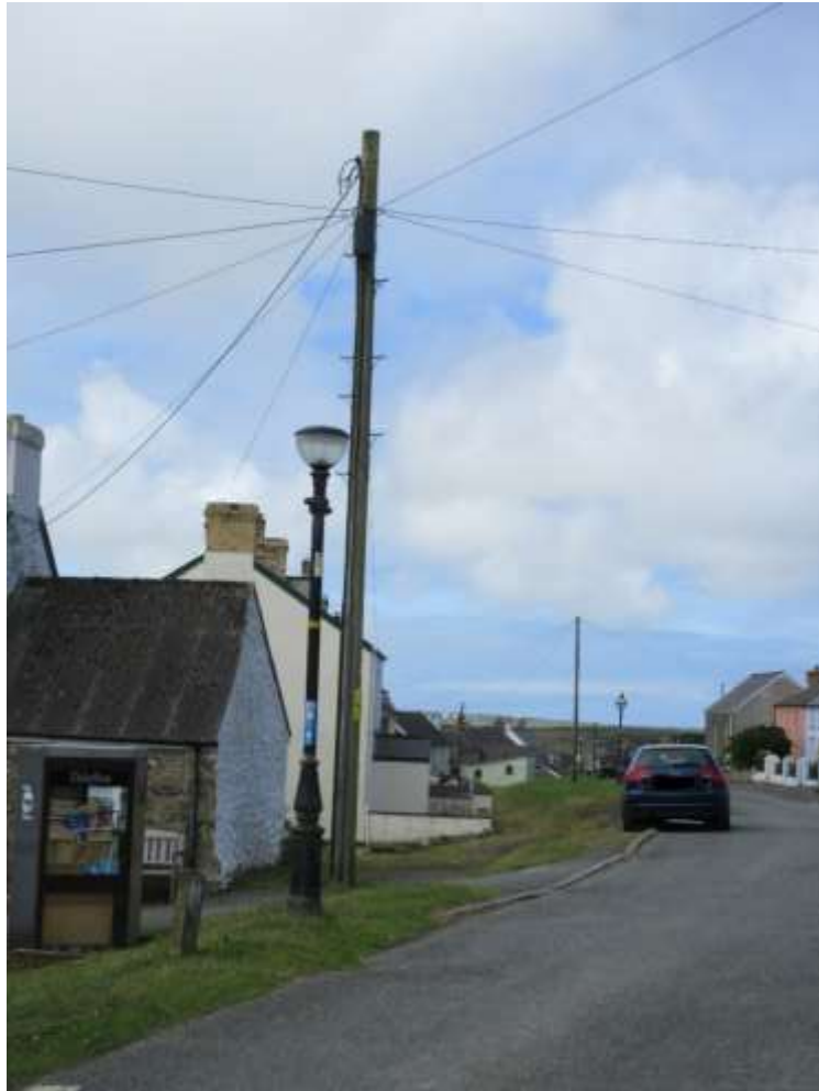
Ffigwr 14 - Agosrwydd goleuadau stryd sensitif a gwifrau ymwithiol