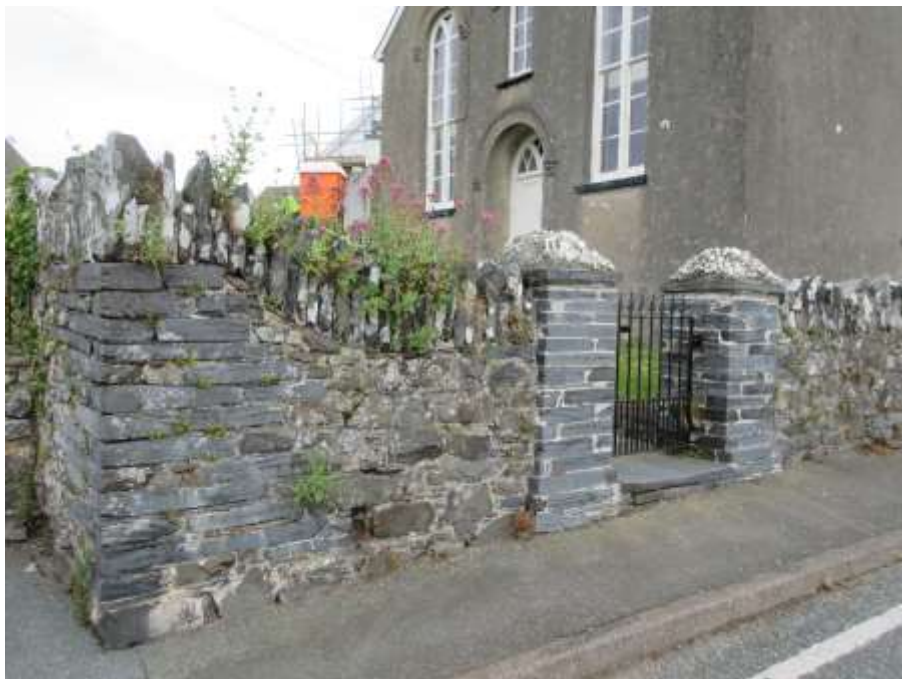
Ffigwr 4 - cwrttil hanesyddol nodweddiadol, cyn Capel y Bedyddwyr