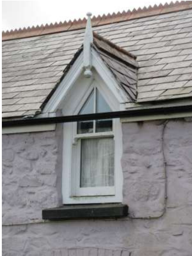
Ffigwr 22 -Ffenestr godi drionglog ar fyngalo dormer