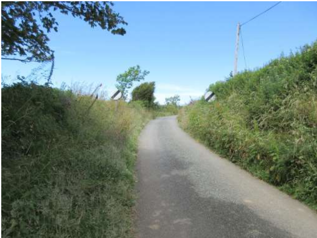
Ffigwr 34 - clawdd agored i'r gwynt