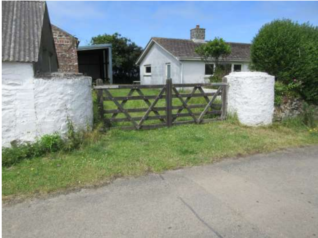
Ffigwr 33 - 'Jomiau' cerrig traddodiadol