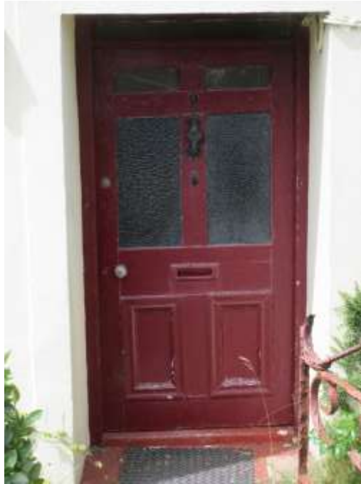
Ffigwr 24 - Drws 6 panel gyda gwydro diweddarach