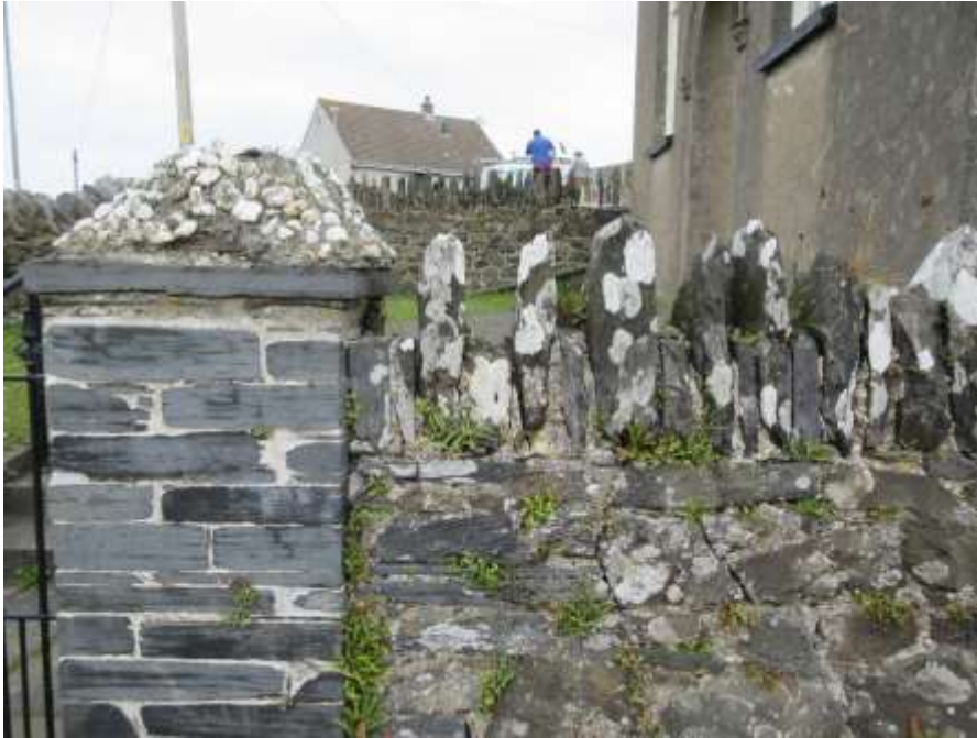
Ffigwr 31 - Waliau hen Gapel y Bedyddwyr