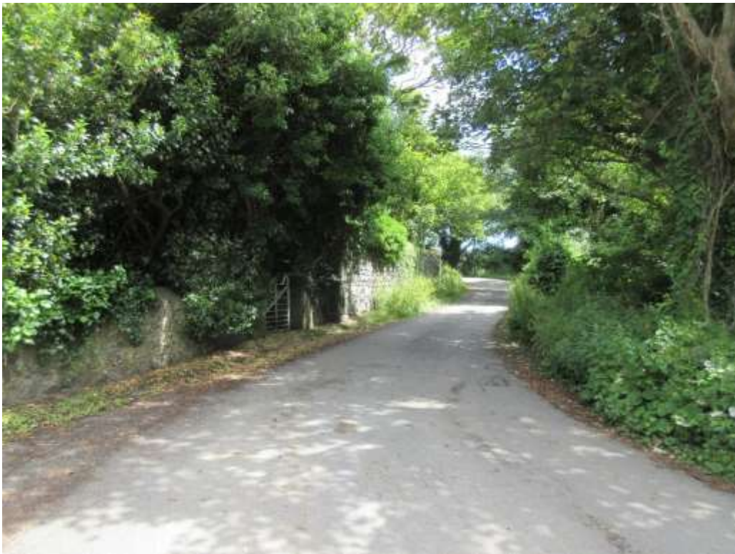
Ffigwr 12 - coed, Cartlett