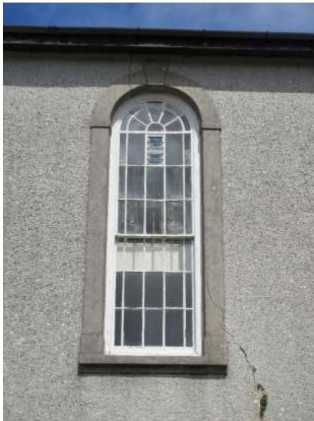
Ffigwr 23 -Ffenestr Capel Methodistiaid Calfinaidd