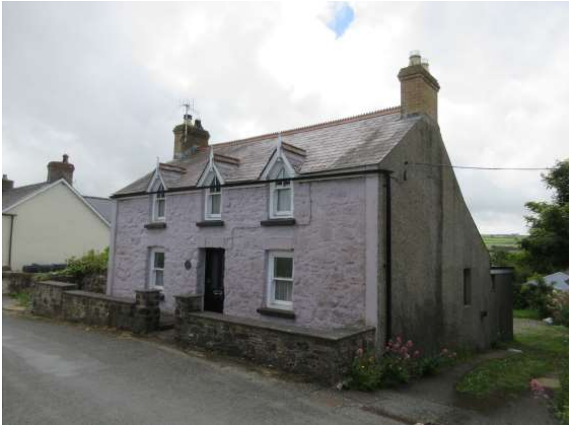
Ffigwr 3 - adeilad cadarnhaol