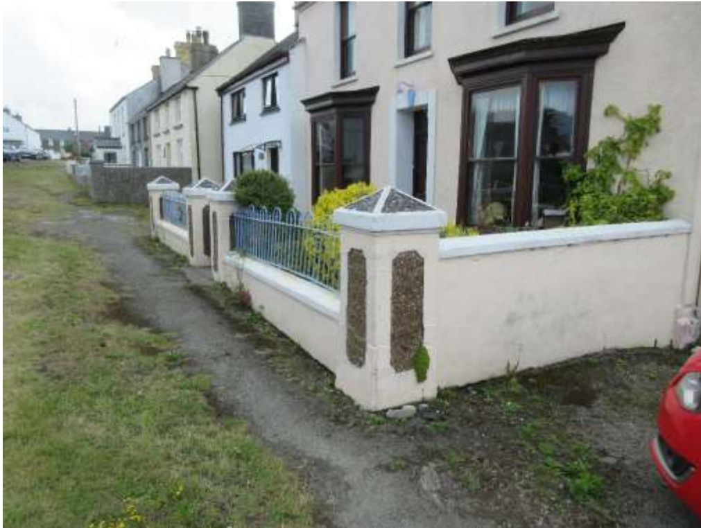
Ffigwr 5 - cwrtlau hanesyddol