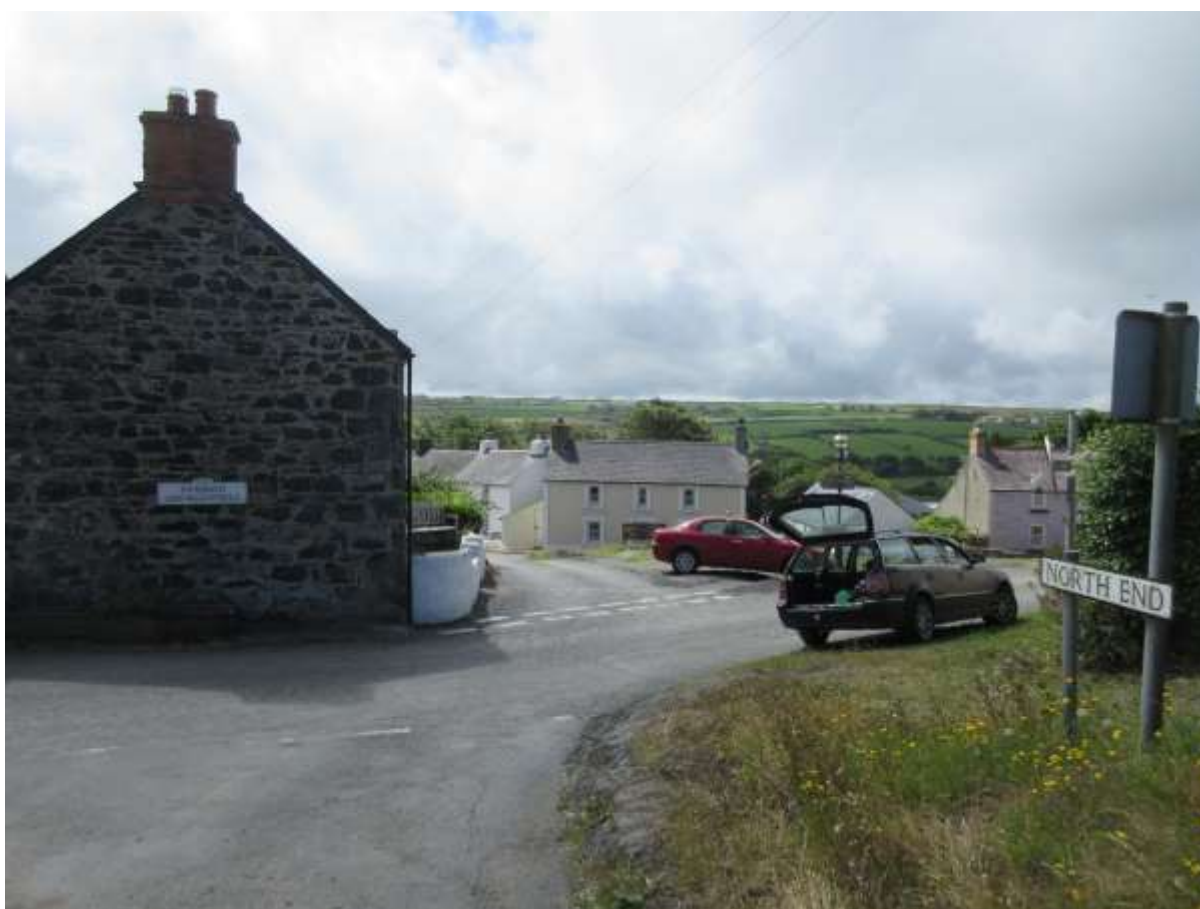
Ffigwr 37 -Yr olygfa o'r Pen Gogleddol