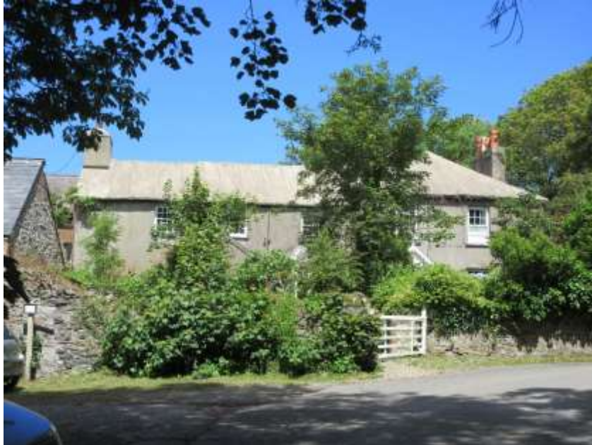
Ffigwr 27 - toeau wedi'u growtio