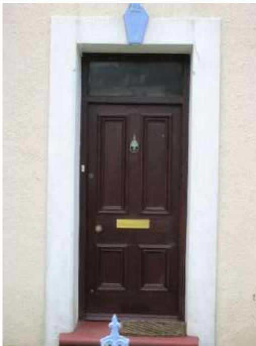
Ffigwr 25 - drws 4 panel gyda ffenestr uwchben