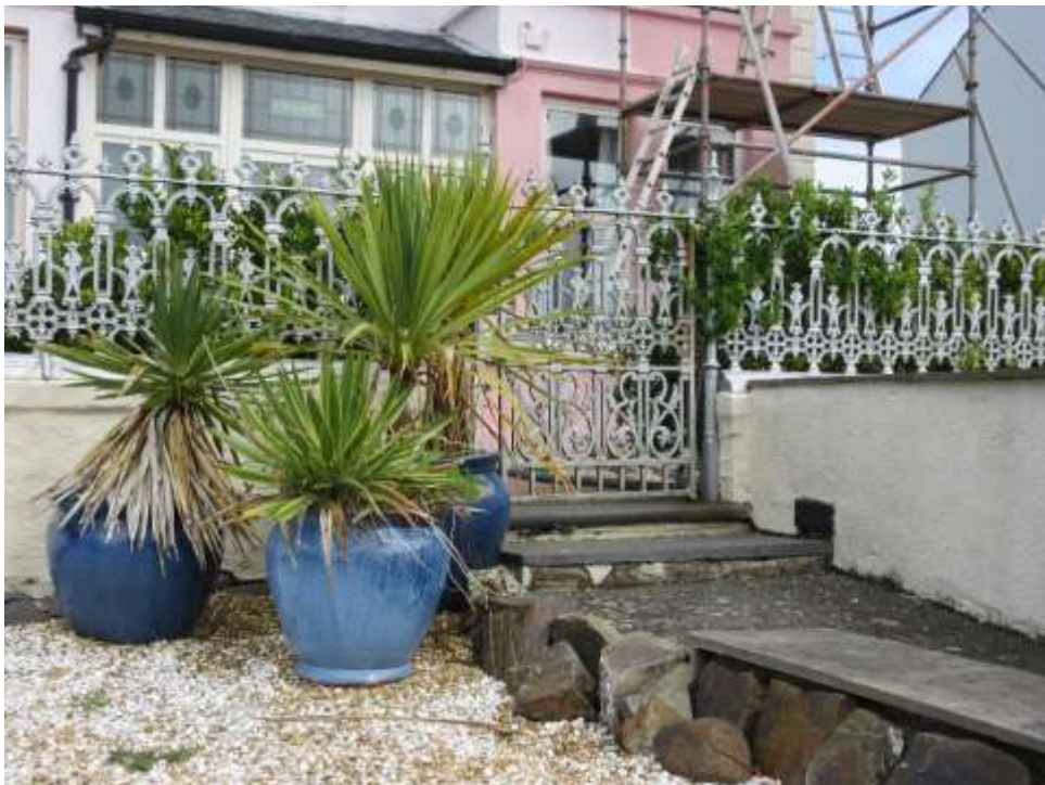
Ffigwr 32 - Rheiliau Edwardaidd