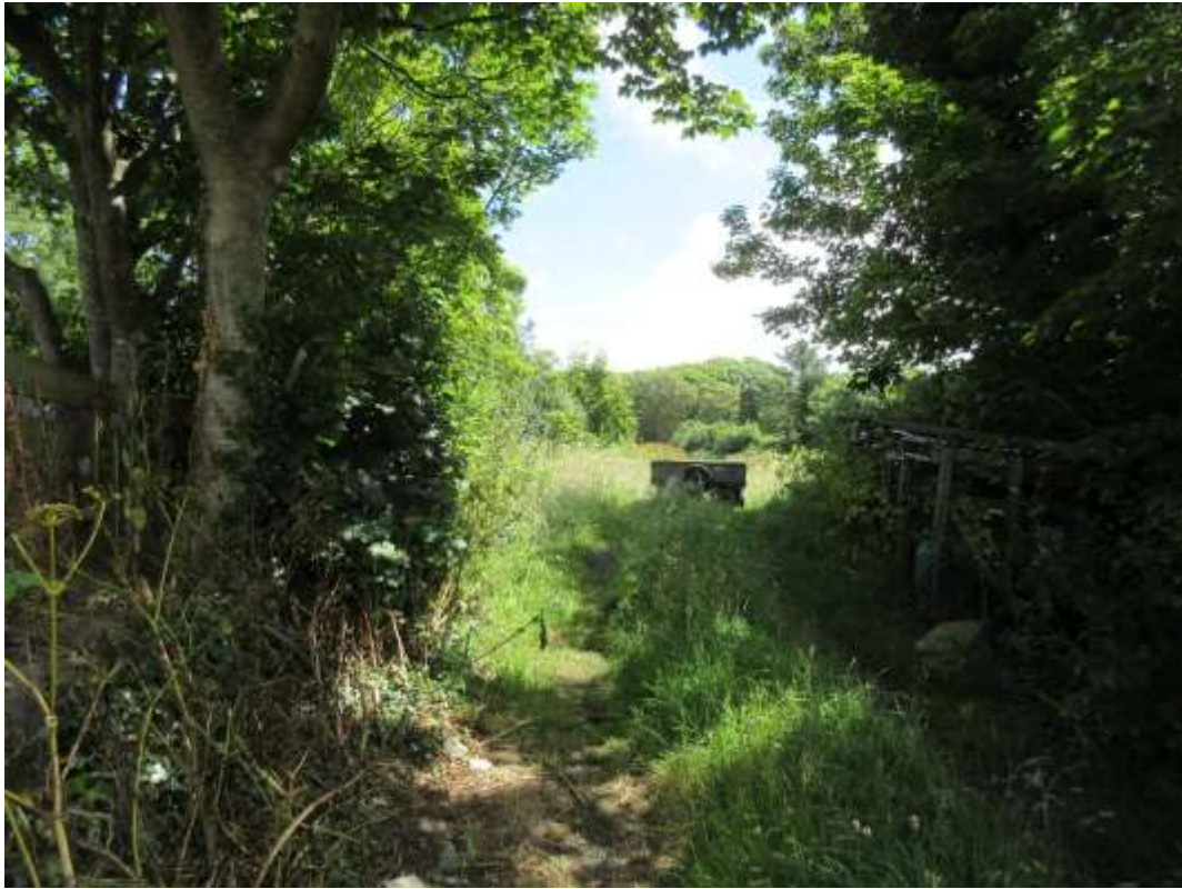
Ffigwr 9 -Tir i'r dwyrain o Ffordd-yr-Afon