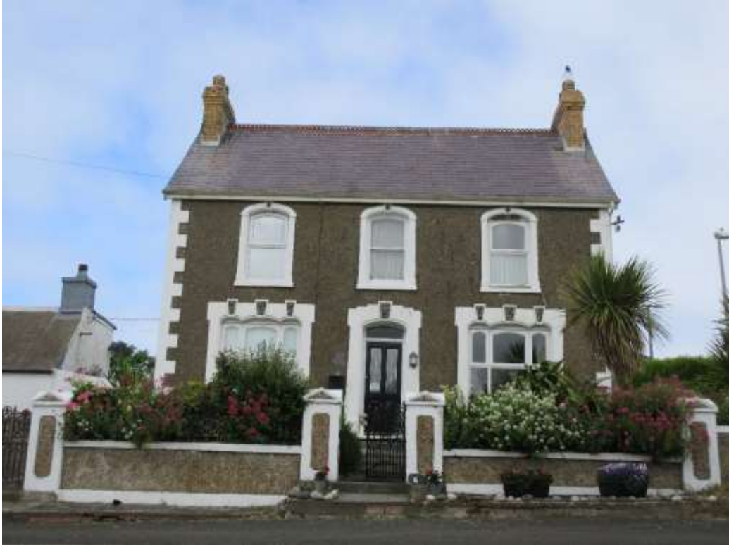
Ffigwr 17 - rendrad “dry dash” ac addurnol lleol traddodiadol