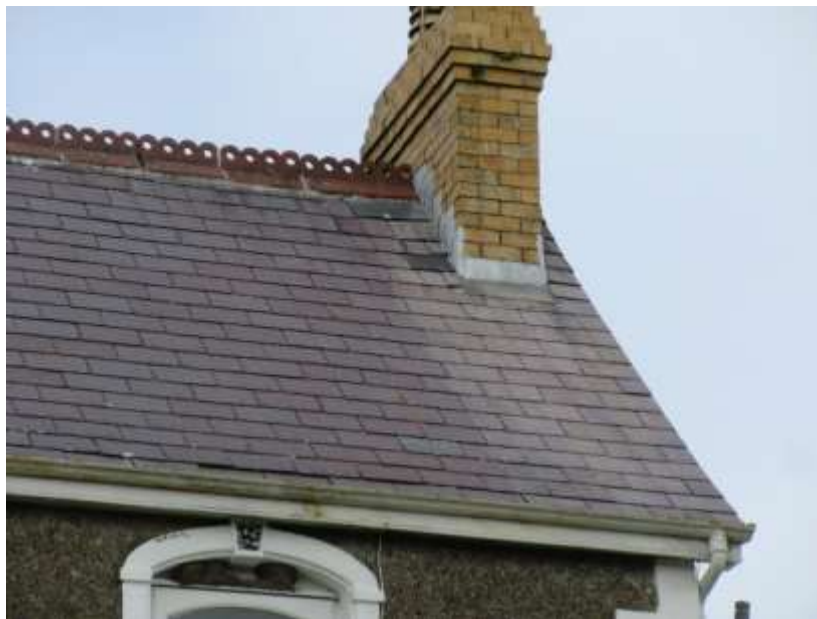
Ffigwr 28 - Llechi Gogledd Cymru