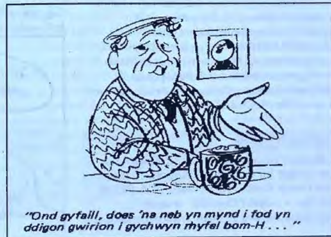
A Oes Heddwch 1983

Am fwy o wybodaeth ynglwn â CAAB, gweler www.caab.org.uk Am fwy o wybodaeth ynglwn â Menwith Hill http://cndyorks.gn.apc.org/mhs/index.htm Am fwy o wybodaeth ynglwn â Fforwm Heddwch a Chyfiawnder Wrecsam, cysyllter â wrexhamsaw@yahoo.com neu ffoniwch (0845) 330 4505.