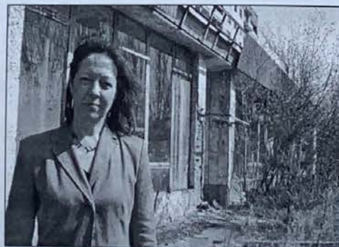
Jill ym Mhripyat