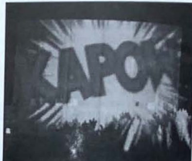
Llwyddodd aelodau o Greenpeace i ddiffinio 'KAPOW!' anferth ar ochr gorsaf niwclear Wylfa ym mis Chwefror 2006, i ddangos mor agored ydyw i ymosodiad gan frawychwyr

Gadewch i wneud hyn y gwbl glir. Mae PAWB am weld swyddi'n cael eu creu a datblygiad diwydiannol yn yr ardal ddifrifol o ddiweintiedig yma, ond rydan ni am weld swyddi sy'n rhai diogel i'r gweithwyr, y cyhoedd a'r amgylchedd.