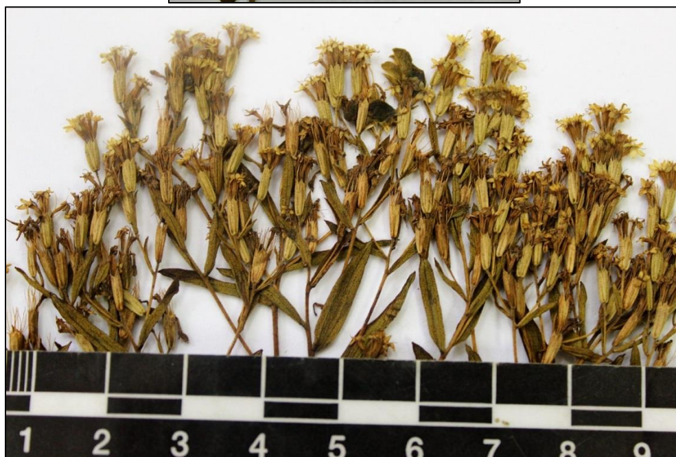
Figure 2 A, B. Stevia connata . A. Ejemplar en herbario (LAGU). B. Detalle de inflorescencias.