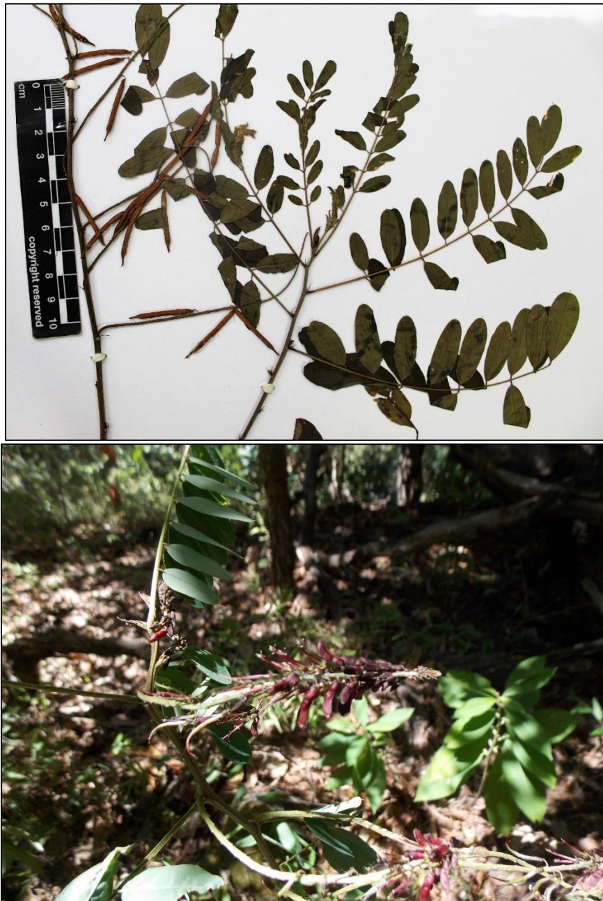
Figure 5. Indigofera costaricensis . A. Material en herbario (LAGU). B. Planta in situ .

CHALATENANGO: Mpio. San Ignacio, Ctón. Río Chiquito, Bosque de Conífera, 14°21'31.7"N 89°7'55.3"W, 1979 m, 17 nov 2017 (flr), Hernández s.n. (MHES, MO).