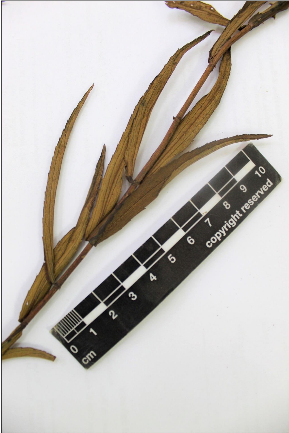
Figure 2C. Stevia connata . Hojas.