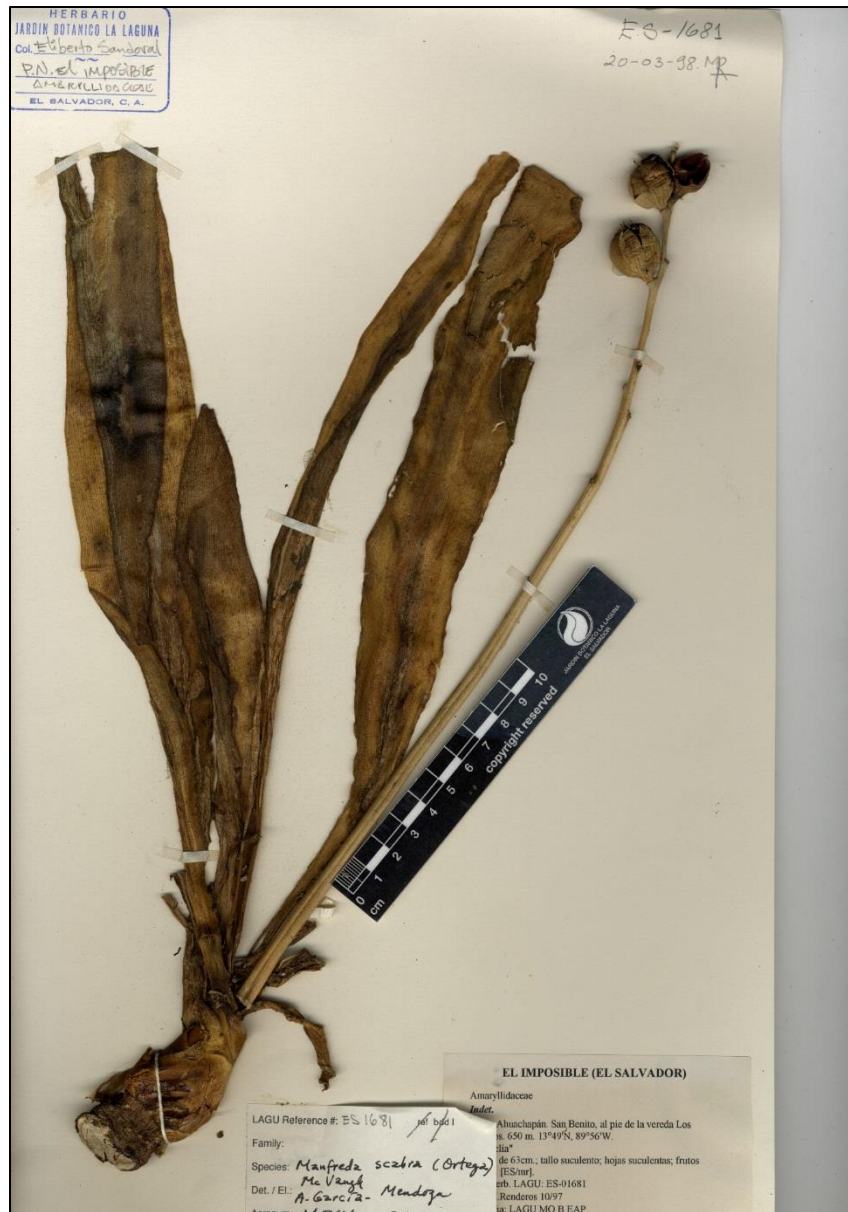
Figure 1. Manfreda pubescens . Ejemplar en herbario (LAGU).

AHUACHAPÁN: P.N. El Imposible, San Benito, al S de Monte Hermoso, 13°49'N 89°56'W, 9 jul 1994 (flr), Chinchilla s.n. (ISB00527) (B, LAGU); P.N. El Imposible, San Benito, al pie de la Vereda Los Escobos, 13°49'N 89°56'W, 650 m, 11 sep 1997 (frt), Sandoval 1681 (B, EAP, ITIC, LAGU, MO). SANTA ANA: Mpio. Metapán, Crío. El Rosario, Cerro La Experiencia, Bosque Pino-Roble, 14°21'34"N 89°22'54"W, 1080 m, 12 sep 2013, Cerén, Menjívar, Baños & Mendoza 3076 (MHES); Mpio. Metapán, P.N. Montecristo, Buena Vista, Quebrada de Vidal, 14°22'25.28"N 89°24'2.18"W, 1174 m, 10 ago 2016 (frt), Martínez 34 (JBL07849) (LAGU).