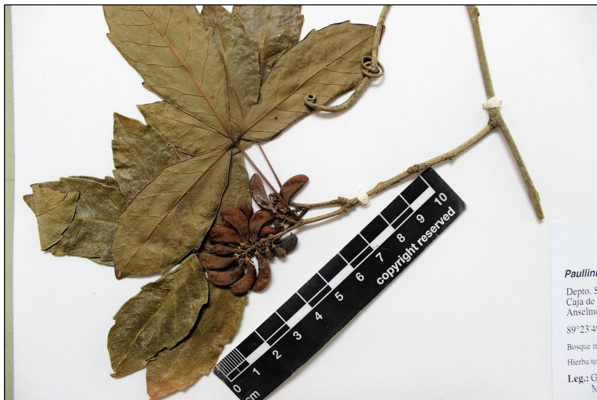
Figure 8. Paullinia turbacensis . Material en herbario (LAGU), con frutos.

SANTA ANA: Metapán, San José Ingenio, P.N. Montecristo, calle a Caja de Agua, Bosque tropical semideciduo mixto submontano, bien drenado, 14°21'50"N 89°23'52.9"W, 908 m, 11 jun 2015 (frt), Rodríguez, López & Magaña 5308 (B, LAGU, US); P.N. Montecristo, Caja de Agua hacia San José Ingenio, frente a Casa de Anselmo, Bosque tropical semideciduo mixto submontano, bien drenado, 14°21'54.8"N 89°23'49"W, 945 m, 27 jul 2016 (flr, frt), Galán & Martínez 3727 (LAGU, MO, US).