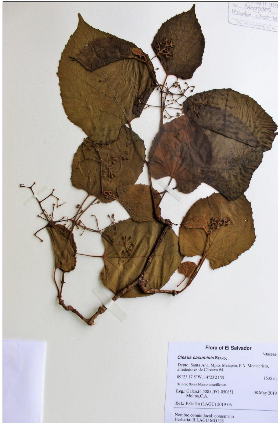
Figure 10. Cissus cacuminis . A. Ejemplar en herbario (LAGU).

SANTA ANA: Mpio. Metapán, P.N. Montecristo, alrededores de Cárcava #4, 14°23'21''N 89°23'17.5''W, 1535 m, 8 de mayo de 2019 (flr), Galán & Molina 5085 (B, LAGU, MO, US).