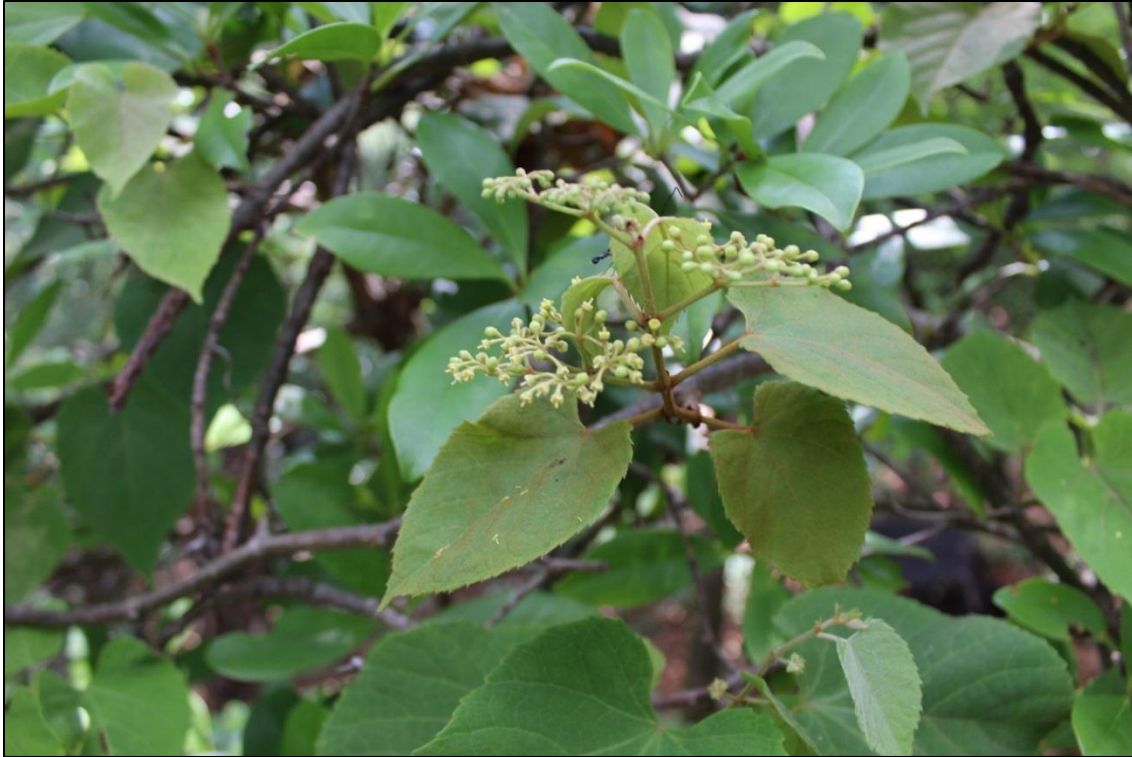
Figure 10. Cissus cacumini . B. Inflorescencia in situ .