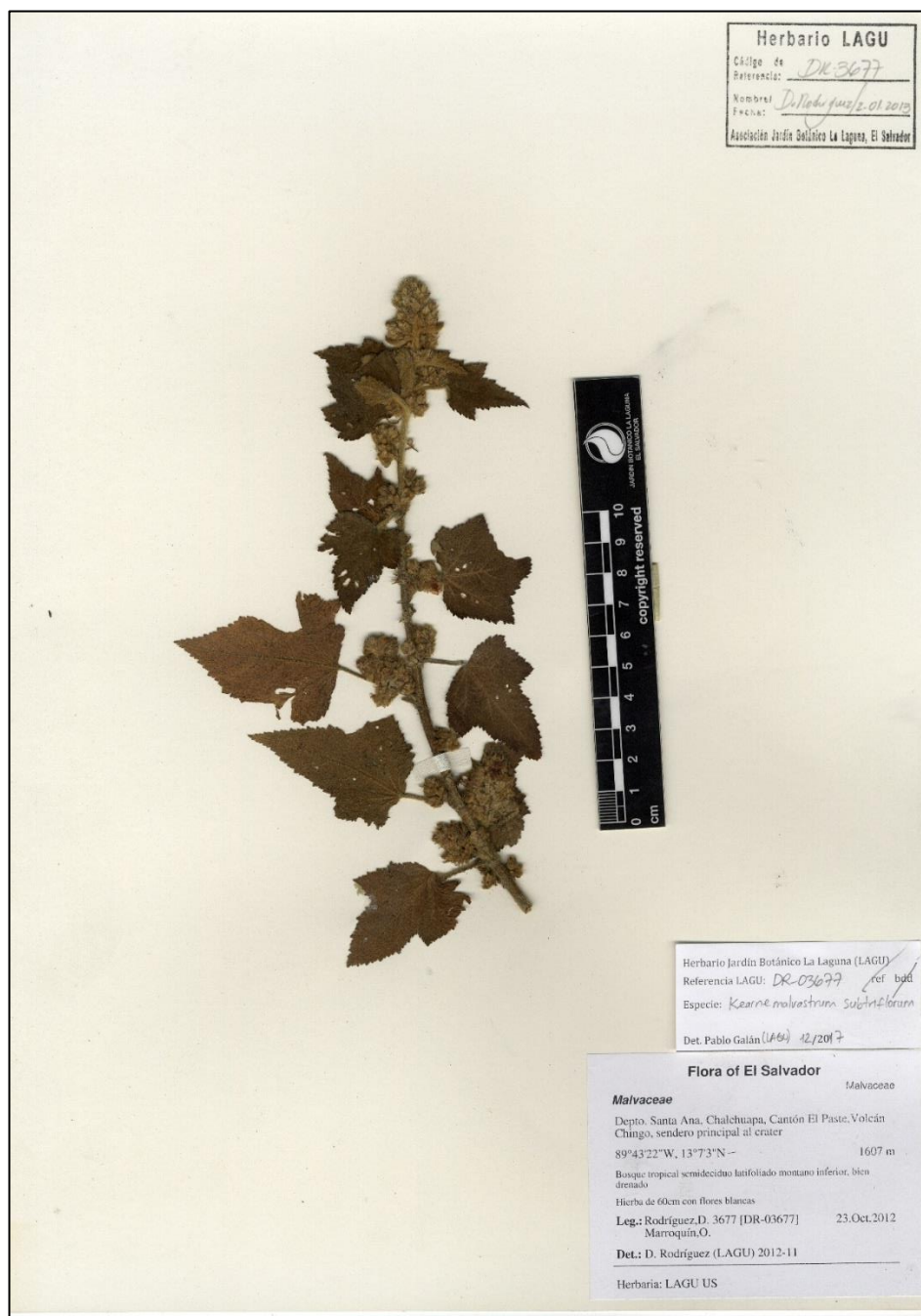
Figure 7. Kearnemalvastrum subtriflorum . Ejemplar en herbario (LAGU).

SANTA ANA: Mpio. Chalchuapa, Cantón El Paste, Volcán Chingo, sendero principal al cráter, bosque tropical semideciduo latifoliado montano inferior, bien drenado, 13°7'3.67"N 89°43'22.03"W, 1607 m, 23 oct 2012 (flr), Rodríguez & Marroquín 3677 (LAGU, US).