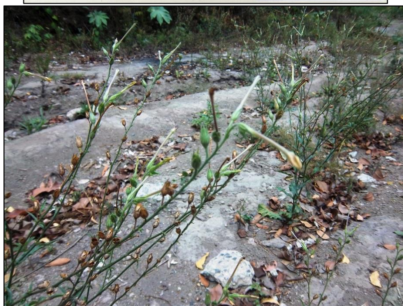
Figure 9. Nicotiana plumbaginifolia . A. Ejemplar en herbario (LAGU). B. Planta in situ, detalle de flores y frutos.