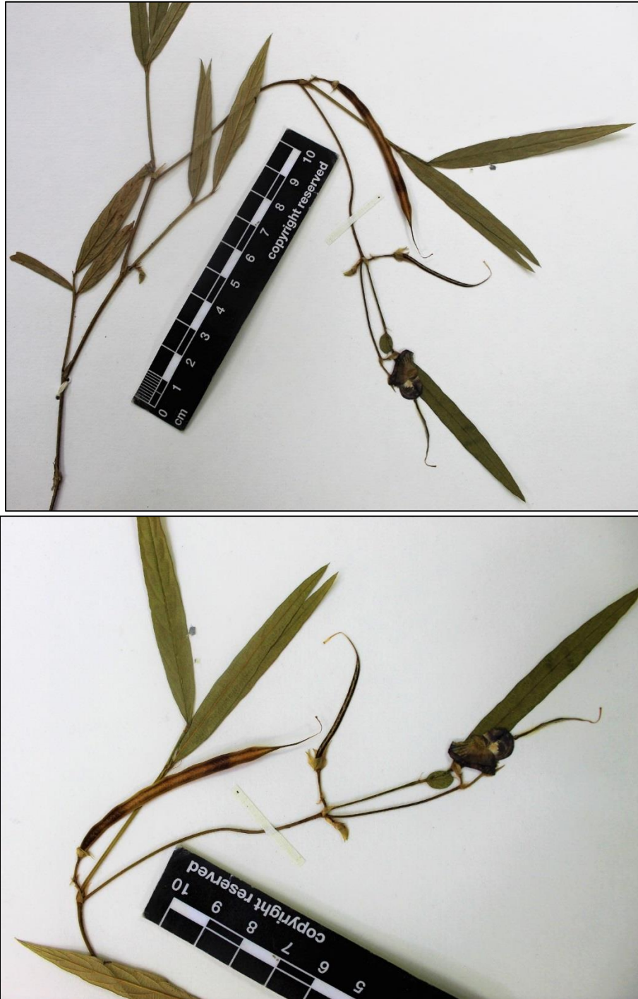
Figure 4. Centrosema pascuorum en herbario (LAGU).

MORAZÁN: Mpio. Arambala, Cantón Cumaro, A.P. Río Sapo, Camino a Piedra X, 13°55'N 88°60'W, 686 m, 15 oct 2003 (flr, frt), Carballo & Monterrosa 976 (LAGU).