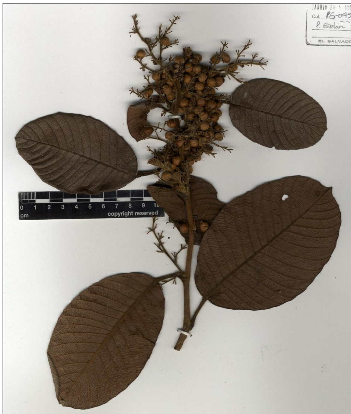
Figure 3. Davilla kunthii . Ejemplar en herbario (LAGU).

MORAZÁN: Mpio. San Fernando, Ctón. Azacualpa, Crío. Platanares, sendero a Cascada El Chorrerón, Área abierta, orilla de sendero, 13°57'47.01''N 88°13'45.92''W, 733 m, 13 feb 2019 (frt), Galán et al. 4949 (LAGU, MO).