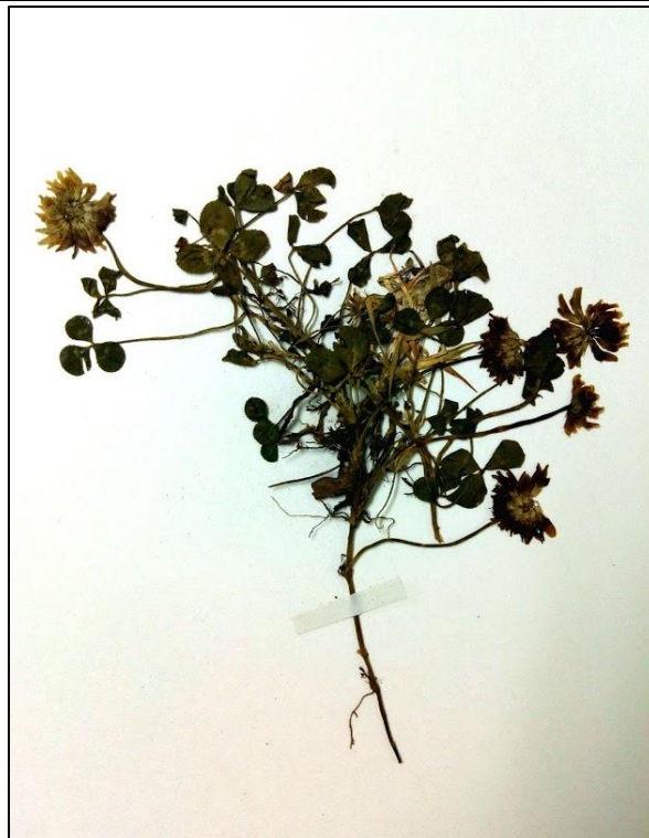
Figure 6. Trifolium repens . A. In situ . B. Ejemplar de herbario.